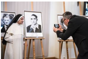
Wręczenie not identyfikacyjnych rodzinom ofiar komunizmu – Warszawa, 3 grudnia 2019.