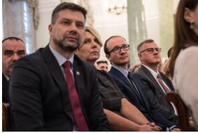
Wręczenie not identyfikacyjnych rodzinom ofiar komunizmu – Warszawa, 3 grudnia 2019.