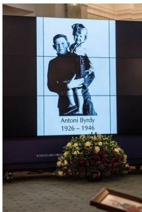
Wręczenie not identyfikacyjnych rodzinom ofiar komunizmu - Warszawa, 3 grudnia 2019.