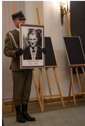
Wręczenie not identyfikacyjnych rodzinom ofiar komunizmu – Warszawa, 3 grudnia 2019.