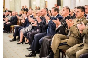
Wręczenie not identyfikacyjnych rodzinom ofiar komunizmu – Warszawa, 3 grudnia 2019.