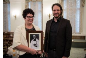
Wręczenie not identyfikacyjnych rodzinom ofiar komunizmu – Warszawa, 3 grudnia 2019.