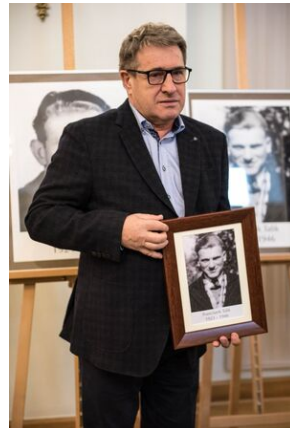
Wręczenie not identyfikacyjnych rodzinom ofiar komunizmu – Warszawa, 3 grudnia 2019.