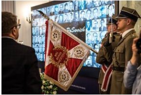
Wręczenie not identyfikacyjnych rodzinom ofiar komunizmu – Warszawa, 3 grudnia 2019.