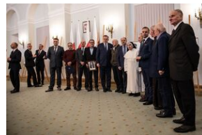
Wręczenie not identyfikacyjnych rodzinom ofiar komunizmu – Warszawa, 3 grudnia 2019.