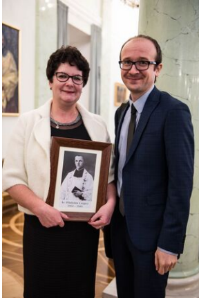
Wręczenie not identyfikacyjnych rodzinom ofiar komunizmu - Warszawa, 3 grudnia 2019.