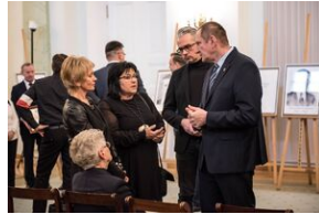
Wręczenie not identyfikacyjnych rodzinom ofiar komunizmu – Warszawa, 3 grudnia 2019.