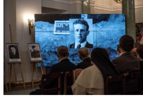
Wręczenie not identyfikacyjnych rodzinom ofiar komunizmu – Warszawa, 3 grudnia 2019.