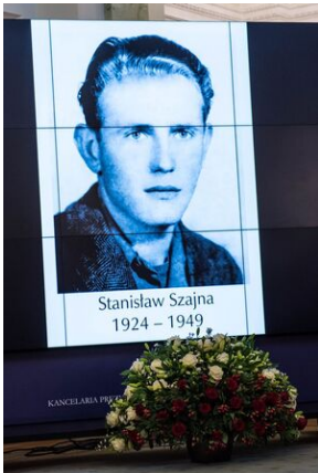
Wręczenie not identyfikacyjnych rodzinom ofiar komunizmu – Warszawa, 3 grudnia 2019.