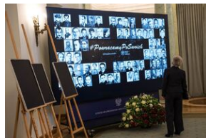
Wręczenie not identyfikacyjnych rodzinom ofiar komunizmu – Warszawa, 3 grudnia 2019.