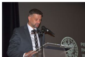
7 czerwca 2019. Otwarcie wystawy IPN w domu rodzinnym Jana Pawła II w Wadowicach