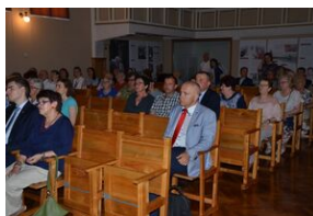
7 czerwca 2019. Otwarcie wystawy IPN w domu rodzinnym Jana Pawła II w Wadowicach