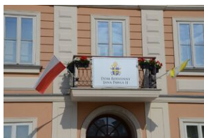
7 czerwca 2019. Otwarcie wystawy IPN w domu rodzinnym Jana Pawła II w Wadowicach