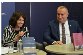
Archiwalna środa na „Przystanku Historia” w Krakowie.