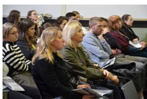
Archiwalna środa na „Przystanku Historia” w Krakowie.