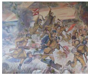
Kościół w Sołach. Fresk przedstawiający zwycięstwo nad bolszewikami w Bitwie Warszawskiej