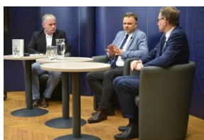
Spotkanie na „Przystanku Historia” IPN w Krakowie poświęcone słownikowi inteligencji polskiej w ZSRS.