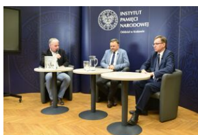
Spotkanie na „Przystanku Historia” IPN w Krakowie poświęcone słownikowi inteligencji polskiej w ZSRS.