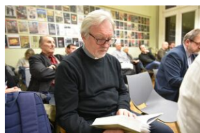
Spotkanie na „Przystanku Historia” IPN w Krakowie poświęcone słownikowi inteligencji polskiej w ZSRS.