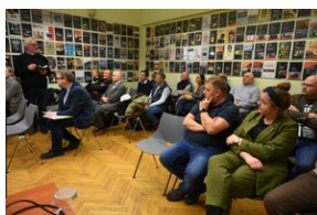
Spotkanie na „Przystanku Historia” IPN w Krakowie poświęcone słownikowi inteligencji polskiej w ZSRS.