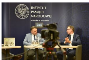
Spotkanie na „Przystanku Historia” IPN w Krakowie poświęcone słownikowi inteligencji polskiej w ZSRS.