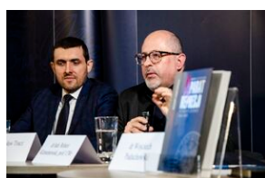
Konferencja naukowa o bezpieczeństwie w PRL i innych