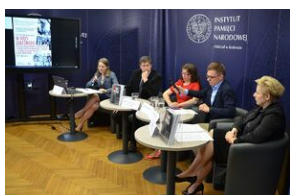
Konferencja naukowa o bezpieczeństwie w PRL i innych krajach bloku sowieckiego.