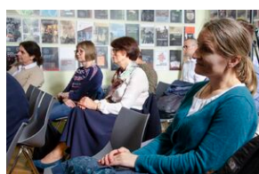
Konferencja naukowa o bezpieczeństwie w PRL i innych