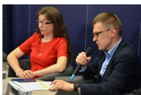
Konferencja naukowa o bezpieczeństwie w PRL i innych krajach bloku sowieckiego.