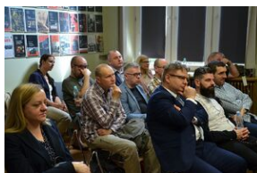
Konferencja naukowa o bezpieczeństwie w PRL i innych krajach bloku sowieckiego.