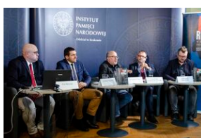
Konferencja naukowa o bezpieczeństwie w PRL i innych