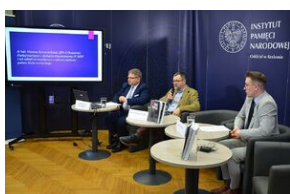
Konferencja naukowa o bezpieczeństwie w PRL i innych krajach bloku