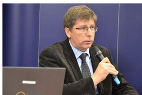
Konferencja naukowa o bezpieczeństwie w PRL i innych krajach bloku sowieckiego.