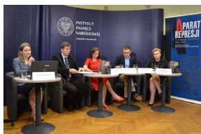
Konferencja naukowa o bezpieczeństwie w PRL i innych krajach bloku sowieckiego.