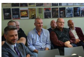
Konferencja naukowa o bezpieczeństwie w PRL i innych krajach bloku