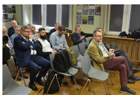
Konferencja naukowa o bezpieczeństwie w PRL i innych krajach bloku sowieckiego.