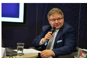
Konferencja naukowa o bezpieczeństwie w PRL i innych krajach bloku