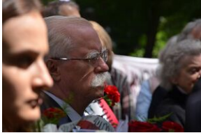
79. rocznica krwawej niedzieli na Wołyniu.