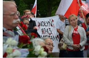
79. rocznica krwawej niedzieli na Wołyniu.