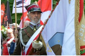
79. rocznica krwawej niedzieli na Wołyniu.