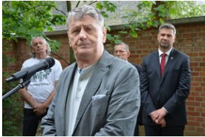
79. rocznica krwawej niedzieli na Wołyniu.