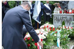
79. rocznica krwawej niedzieli na Wołyniu.