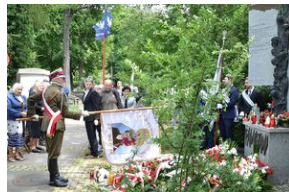
79. rocznica krwawej niedzieli na Wołyniu.