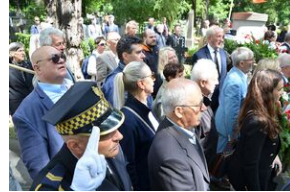
79. rocznica krwawej niedzieli na Wołyniu.