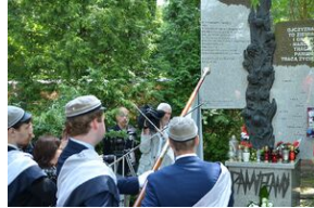
79. rocznica krwawej niedzieli na Wołyniu.