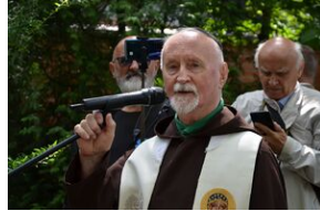
79. rocznica krwawej niedzieli na Wołyniu.