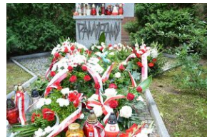
79. rocznica krwawej niedzieli na Wołyniu.