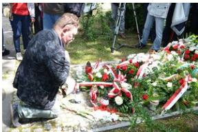
79. rocznica krwawej niedzieli na Wołyniu.