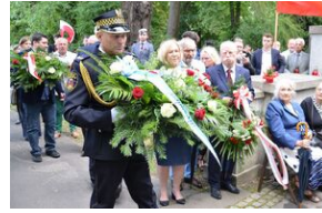
79. rocznica krwawej niedzieli na Wołyniu.