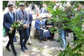
79. rocznica krwawej niedzieli na Wołyniu.