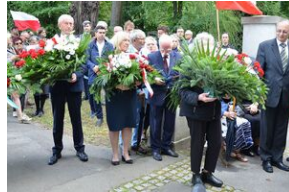
79. rocznica krwawej niedzieli na Wołyniu.