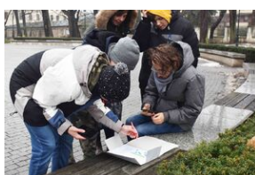
Gra miejska „Spacerniak” w Kielcach.