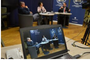
Dyskusja na Przystanku Historia IPN w Krakowie.