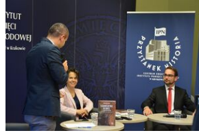
Dyskusja na Przystanku Historia IPN w Krakowie.