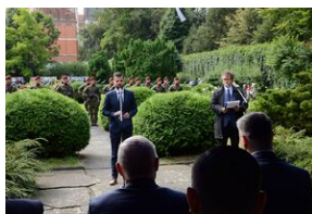
75. rocznica rozbicia więzienia św. Michała w Krakowie.