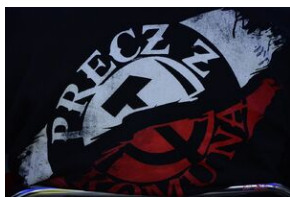
75. rocznica rozbicia więzienia św. Michała w Krakowie.