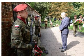
75. rocznica rozbicia więzienia św. Michała w Krakowie.