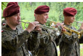
75. rocznica rozbicia więzienia św. Michała w Krakowie.