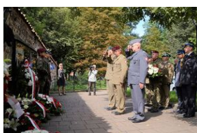
75. rocznica rozbicia więzienia św. Michała w Krakowie.