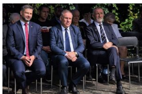
75. rocznica rozbicia więzienia św. Michała w Krakowie.