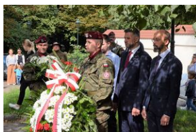
75. rocznica rozbicia więzienia św. Michała w Krakowie.