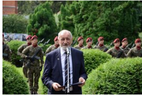
75. rocznica rozbicia więzienia św. Michała w Krakowie.