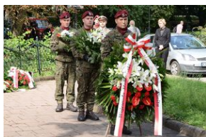
75. rocznica rozbicia więzienia św. Michała w Krakowie.