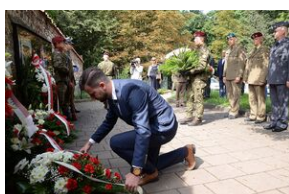
75. rocznica rozbicia więzienia św. Michała w Krakowie.