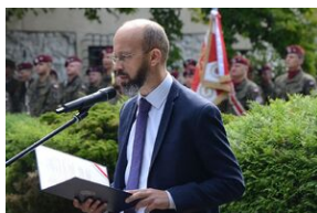
75. rocznica rozbicia więzienia św. Michała w Krakowie.