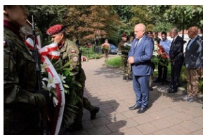
75. rocznica rozbicia więzienia św. Michała w Krakowie.