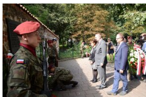
75. rocznica rozbicia więzienia św. Michała w Krakowie.