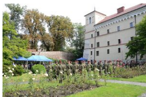
75. rocznica rozbicia więzienia św. Michała w Krakowie.