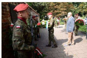
75. rocznica rozbicia więzienia św. Michała w Krakowie.