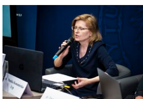
Ogólnopolska konferencja naukowa „Za kulisami bezpieczeństwa...”.