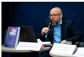
Ogólnopolska konferencja naukowa „Za kulisami bezpieczeństwa...”.