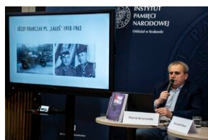
Ogólnopolska konferencja naukowa „Za kulisami bezpieki...”.