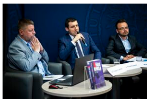
Ogólnopolska konferencja naukowa „Za kulisami bezpieki...”.