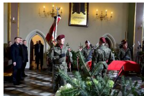
Kraków, 21 grudnia 2019. Uroczystości pogrzebowe gen. Tadeusza Bieńkowicza „Rączego”