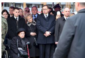
Kraków, 21 grudnia 2019. Uroczystości pogrzebowe gen. Tadeusza Bieńkowicza „Rączego”