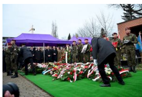
Kraków, 21 grudnia 2019. Uroczystości pogrzebowe gen. Tadeusza Bieńkowicza „Rączego”