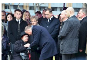
Kraków, 21 grudnia 2019. Uroczystości pogrzebowe gen. Tadeusza Bieńkowicza „Rączego”