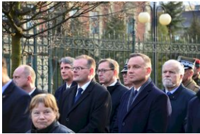
Kraków, 21 grudnia 2019. Uroczystości pogrzebowe gen. Tadeusza Bieńkowicza „Rączego”