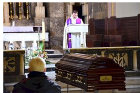
Kraków, 21 grudnia 2019. Uroczystości pogrzebowe gen. Tadeusza Bieńkowicza „Rączego”