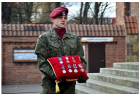
Kraków, 21 grudnia 2019. Uroczystości pogrzebowe gen. Tadeusza Bieńkowicza „Rączego”