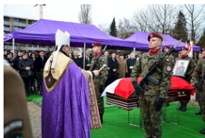
Kraków, 21 grudnia 2019. Uroczystości