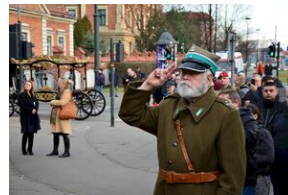
Kraków, 21 grudnia 2019. Uroczystości pogrzebowe gen. Tadeusza Bieńkowicza „Rączego”