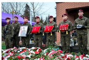
Kraków, 21 grudnia 2019. Uroczystości pogrzebowe gen. Tadeusza Bieńkowicza „Rączego”