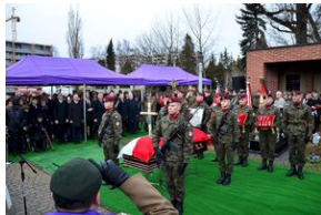
Kraków, 21 grudnia 2019. Uroczystości pogrzebowe gen. Tadeusza Bieńkowicza „Rączego”