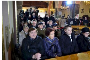
Kraków, 21 grudnia 2019. Uroczystości pogrzebowe gen. Tadeusza Bieńkowicza „Rączego”