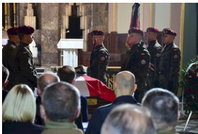
Kraków, 21 grudnia 2019. Uroczystości pogrzebowe gen. Tadeusza Bieńkowicza „Rączego”