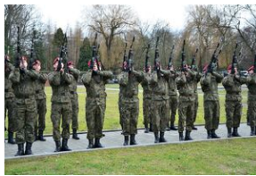
Kraków, 21 grudnia 2019. Uroczystości pogrzebowe gen. Tadeusza Bieńkowicza „Rączego”