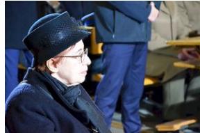
Kraków, 21 grudnia 2019. Uroczystości pogrzebowe gen. Tadeusza Bieńkowicza „Rączego”