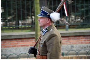
Kraków, 21 grudnia 2019. Uroczystości pogrzebowe gen. Tadeusza Bieńkowicza „Rączego”