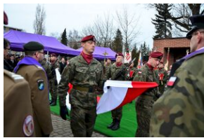
Kraków, 21 grudnia 2019. Uroczystości pogrzebowe gen. Tadeusza Bieńkowicza „Rączego”