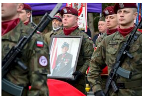
Kraków, 21 grudnia 2019. Uroczystości