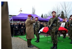
Kraków, 21 grudnia 2019. Uroczystości