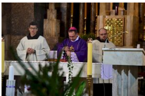
Kraków, 21 grudnia 2019. Uroczystości pogrzebowe gen. Tadeusza Bieńkowicza „Rączego”