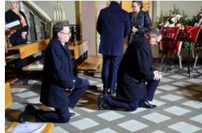
Kraków, 21 grudnia 2019. Uroczystości pogrzebowe gen. Tadeusza Bieńkowicza „Rączego”