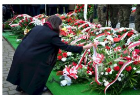
Kraków, 21 grudnia 2019. Uroczystości pogrzebowe gen. Tadeusza Bieńkowicza „Rączego”