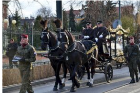
Kraków, 21 grudnia 2019. Uroczystości pogrzebowe gen. Tadeusza Bieńkowicza „Rączego”