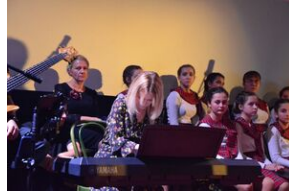
17 listopada 2019. Koncert finałowy Festiwalu Piosenki Nieziomnej i Niepodległej w Krakowie