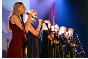
17 listopada 2019. Koncert finałowy Festiwalu Piosenki Nieziomnej i Niepodległej w Krakowie