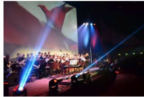
17 listopada 2019. Koncert finałowy Festiwalu Piosenki Nieziomnej i Niepodległej w Krakowie