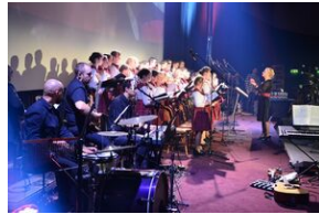
17 listopada 2019. Koncert finałowy Festiwalu Piosenki Nieziomnej i Niepodległej w Krakowie