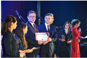
17 listopada 2019. Koncert finałowy Festiwalu Piosenki Nieziomnej i Niepodległej w Krakowie