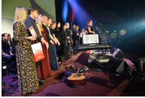
17 listopada 2019. Koncert finałowy Festiwalu Piosenki Nieziomnej i Niepodległej w Krakowie