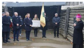
16 listopada 2019. Uczestnicy krakowskiej wyprowy akademickiej w Sachsenhausen