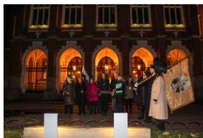
Wyprawa akademicka „Śladami Sonderaktion Krakau - in memoriam prof. Andrzeja Mańckiego” - Kraków, 14 listopada 2019