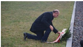
16 listopada 2019. Uczestnicy krakowskiej wyprowy akademickiej w Sachsenhausen