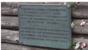
16 listopada 2019. Uczestnicy krakowskiej wyprowy akademickiej w Sachsenhausen