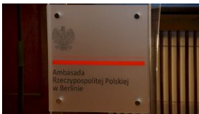
16 listopada 2019. Spotkanie w