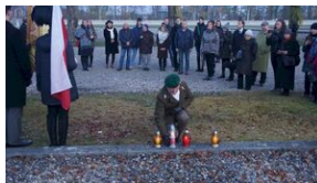
Wyprawa akademicka śladami Sonderaktion Krakau, Norymberga i Dachau