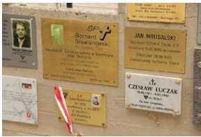
Wyprowa akademicka 2019. Mauthausen- Gusen