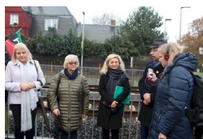
16 listopada 2019. Wyprawa akademicka z Krakowa dotarła do Sachsenhausen