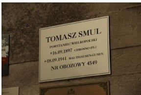
Wyprowa akademicka 2019. Mauthausen- Gusen