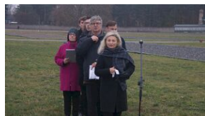
16 listopada 2019. Uczestnicy krakowskiej wyprowy akademickiej w Sachsenhausen