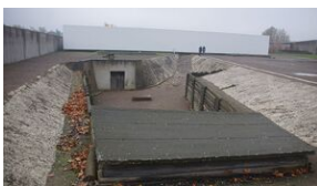
16 listopada 2019. Uczestnicy krakowskiej wyprowy akademickiej w Sachsenhausen