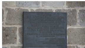
16 listopada 2019. Uczestnicy krakowskiej wyprowy akademickiej w Sachsenhausen