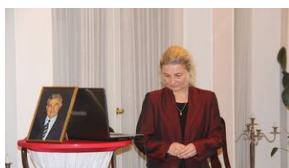
Wyprawa akademicka śladami Sonderaktion Krakau, Norymberga i Dachau