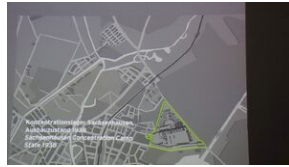
16 listopada 2019. Wyprowa akademicka z Krakowa dotaria do Sachsenhausen