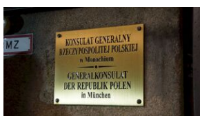
Wyprawa akademicka śladami Sonderaktion Krakau, Norymberga i Dachau