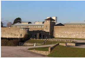
Wyprowa akademicka 2019. Mauthausen- Gusen