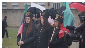
16 listopada 2019. Uczestnicy krakowskiej wyprowy akademickiej w Sachsenhausen