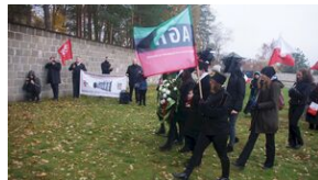
16 listopada 2019. Uczestnicy krakowskiej wyprowy akademickiej w Sachsenhausen