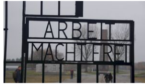
16 listopada 2019. Wyprowa akademicka z Krakowa dotaria do Sachsenhausen