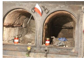
Wyprowa akademicka 2019. Mauthausen- Gusen