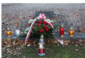
Wyprawa akademicka śladami Sonderaktion Krakau, Norymberga i Dachau