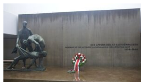
16 listopada 2019. Uczestnicy krakowskiej wyprowy akademickiej w Sachsenhausen