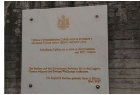
Wyprowa akademicka 2019. Mauthausen- Gusen