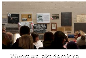
Wyprowa akademicka 2019. Mauthausen- Gusen