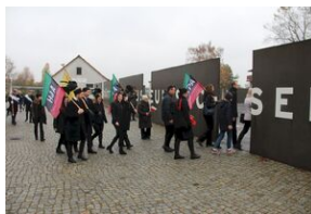
16 listopada 2019. Wyprawa akademicka z Krakowa dotarła do Sachsenhausen