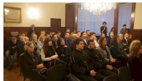
16 listopada 2019. Spotkanie w