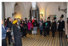
Wyprawa akademicka „Śladami Sonderaktion Krakau - in memoriam prof. Andrzeja Mańckiego” - Kraków, 14 listopada 2019