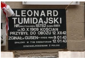
Wyprowa akademicka 2019. Mauthausen- Gusen