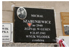
Wyprowa akademicka 2019. Mauthausen- Gusen