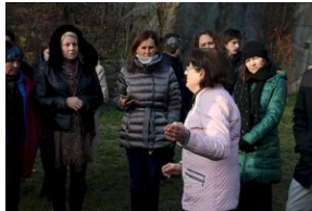
Wyprawa akademicka 2019. Mauthausen- Gusen