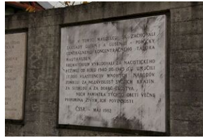
Wyprowa akademicka 2019. Mauthausen- Gusen