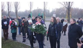
Wyprawa akademicka śladami Sonderaktion Krakau, Norymberga i Dachau