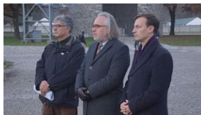
Wyprawa akademicka śladami Sonderaktion Krakau, Norymberga i Dachau