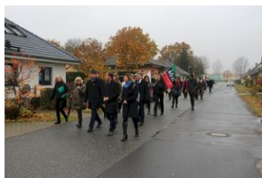
16 listopada 2019. Wyprawa akademicka z Krakowa dotarła do Sachsenhausen