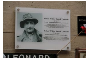
Wyprowa akademicka 2019. Mauthausen- Gusen