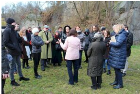
Wyprawa akademicka 2019. Mauthausen- Gusen