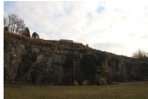
Wyprawa akademicka 2019. Mauthausen- Gusen