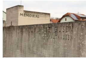
Wyprowa akademicka 2019. Mauthausen- Gusen