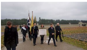
16 listopada 2019. Uczestnicy krakowskiej wyprowy akademickiej w Sachsenhausen