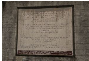
Wyprowa akademicka 2019. Mauthausen- Gusen