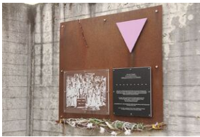
Wyprowa akademicka 2019. Mauthausen- Gusen