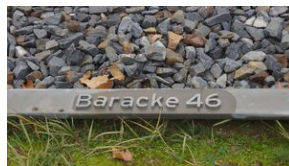
16 listopada 2019. Uczestnicy krakowskiej wyprowy akademickiej w Sachsenhausen