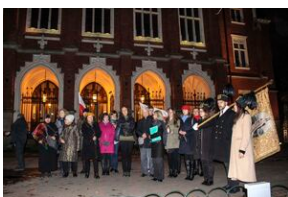
Wyprawa akademicka „Śladami Sonderaktion Krakau - in memoriam prof. Andrzeja Mańckiego” - Kraków, 14 listopada 2019