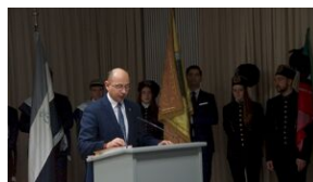
16 listopada 2019. Uczestnicy krakowskiej wyprowy akademickiej w Sachsenhausen