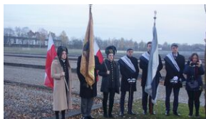
Wyprawa akademicka śladami Sonderaktion Krakau, Norymberga i Dachau