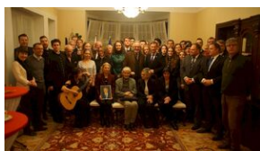
Wyprawa akademicka śladami Sonderaktion Krakau, Norymberga i Dachau