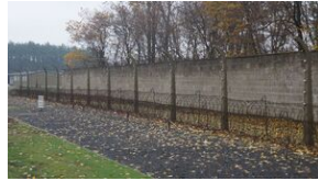
16 listopada 2019. Wyprowa akademicka z Krakowa dotaria do Sachsenhausen