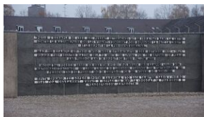
Wyprawa akademicka śladami Sonderaktion Krakau, Norymberga i Dachau