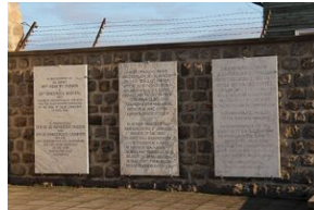
Wyprawa akademicka 2019. Mauthausen- Gusen