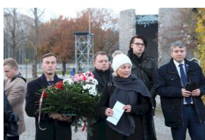
Wyprawa akademicka śladami Sonderaktion Krakau, Norymberga i Dachau