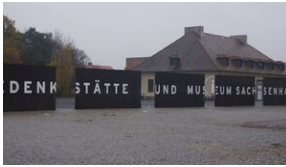
16 listopada 2019. Wyprowa akademicka z Krakowa dotaria do Sachsenhausen