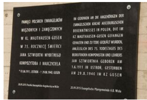
Wyprowa akademicka 2019. Mauthausen- Gusen