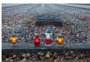
Wyprawa akademicka śladami Sonderaktion Krakau, Norymberga i Dachau