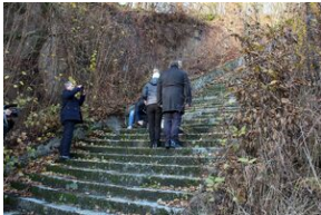
Wyprawa akademicka 2019. Mauthausen- Gusen