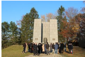
Wyprawa akademicka 2019. Mauthausen- Gusen