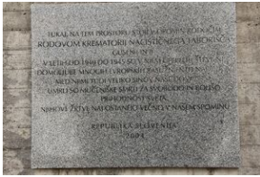
Wyprowa akademicka 2019. Mauthausen- Gusen