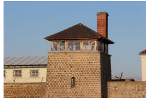
Wyprowa akademicka 2019. Mauthausen- Gusen