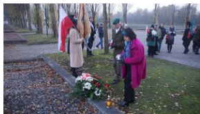
Wyprawa akademicka śladami Sonderaktion Krakau, Norymberga i Dachau