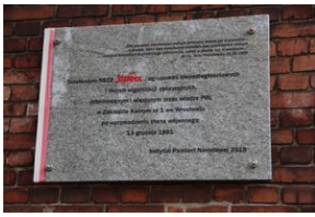
Wyprawa akademicka „Siadami Sonderaktion Krakau - in memoriam prof. Andrzeja Małeckiego” - więzienie przy ul. Świebodzkiej, Wrocław, 15 listopada 2019

Cedat Academia. Po złożeniu kwiatów pod tablicą upamiętniającą więźniów uczestnicy wyprawy zwiedzili budynek więzienia.