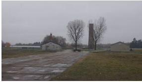
16 listopada 2019. Wyprowa akademicka z Krakowa dotaria do Sachsenhausen