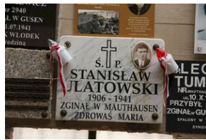
Wyprowa akademicka 2019. Mauthausen- Gusen