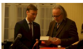
Wyprawa akademicka śladami Sonderaktion Krakau, Norymberga i Dachau