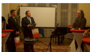
Wyprawa akademicka śladami Sonderaktion Krakau, Norymberga i Dachau