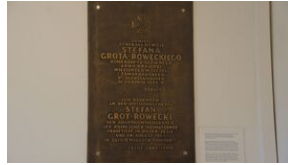
16 listopada 2019. Uczestnicy krakowskiej wyprowy akademickiej w Sachsenhausen