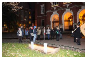
Wyprawa akademicka „Śladami Sonderaktion Krakau - in memoriam prof. Andrzeja Mańckiego” - Kraków, 14 listopada 2019