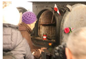
Wyprowa akademicka 2019. Mauthausen- Gusen