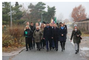
16 listopada 2019. Wyprawa akademicka z Krakowa dotarła do Sachsenhausen