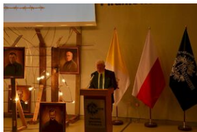
8 listopada 2019 w Krakowie odsłonięto tablicę pamięci jezuitów, aresztowanych przez Niemców