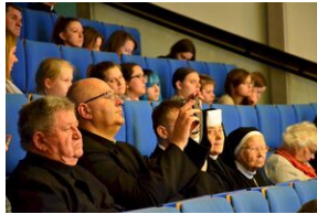
8 listopada 2019 w Krakowie odsłonięto tablicę pamięci jezuitów, aresztowanych przez Niemców