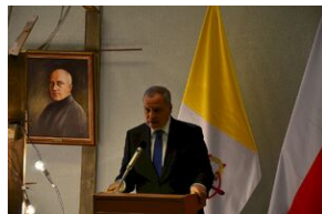
8 listopada 2019 w Krakowie odsłonięto tablicę pamięci jezuitów, aresztowanych przez Niemców