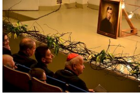
8 listopada 2019 w Krakowie odsłonięto tablicę pamięci jezuitów, aresztowanych przez Niemców