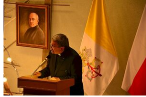
8 listopada 2019 w Krakowie odsłonięto tablicę pamięci jezuitów, aresztowanych przez Niemców