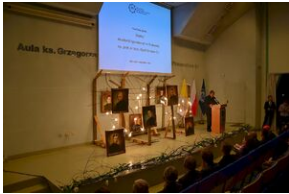
8 listopada 2019 w Krakowie odsłonięto tablicę pamięci jezuitów, aresztowanych przez Niemców