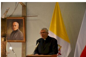
8 listopada 2019 w Krakowie odsłonięto tablicę pamięci jezuitów, aresztowanych przez Niemców