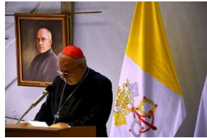
8 listopada 2019 w Krakowie odsłonięto tablicę pamięci jezuitów, aresztowanych przez Niemców