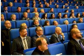
8 listopada 2019 w Krakowie odsłonięto tablicę pamięci jezuitów, aresztowanych przez Niemców