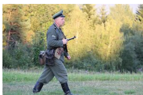
5-6 września 2019. VIII Marsz śladami gen. Nila - od zmierzchu do świtu