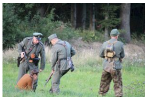
5-6 września 2019. VIII Marsz śladami gen. Nila - od zmierzchu do świtu