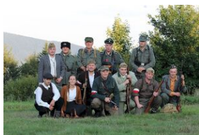
5-6 września 2019. VIII Marsz śladami gen. Nila - od zmierzchu do świtu