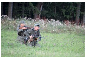
5-6 września 2019. VIII Marsz śladami gen. Nila - od zmierzchu do świtu