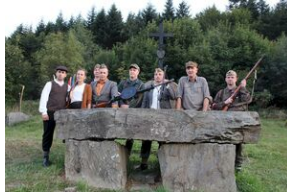
5-6 września 2019. VIII Marsz śladami gen. Nila - od zmierzchu do świtu