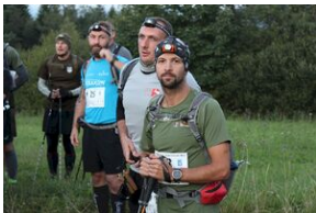
5-6 września 2019. VIII Marsz śladami gen. Nila - od zmierzchu do świtu