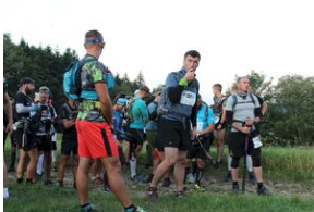
5-6 września 2019. VIII Marsz śladami gen. Nila - od zmierzchu do świtu