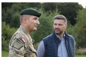
5-6 września 2019. VIII Marsz śladami gen. Nila - od zmierzchu do świtu