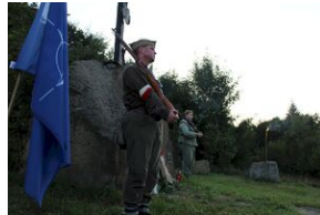
5-6 września 2019. VIII Marsz śladami gen. Nila - od zmierzchu do świtu