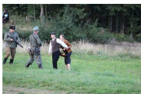
5-6 września 2019. VIII Marsz śladami gen. Nila - od zmierzchu do świtu