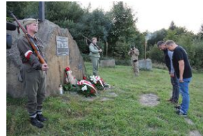
5-6 września 2019. VIII Marsz śladami gen. Nila - od zmierzchu do świtu