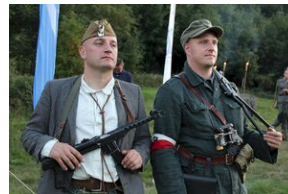
5-6 września 2019. VIII Marsz śladami gen. Nila - od zmierzchu do świtu