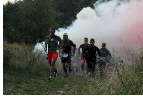
5-6 września 2019. VIII Marsz śladami gen. Nila - od zmierzchu do świtu