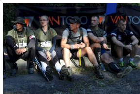
5-6 września 2019. VIII Marsz śladami gen. Nila - od zmierzchu do świtu