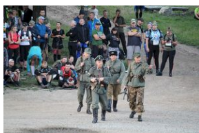
5-6 września 2019. VIII Marsz śladami gen. Nila - od zmierzchu do świtu