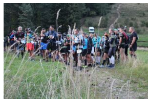
5-6 września 2019. VIII Marsz śladami gen. Nila - od zmierzchu do świtu