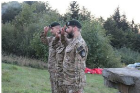
5-6 września 2019. VIII Marsz śladami gen. Nila - od zmierzchu do świtu