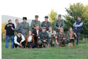
5-6 września 2019. VIII Marsz śladami gen. Nila - od zmierzchu do świtu