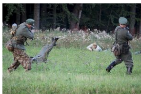
5-6 września 2019. VIII Marsz śladami gen. Nila - od zmierzchu do świtu