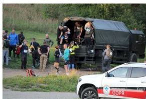
5-6 września 2019. VIII Marsz śladami gen. Nila - od zmierzchu do świtu