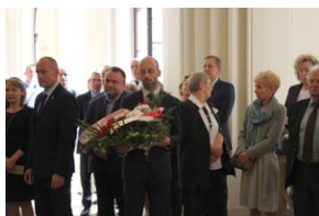
„Uniwersytet u progu niepodległości” – konferencja naukowa w Krakowie