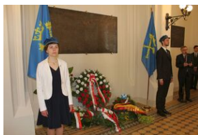
„Uniwersytet u progu niepodległości” – konferencja naukowa w Krakowie