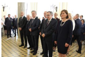
„Uniwersytet u progu niepodległości” -