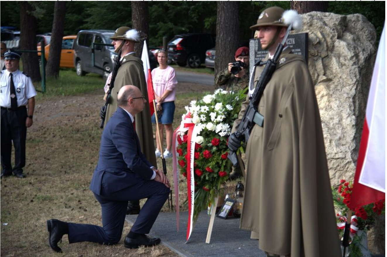
Złożenie kwiatów pod pomnikiem w Kolbarku, upamiętniającym żołnierzy 2 Korpusu Polskiego.