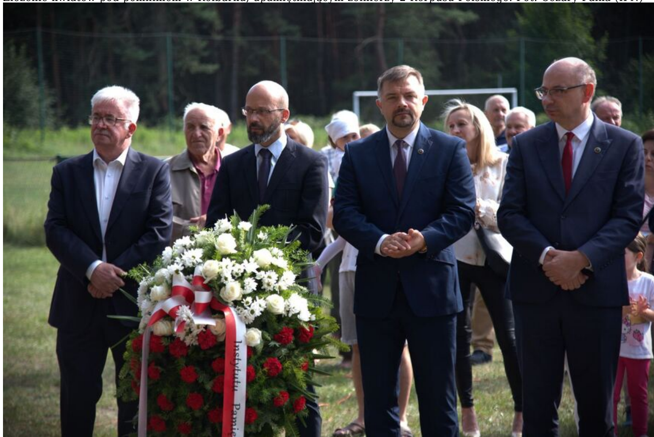
Złożenie kwiatów pod pomnikiem w Kolbarku, upamiętniającym żołnierzy 2 Korpusu Polskiego.