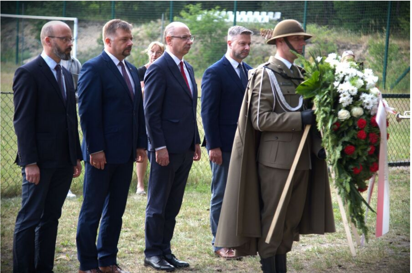
Złożenie kwiatów pod pomnikiem w Kolbarku, upamiętniającym żołnierzy 2 Korpusu Polskiego.