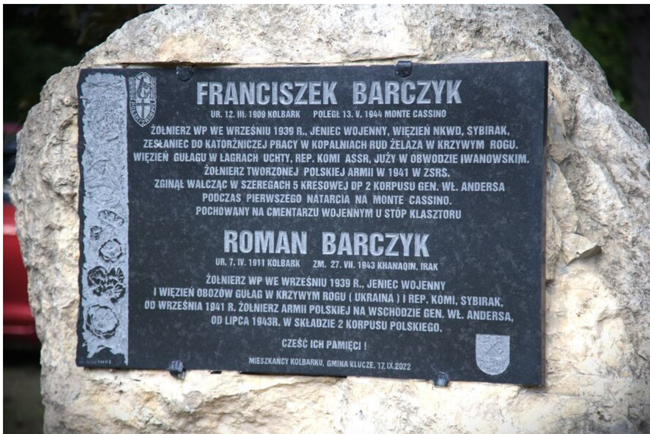
Złożenie kwiatów pod pomnikiem w Kolbarku, upamiętniającym żołnierzy 2 Korpusu Polskiego.

w 1941 r., w których brali udział żołnierze Samodzielnej Brygady Strzelców Karpackich, a także z operacji „Crusader”, czyli uwolnienia Torbruku od oblężenia państw Osi.