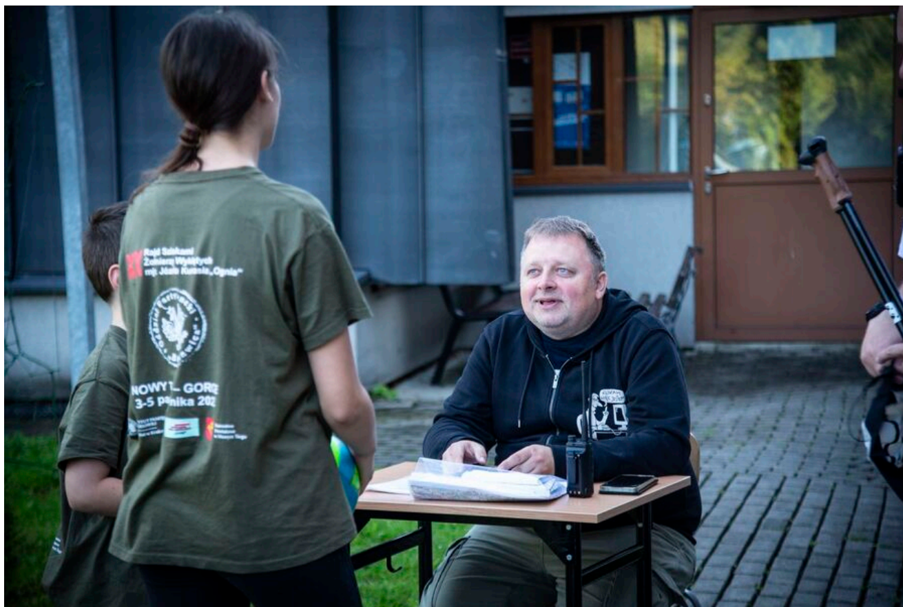
Zakończenie XVI Rajdu Szlakami Żołnierzy 1PSP AK.