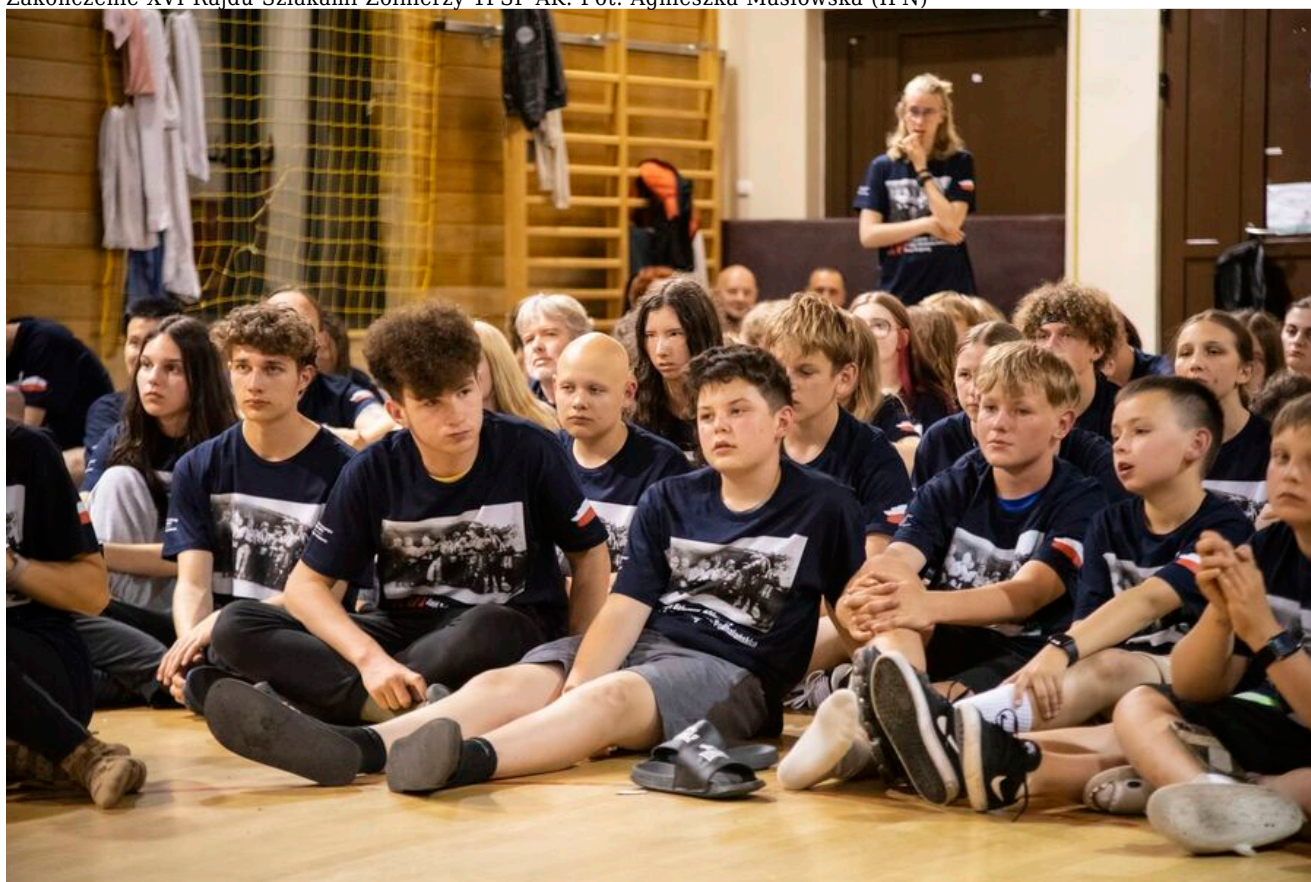
Zakończenie XVI Rajdu Szlakami Żołnierzy 1PSP AK.