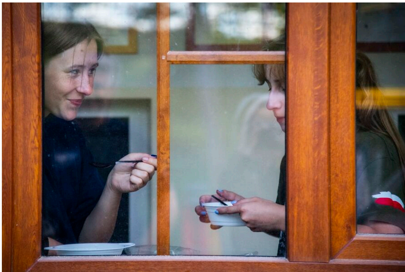
Zakończenie XVI Rajdu Szlakami Żołnierzy 1PSP AK.