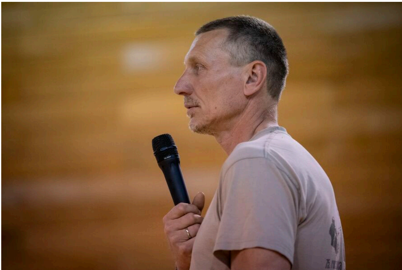
Zakończenie XVI Rajdu Szlakami Żołnierzy 1PSP AK.