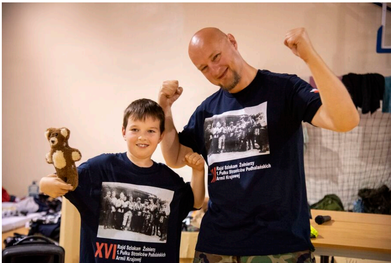
Zakończenie XVI Rajdu Szlakami Żołnierzy 1PSP AK.