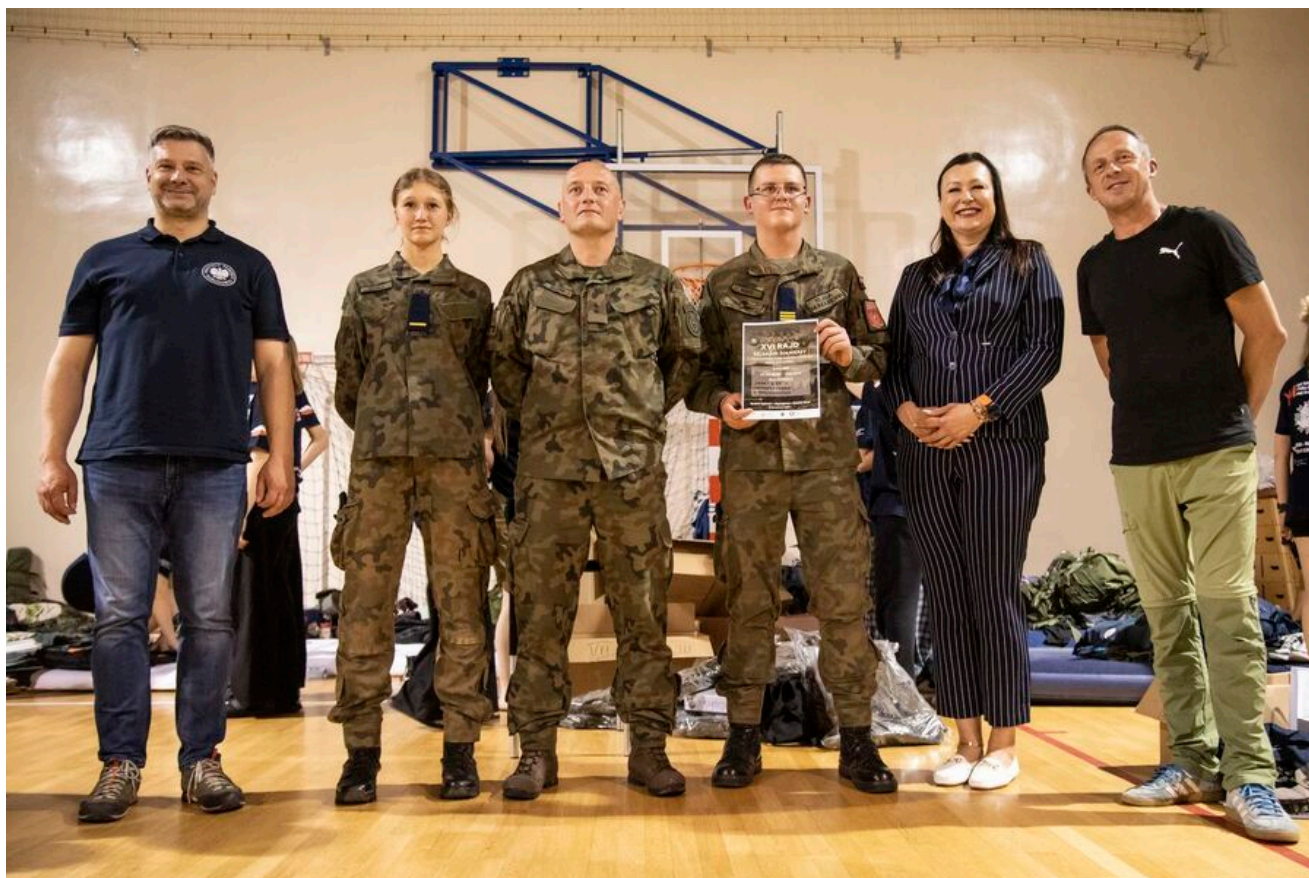
Zakończenie XVI Rajdu Szlakami Żołnierzy 1PSP AK.

Blisko 200 uczestników od 12 do 14 czerwca 2026 r. przeszło szlakami podhalańczyków - ponad 40 km po Beskidzie Sądeckim i Niskim - na terenie gminy Łabowa.