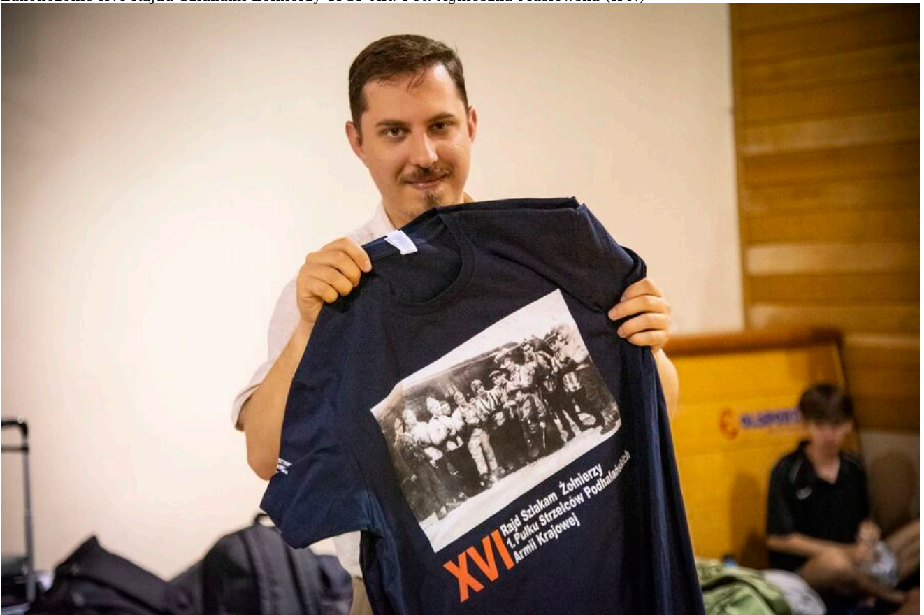
Zakończenie XVI Rajdu Szlakami Żołnierzy 1PSP AK.