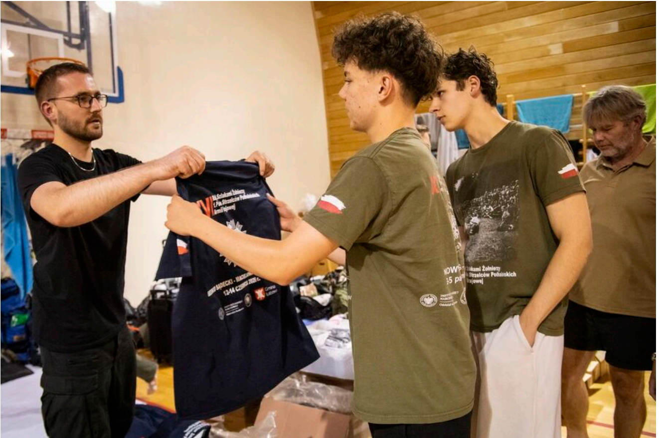
Zakończenie XVI Rajdu Szlakami Żołnierzy 1PSP AK.