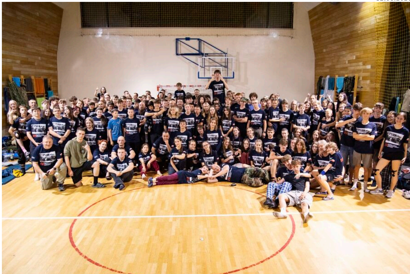
Zakończenie XVI Rajdu Szlakami Żołnierzy 1PSP AK.