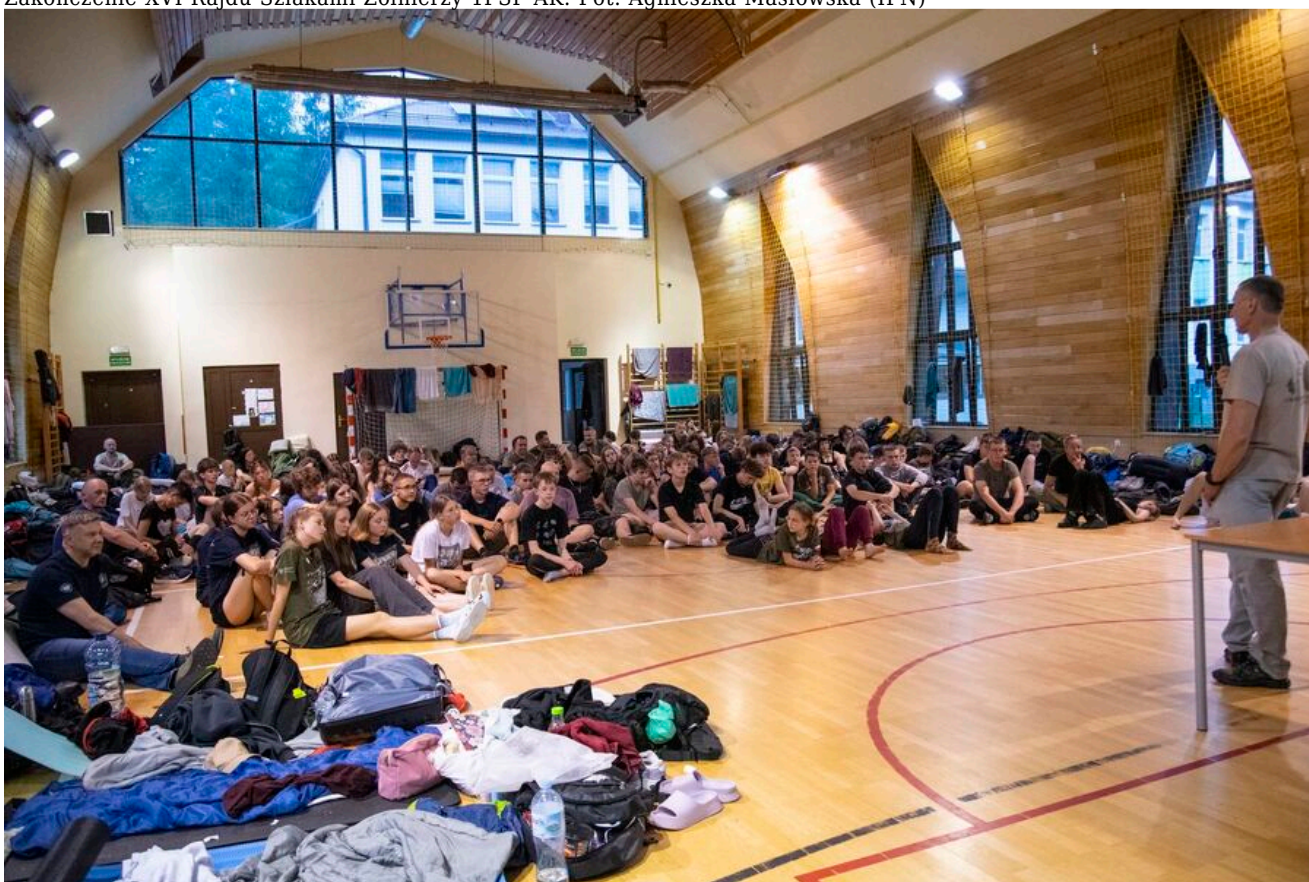
Zakończenie XVI Rajdu Szlakami Żołnierzy 1PSP AK.