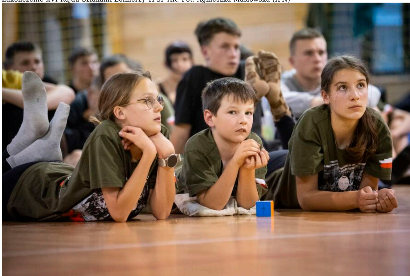
Zakończenie XVI Rajdu Szlakami Żołnierzy 1PSP AK.