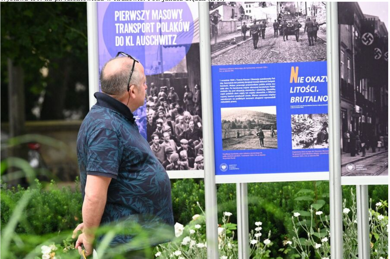
Wystawa IPN na pl. Axentowicza w Krakowie.