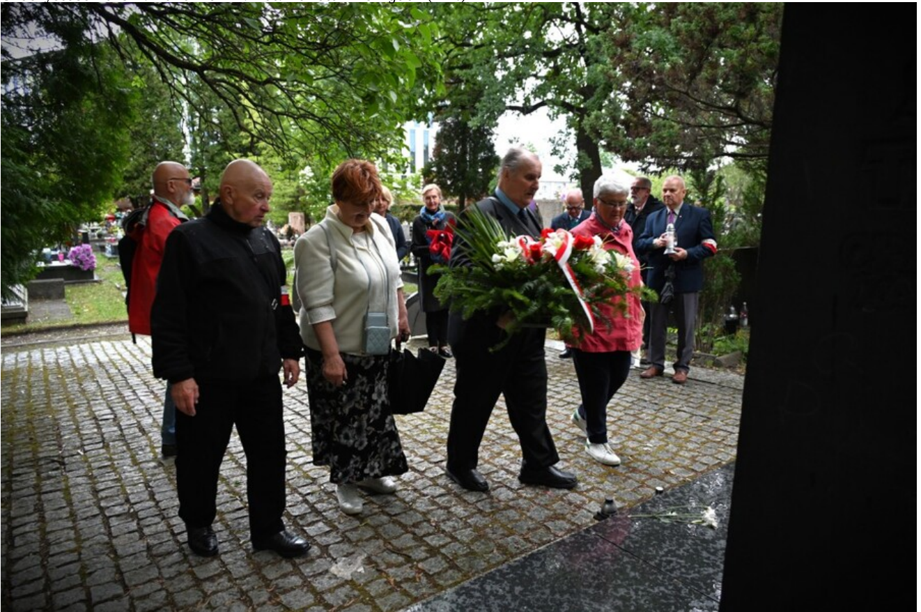
Uroczystość na Cm. Rakowickim.