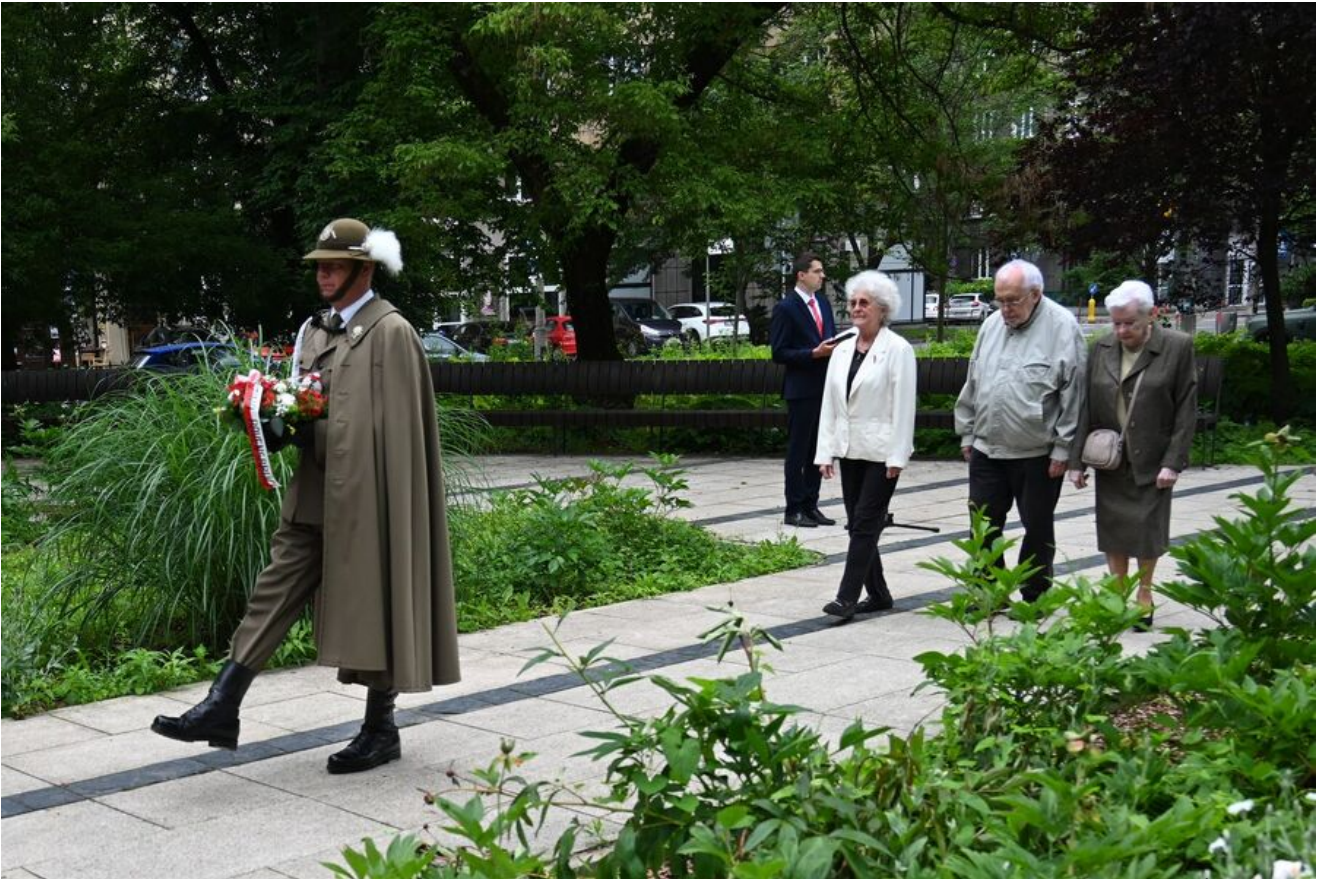
Kraków. Uroczystości w 86. rocznicę pierwszego masowego transportu więźniów do KL Auschwitz.