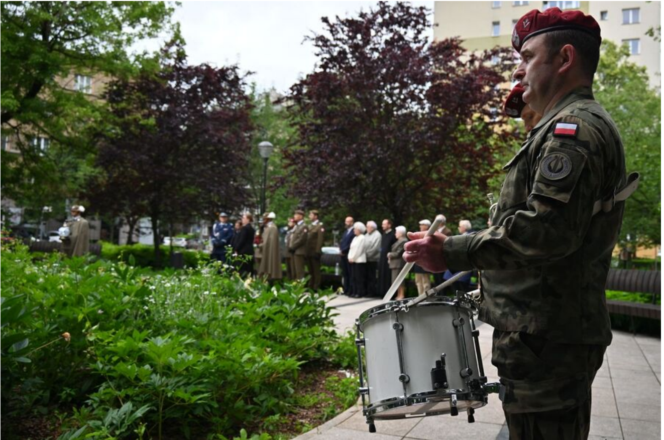
Kraków. Uroczystości w 86. rocznicę pierwszego masowego transportu więźniów do KL Auschwitz.