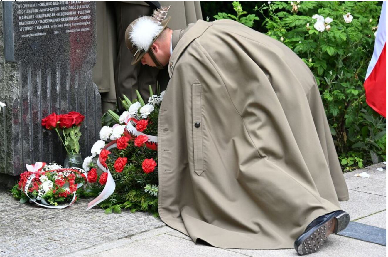
Kraków. Uroczystości w 86. rocznicę pierwszego masowego transportu więźniów do KL Auschwitz.