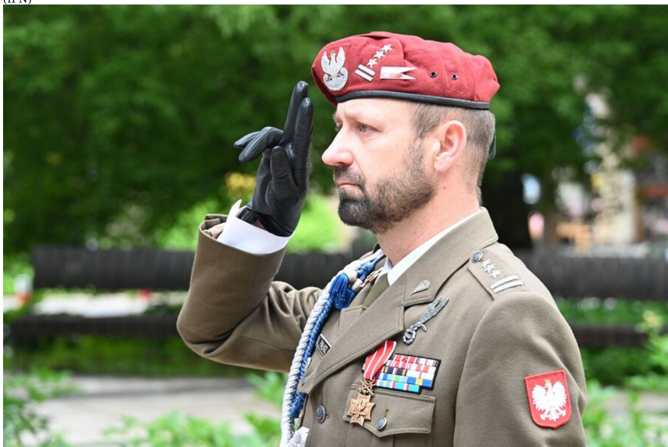
Kraków. Uroczystości w 86. rocznicę pierwszego masowego transportu więźniów do KL Auschwitz.