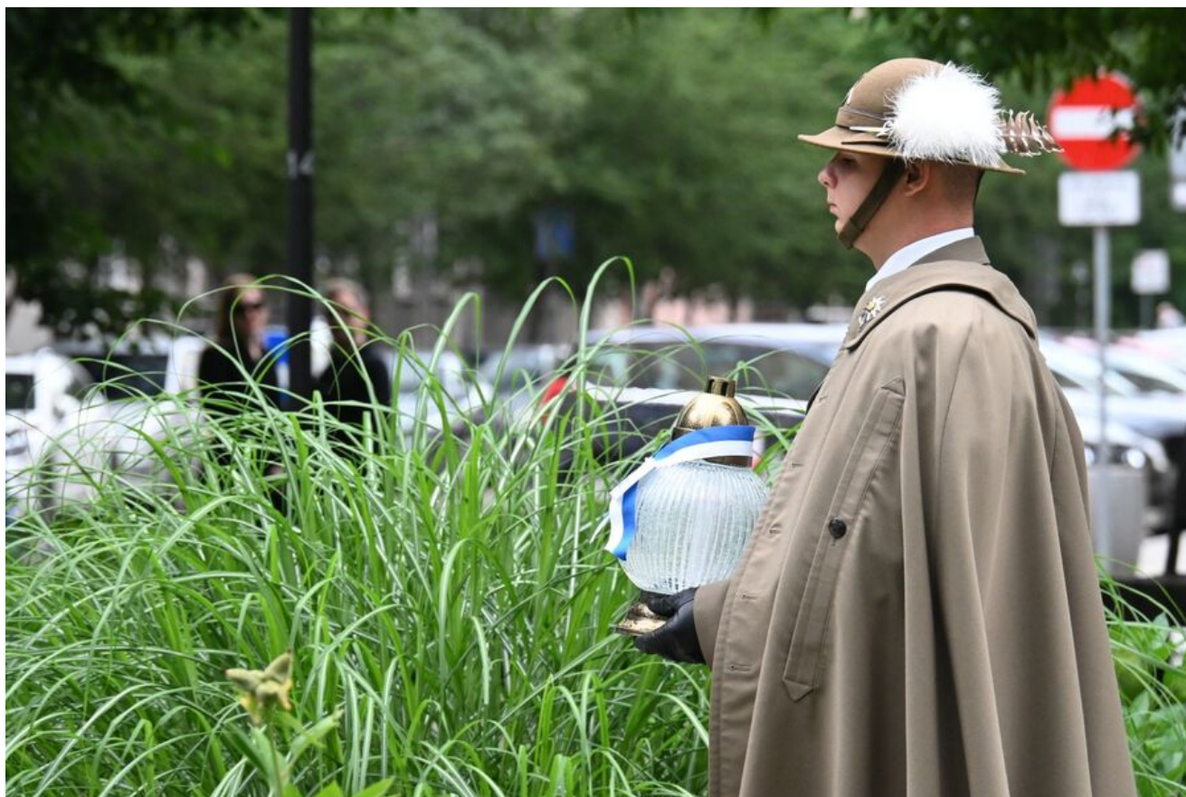
Kraków. Uroczystości w 86. rocznicę pierwszego masowego transportu więźniów do KL Auschwitz.