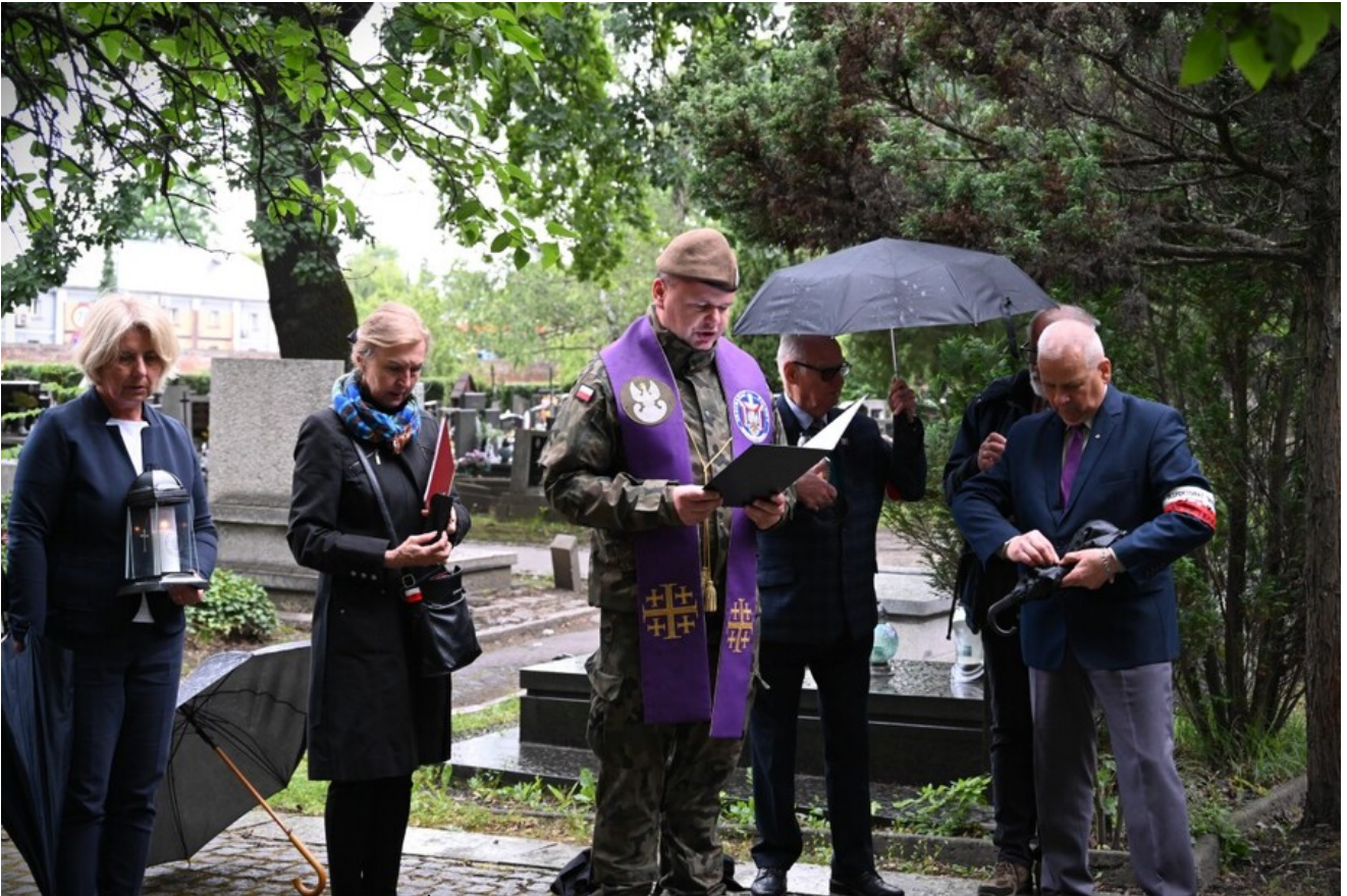
Uroczystość na Cm. Rakowickim.