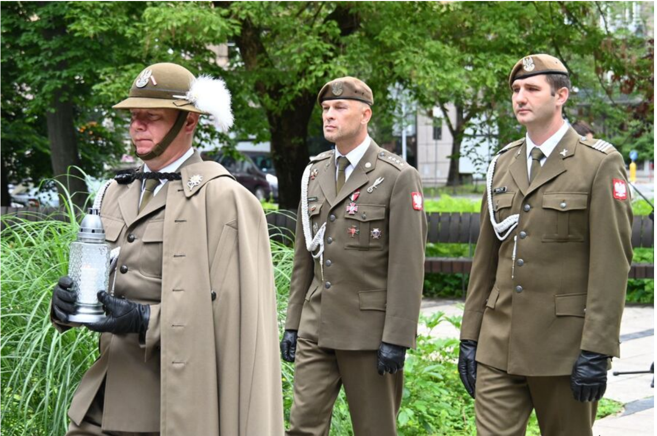
Kraków. Uroczystości w 86. rocznicę pierwszego masowego transportu więźniów do KL Auschwitz.