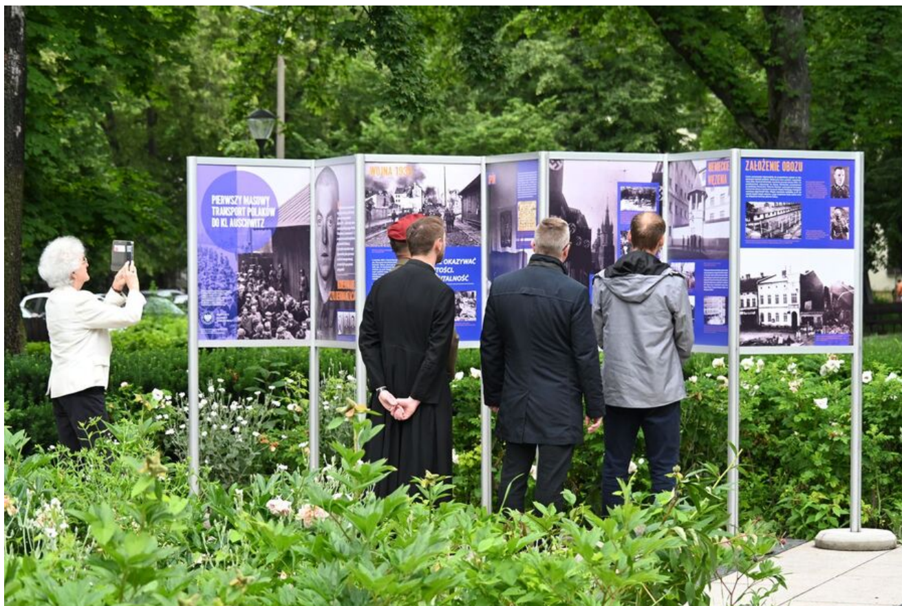
Wystawa IPN na pl. Axentowicza w Krakowie.