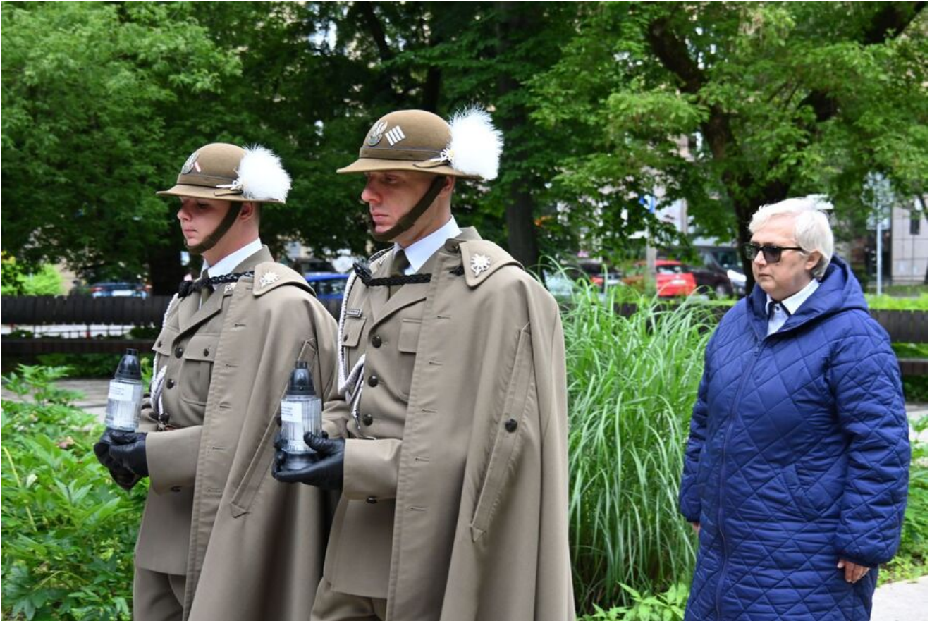
Kraków. Uroczystości w 86. rocznicę pierwszego masowego transportu więźniów do KL Auschwitz.