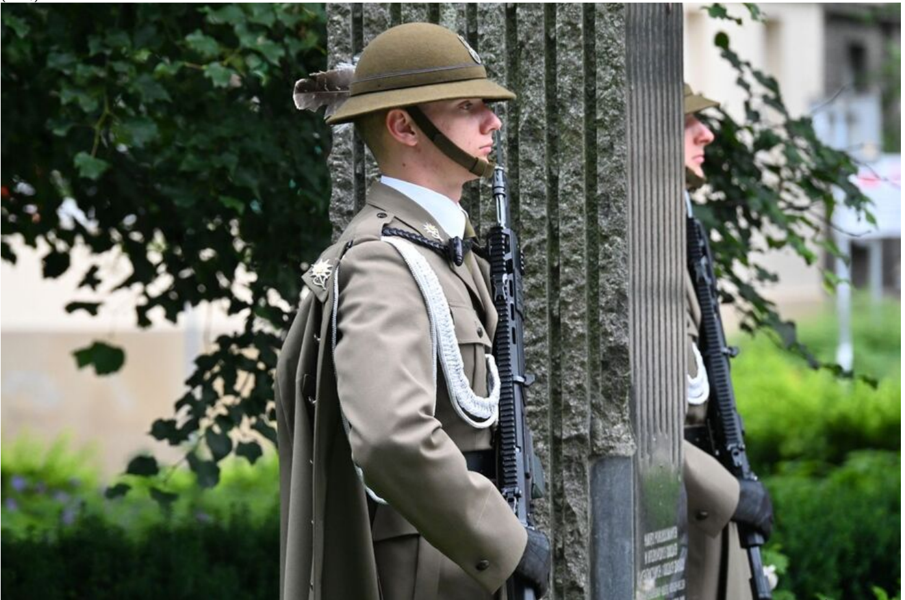
Kraków. Uroczystości w 86. rocznicę pierwszego masowego transportu więźniów do KL Auschwitz.