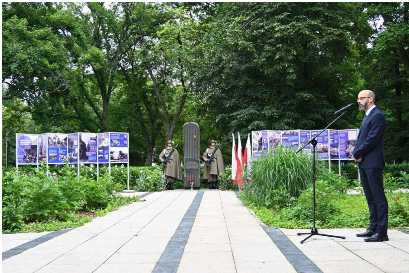
Kraków. Uroczystości w 86. rocznicę pierwszego masowego transportu więźniów do KL Auschwitz.