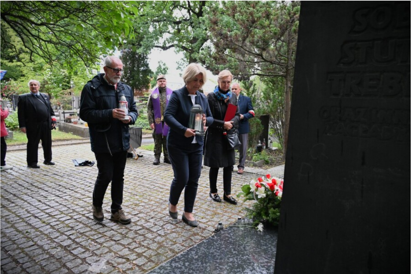
Uroczystość na Cm. Rakowickim.