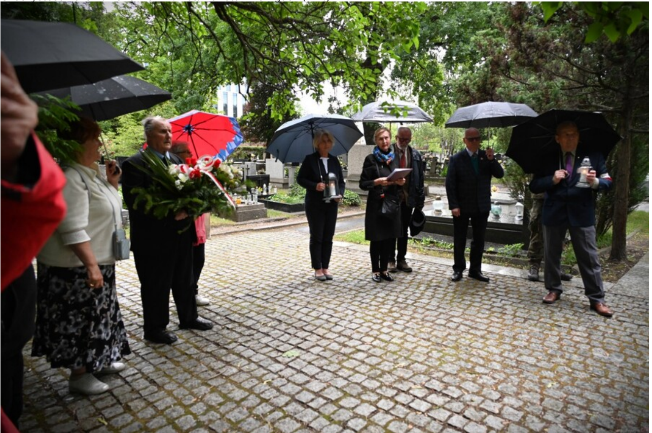
Uroczystość na Cm. Rakowickim.