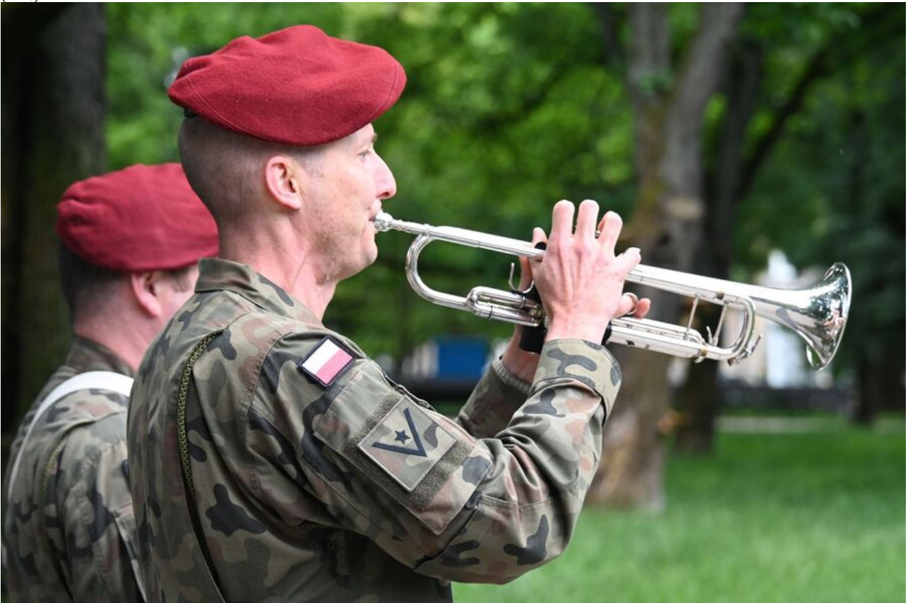
Kraków. Uroczystości w 86. rocznicę pierwszego masowego transportu więźniów do KL Auschwitz.