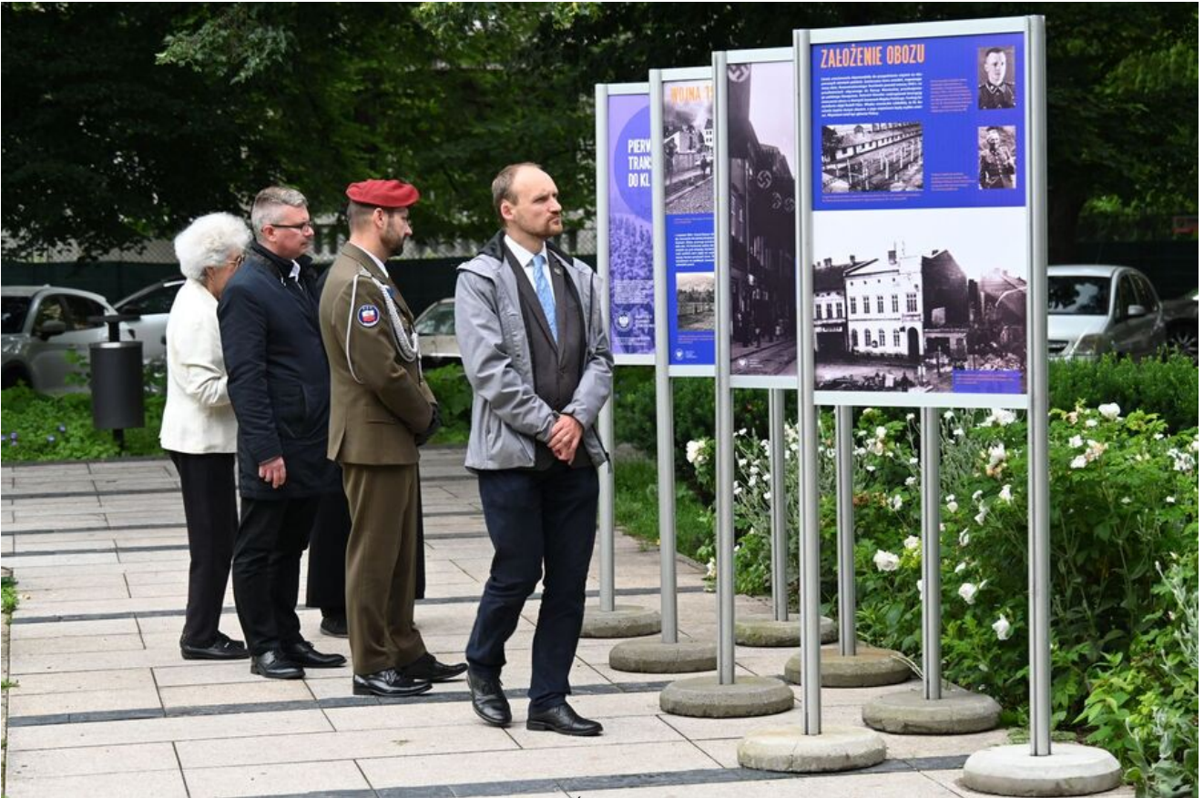
Wystawa IPN na pl. Axentowicza w Krakowie.