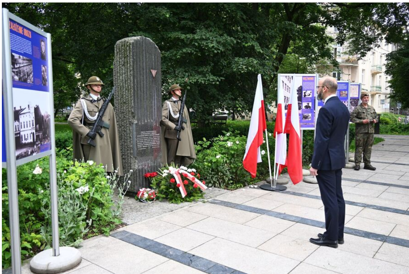
Kraków. Uroczystości w 86. rocznicę pierwszego masowego transportu więźniów do KL Auschwitz.