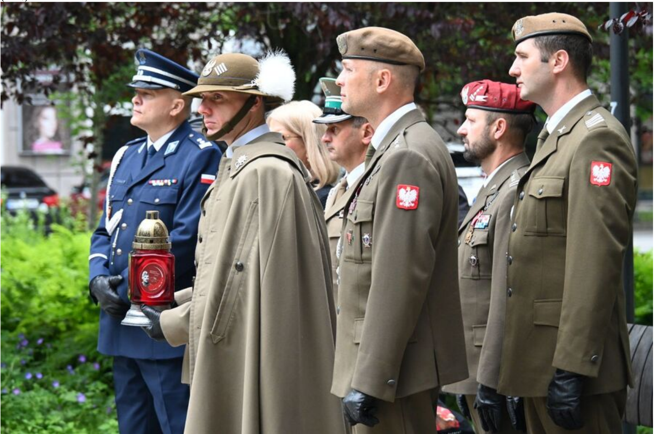
Kraków. Uroczystości w 86. rocznicę pierwszego masowego transportu więźniów do KL Auschwitz.