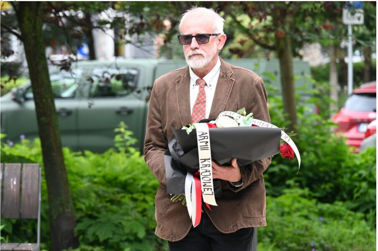
Kraków. Uroczystości w 86. rocznicę pierwszego masowego transportu więźniów do KL Auschwitz.