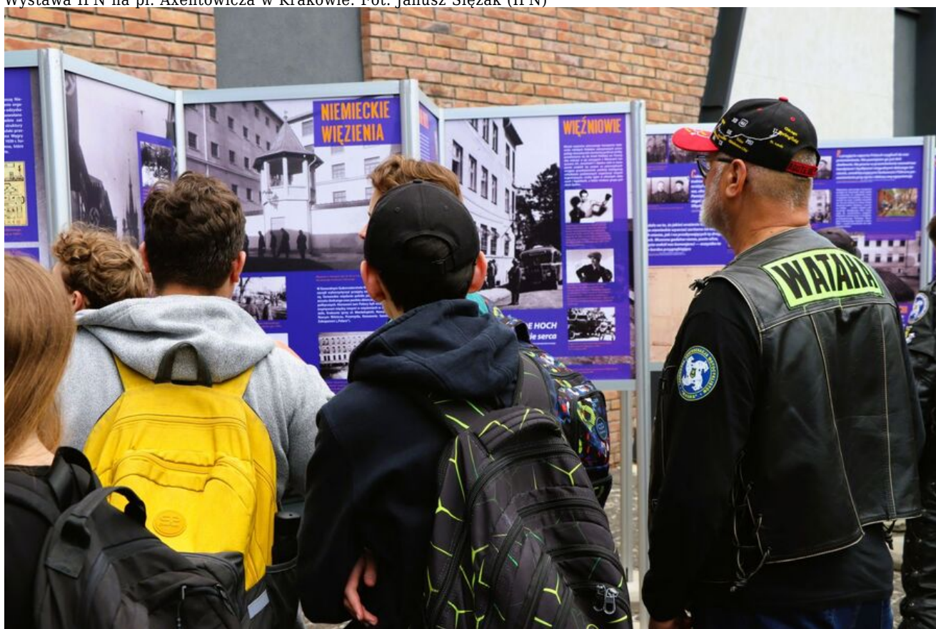
Wystawa IPN w Tarnobrzegu.