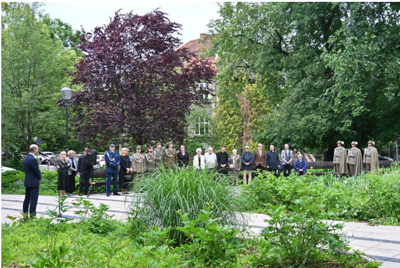
Kraków. Uroczystości w 86. rocznicę pierwszego masowego transportu więźniów do KL Auschwitz.