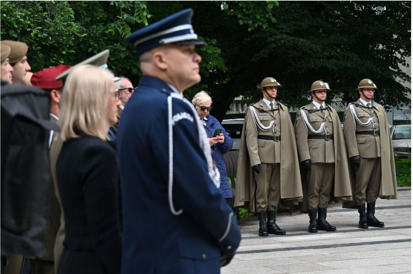
Kraków. Uroczystości w 86. rocznicę pierwszego masowego transportu więźniów do KL Auschwitz.