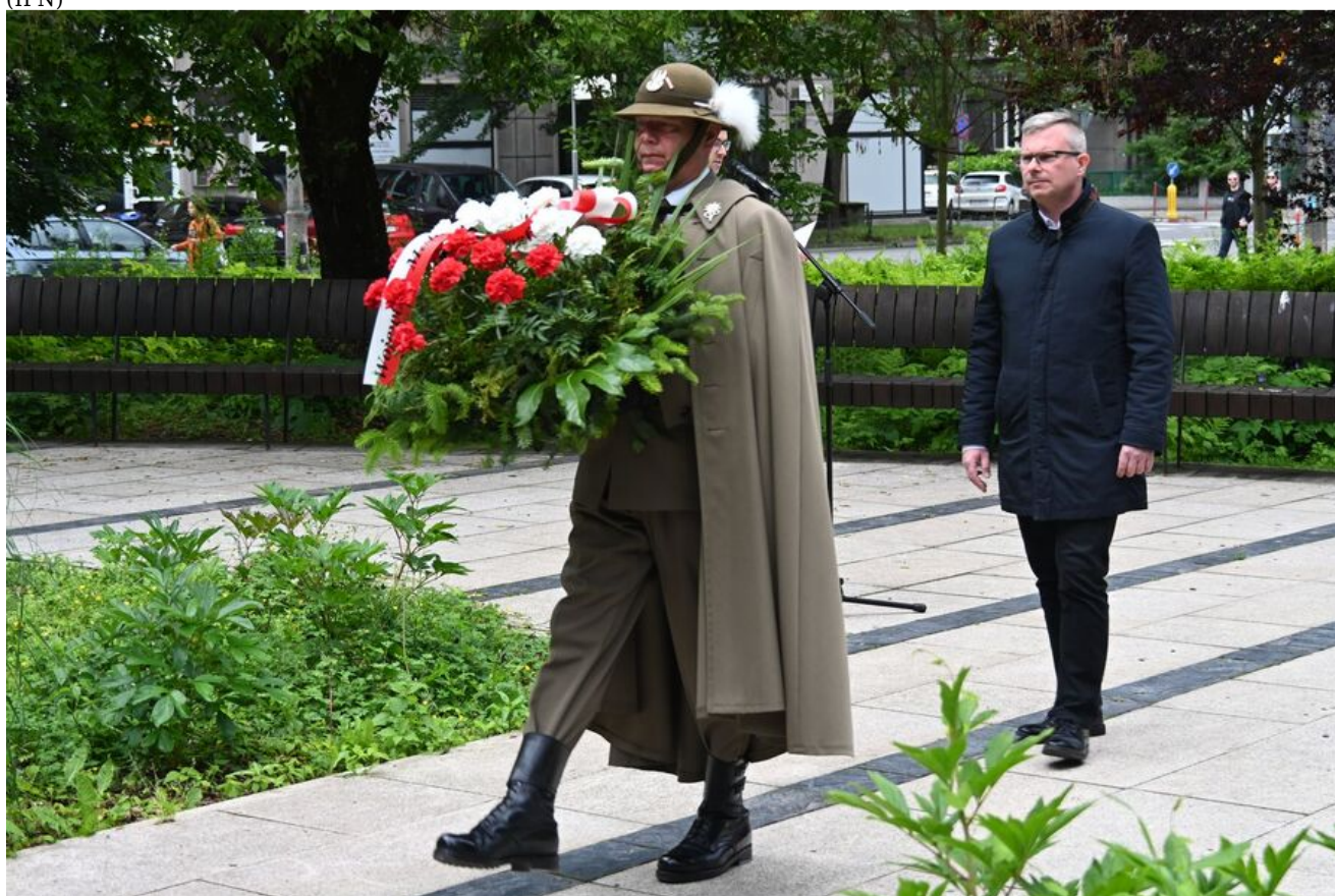
Kraków. Uroczystości w 86. rocznicę pierwszego masowego transportu więźniów do KL Auschwitz.