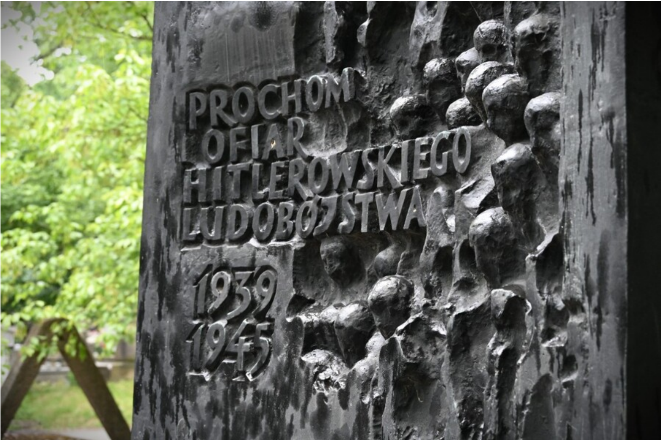
Uroczystość na Cm. Rakowickim.