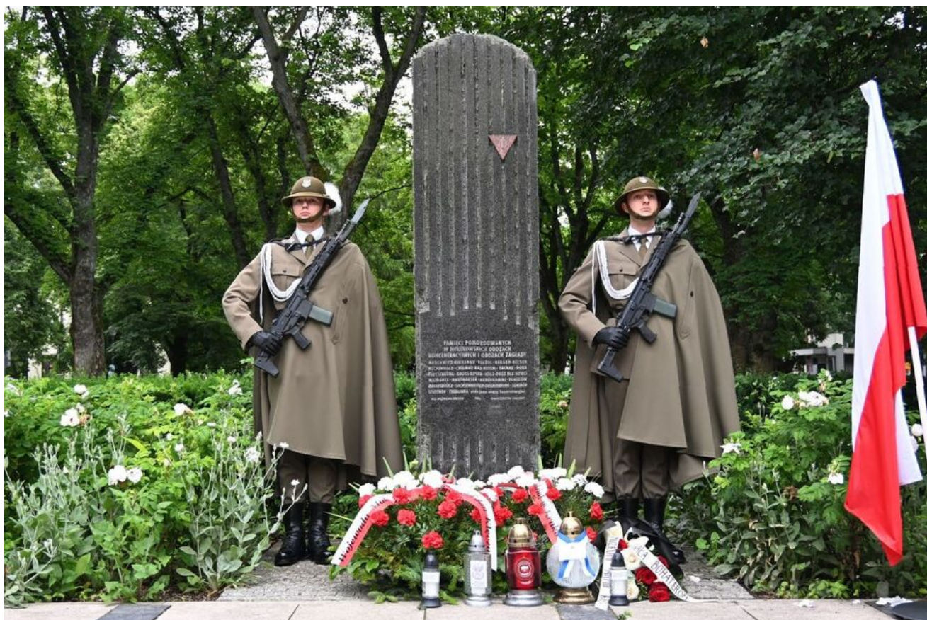
Kraków. Uroczystości w 86. rocznicę pierwszego masowego transportu więźniów do KL Auschwitz.