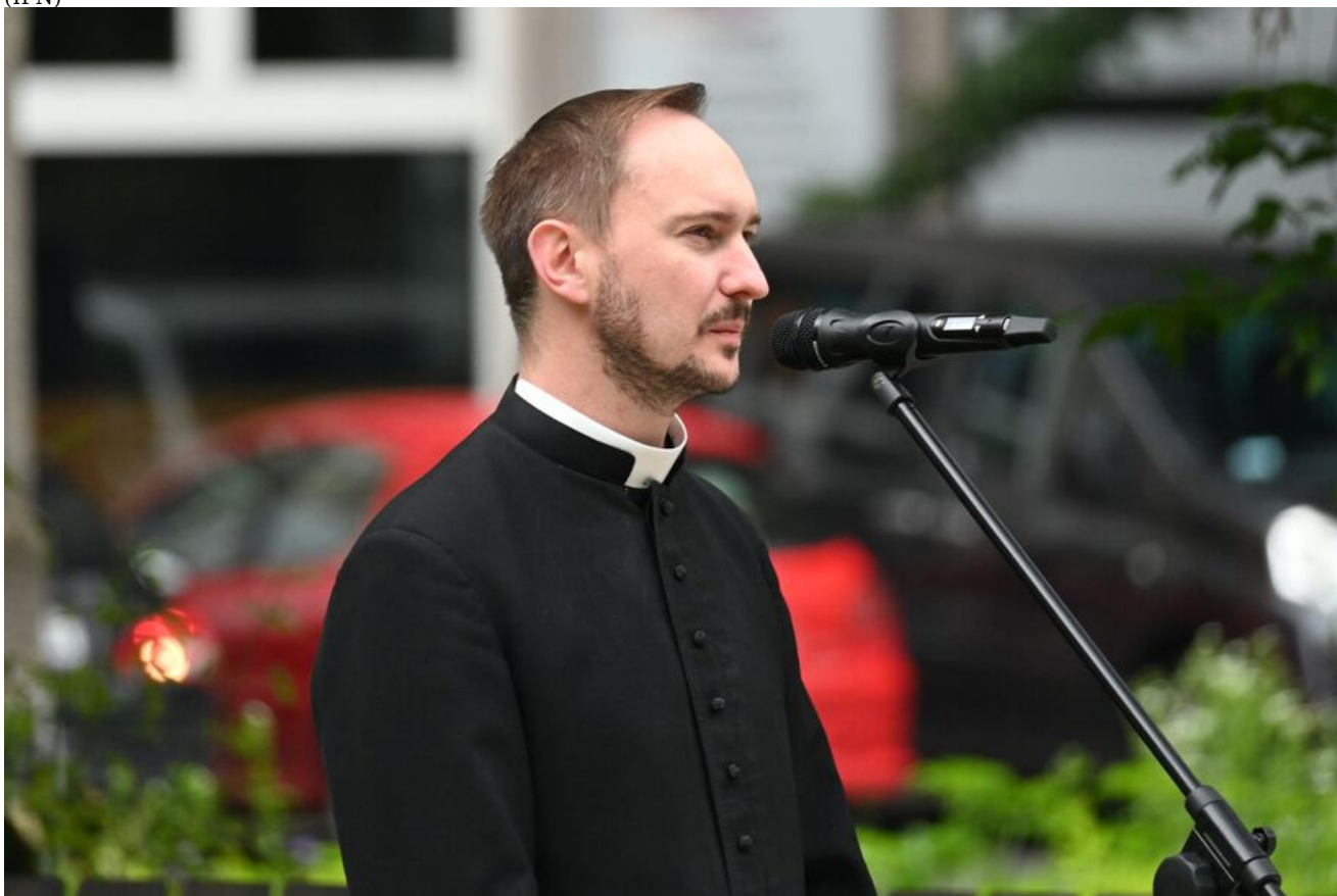
Kraków. Uroczystości w 86. rocznicę pierwszego masowego transportu więźniów do KL Auschwitz.