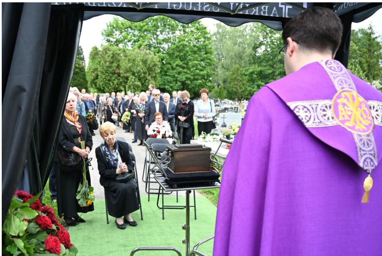
W Krakowie pochowano prof. Michała Pułaskiego.