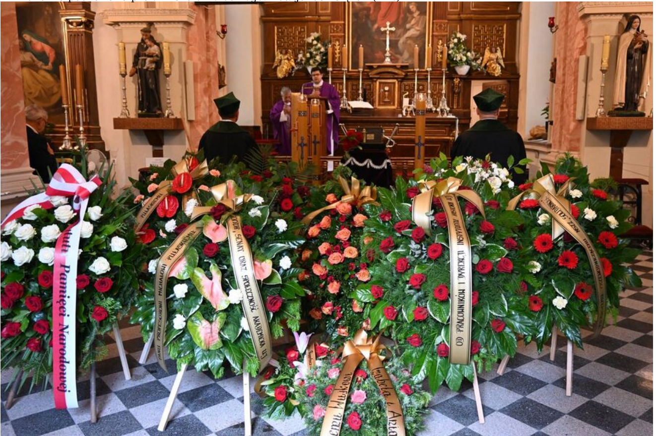
W Krakowie pochowano prof. Michała Pułaskiego.