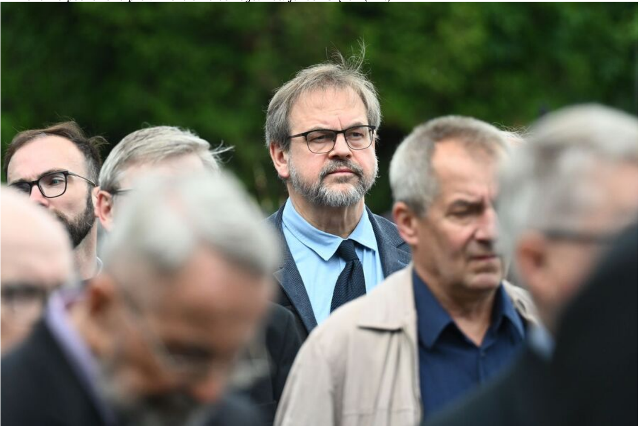
W Krakowie pochowano prof. Michała Pułaskiego.