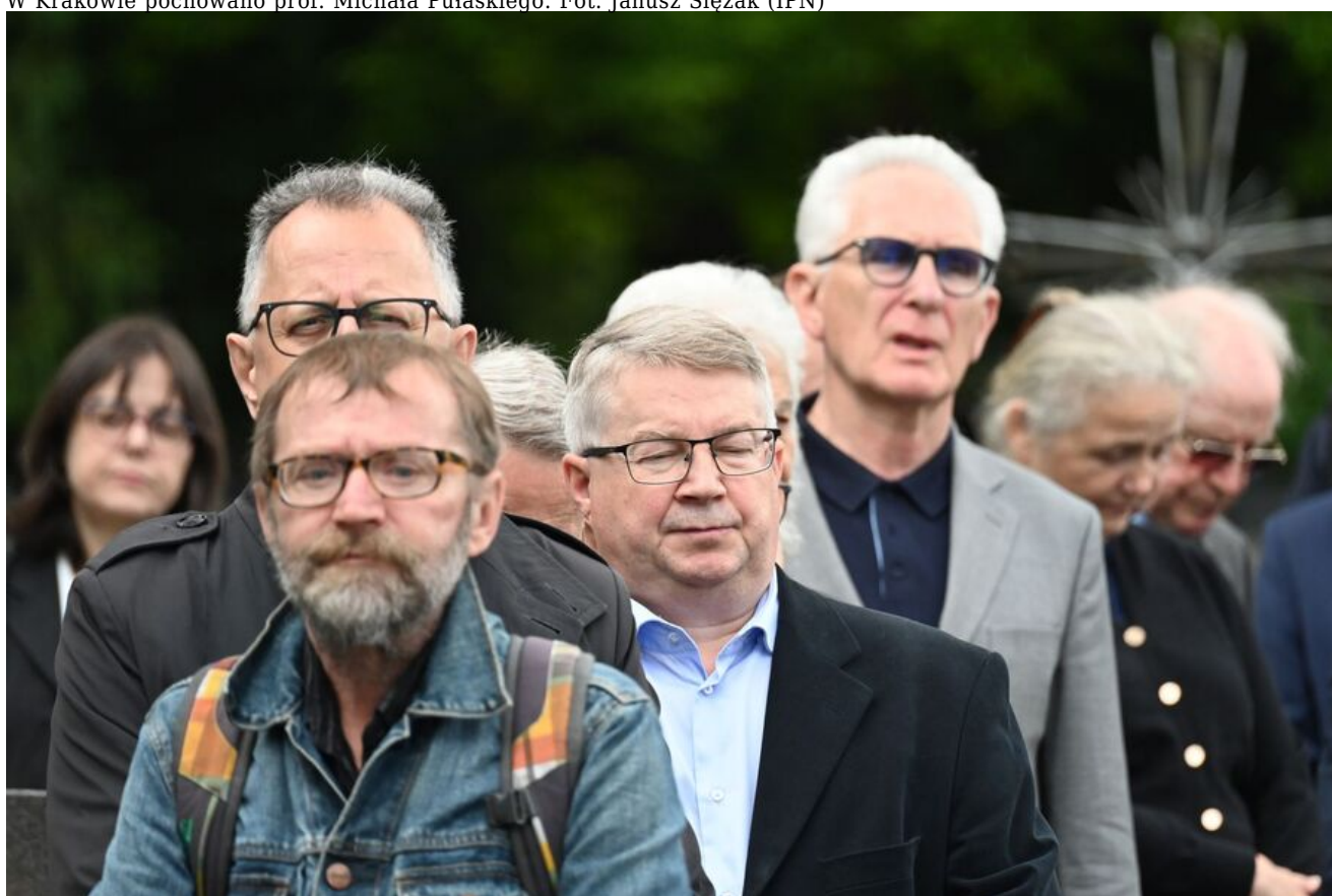
W Krakowie pochowano prof. Michała Pułaskiego.