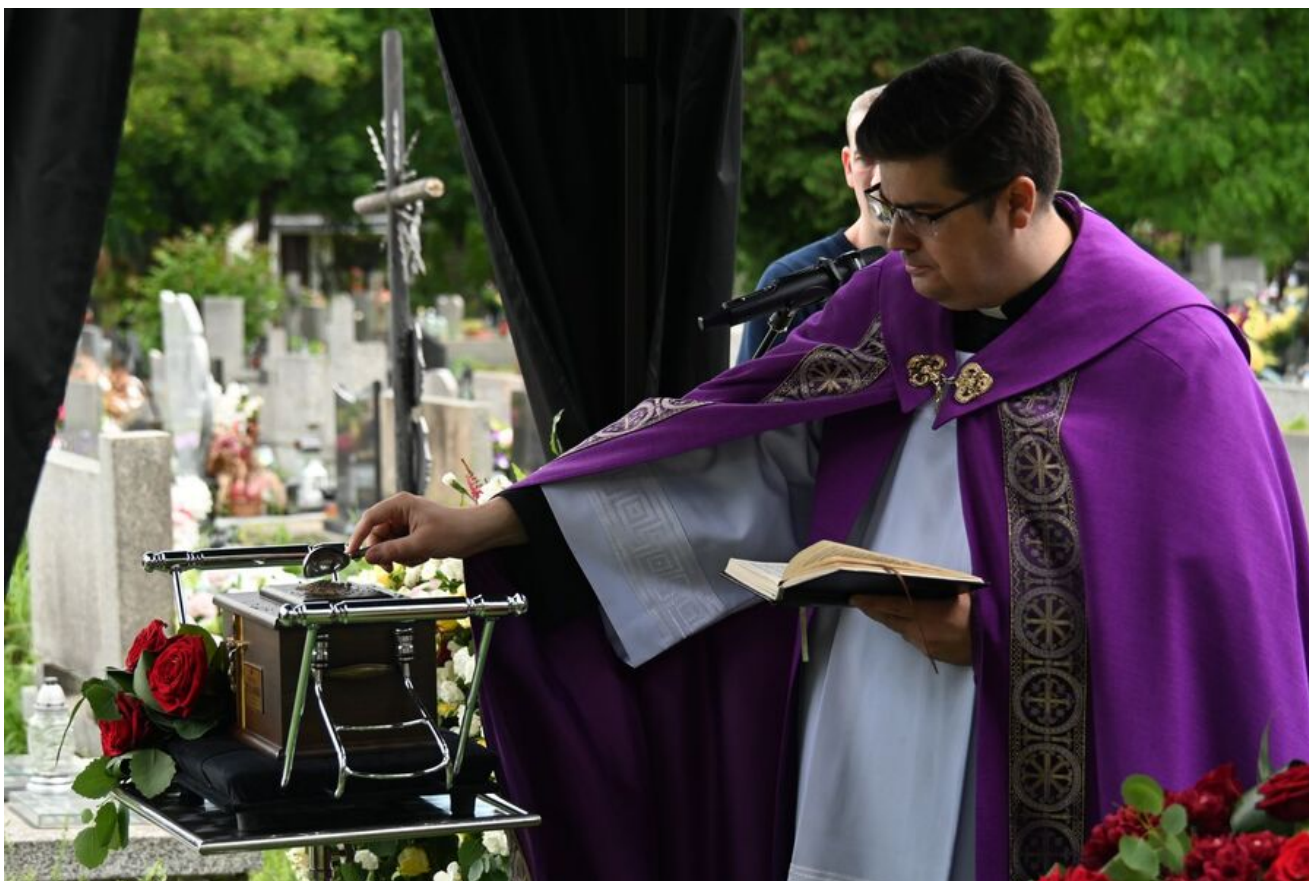
W Krakowie pochowano prof. Michała Pułaskiego.