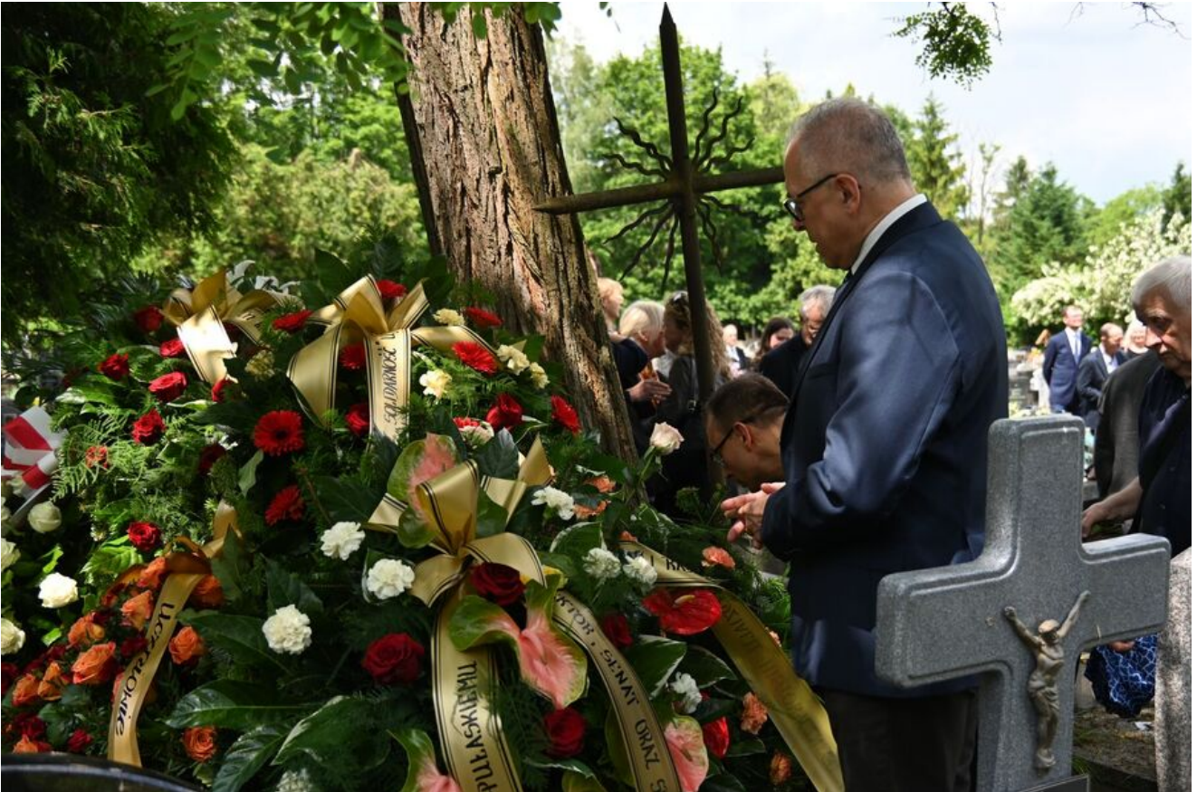
W Krakowie pochowano prof. Michała Pułaskiego.