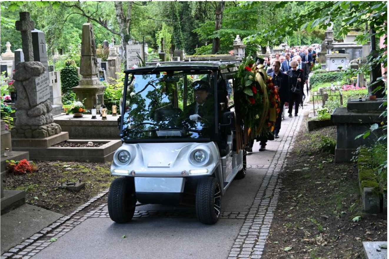
W Krakowie pochowano prof. Michała Pułaskiego.