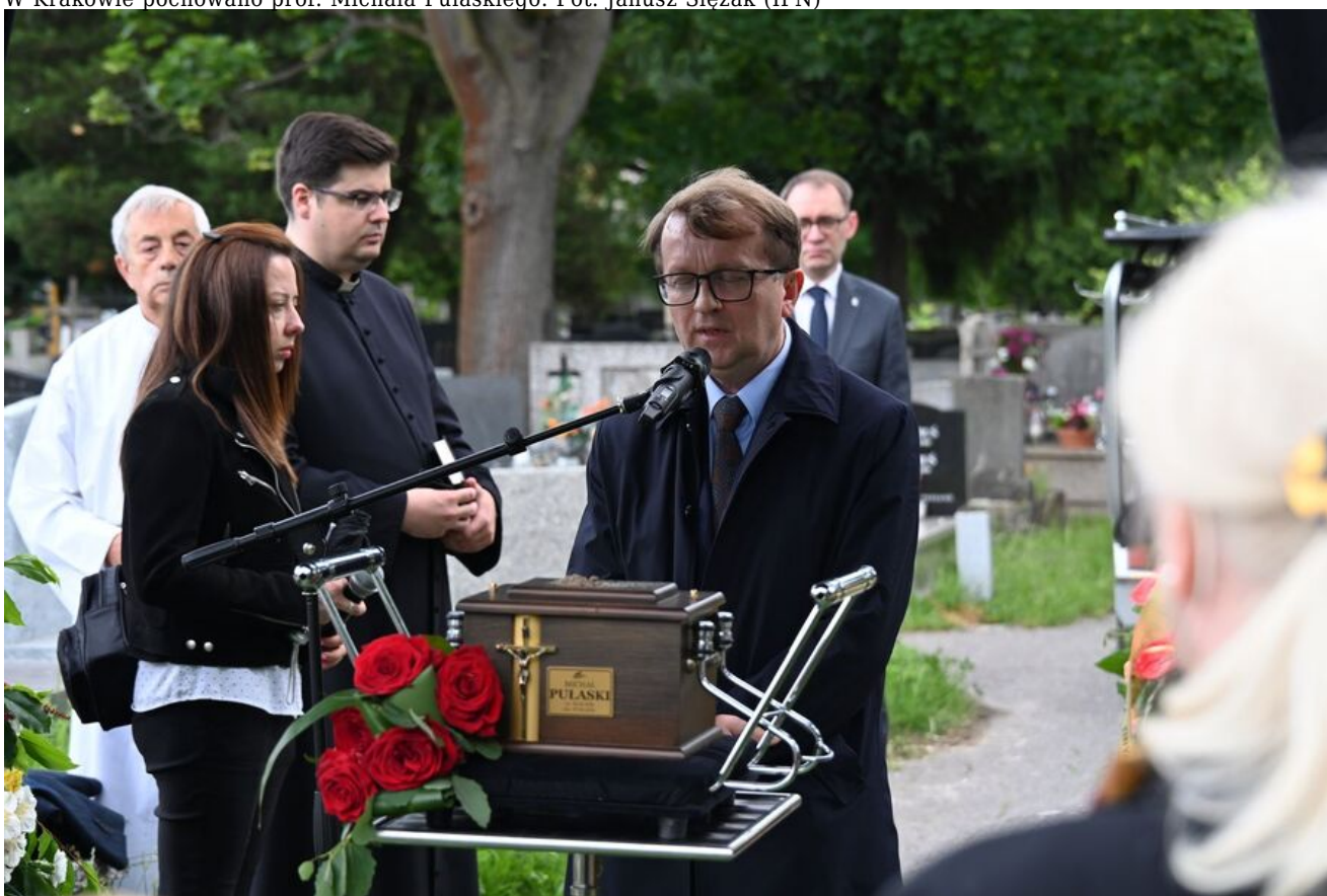
W Krakowie pochowano prof. Michała Pułaskiego.