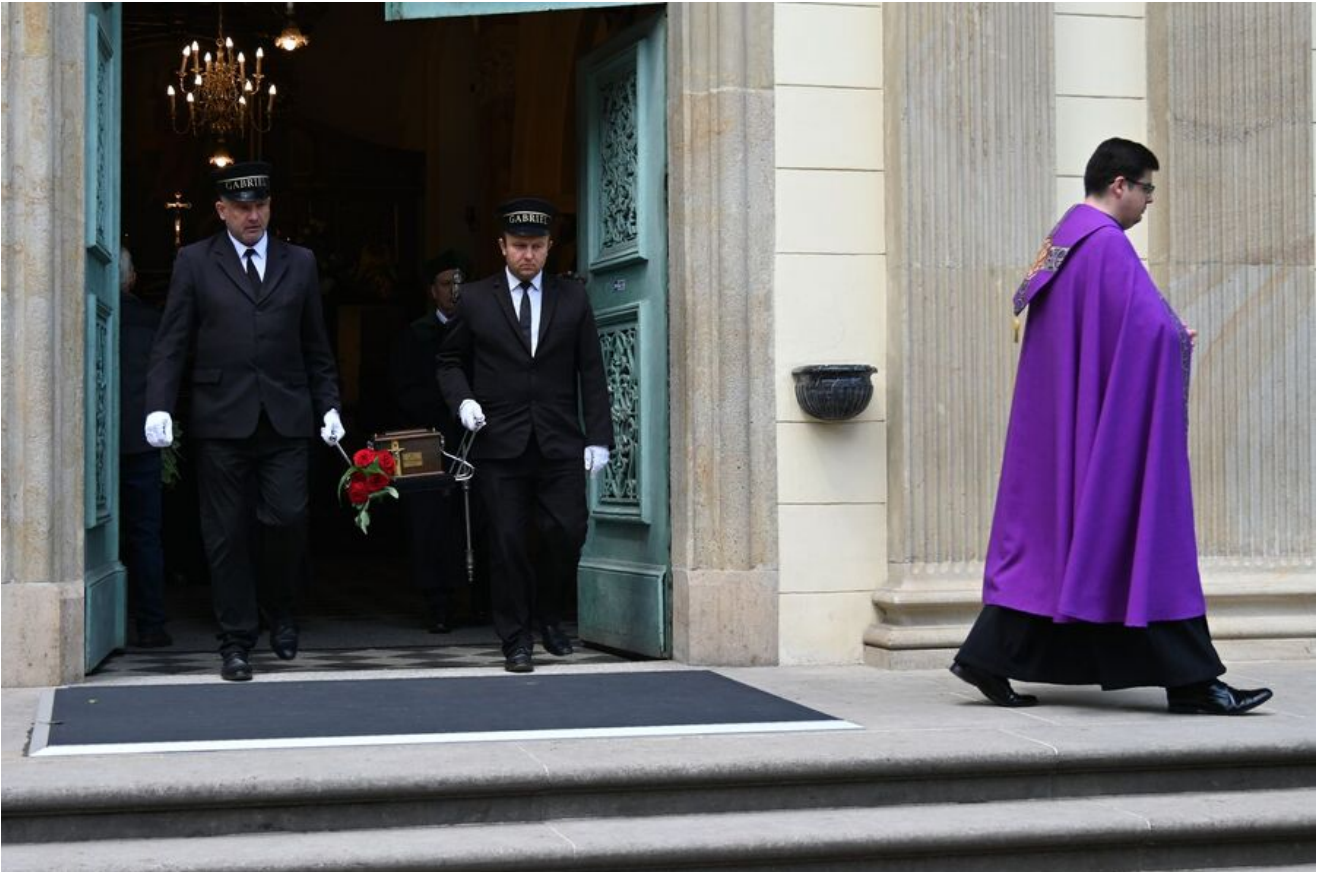
W Krakowie pochowano prof. Michała Pułaskiego.