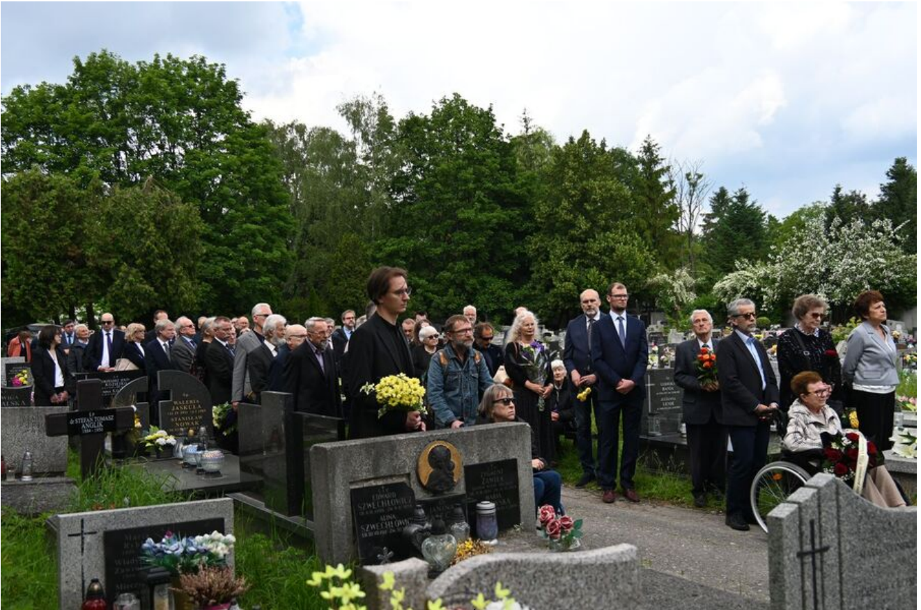
W Krakowie pochowano prof. Michała Pułaskiego.