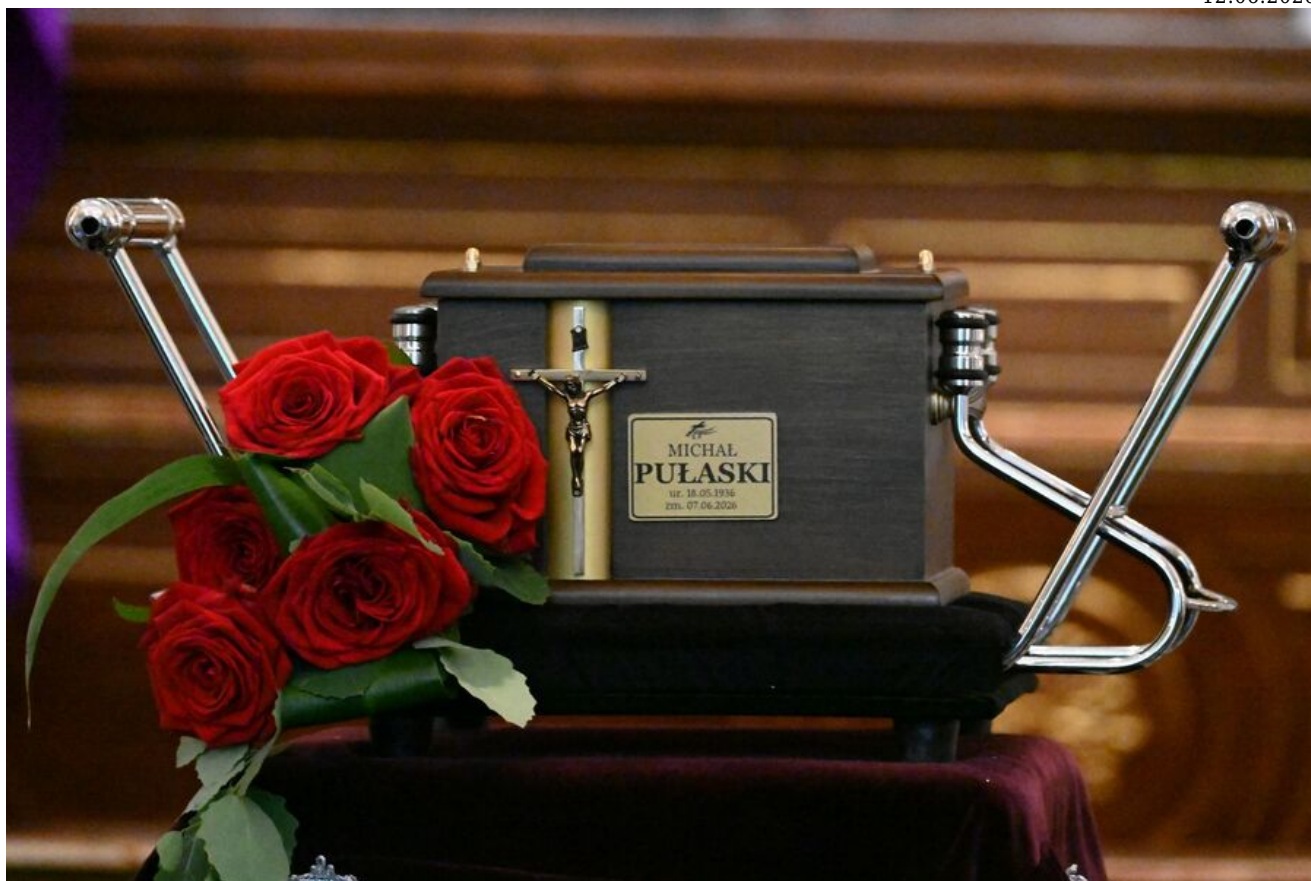
W Krakowie pochowano prof. Michała Pułaskiego.