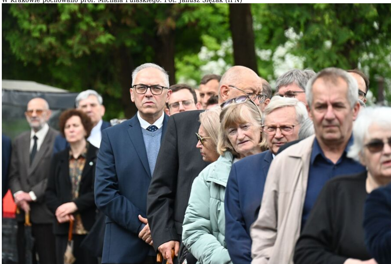
W Krakowie pochowano prof. Michała Pułaskiego.