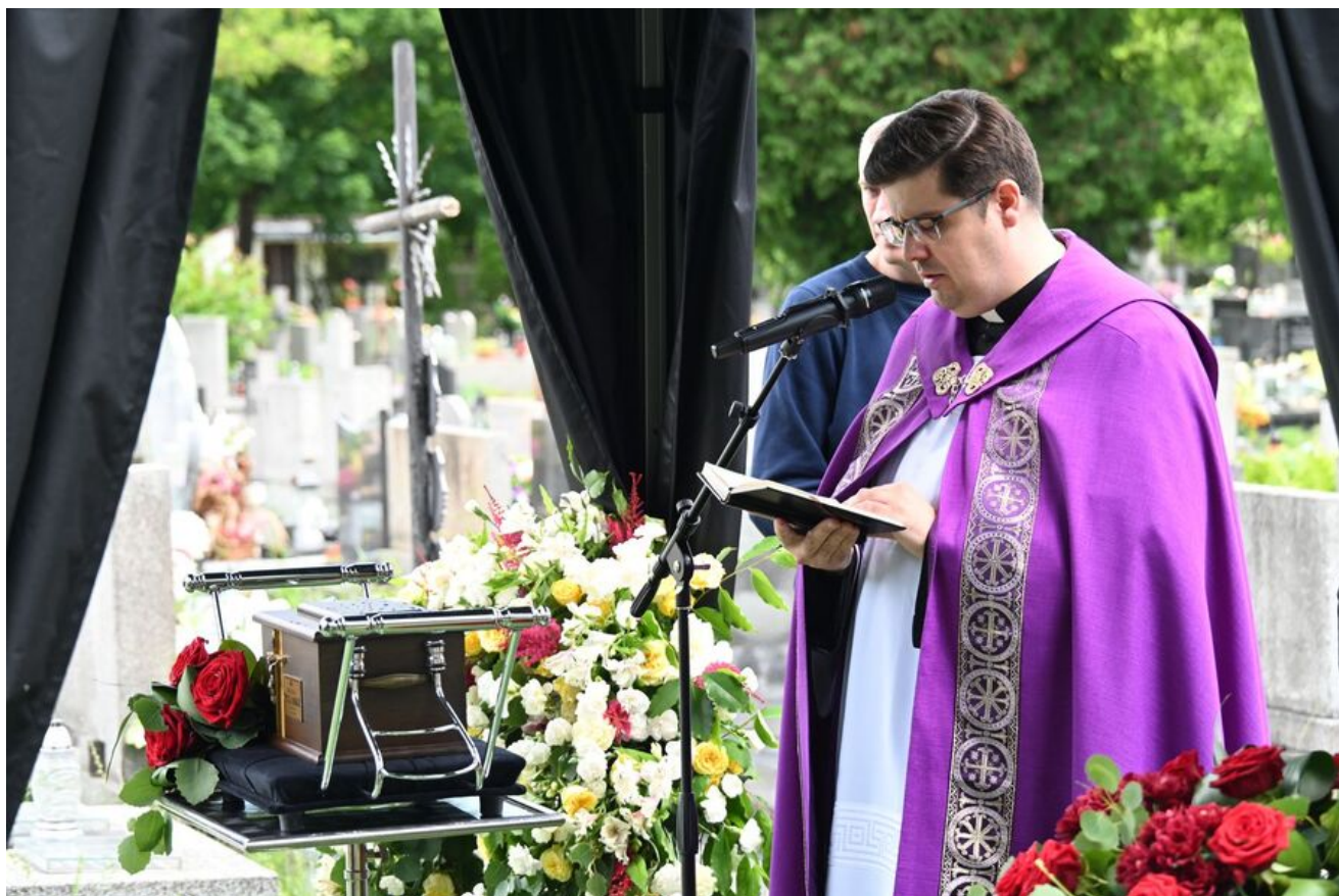
W Krakowie pochowano prof. Michała Pułaskiego.