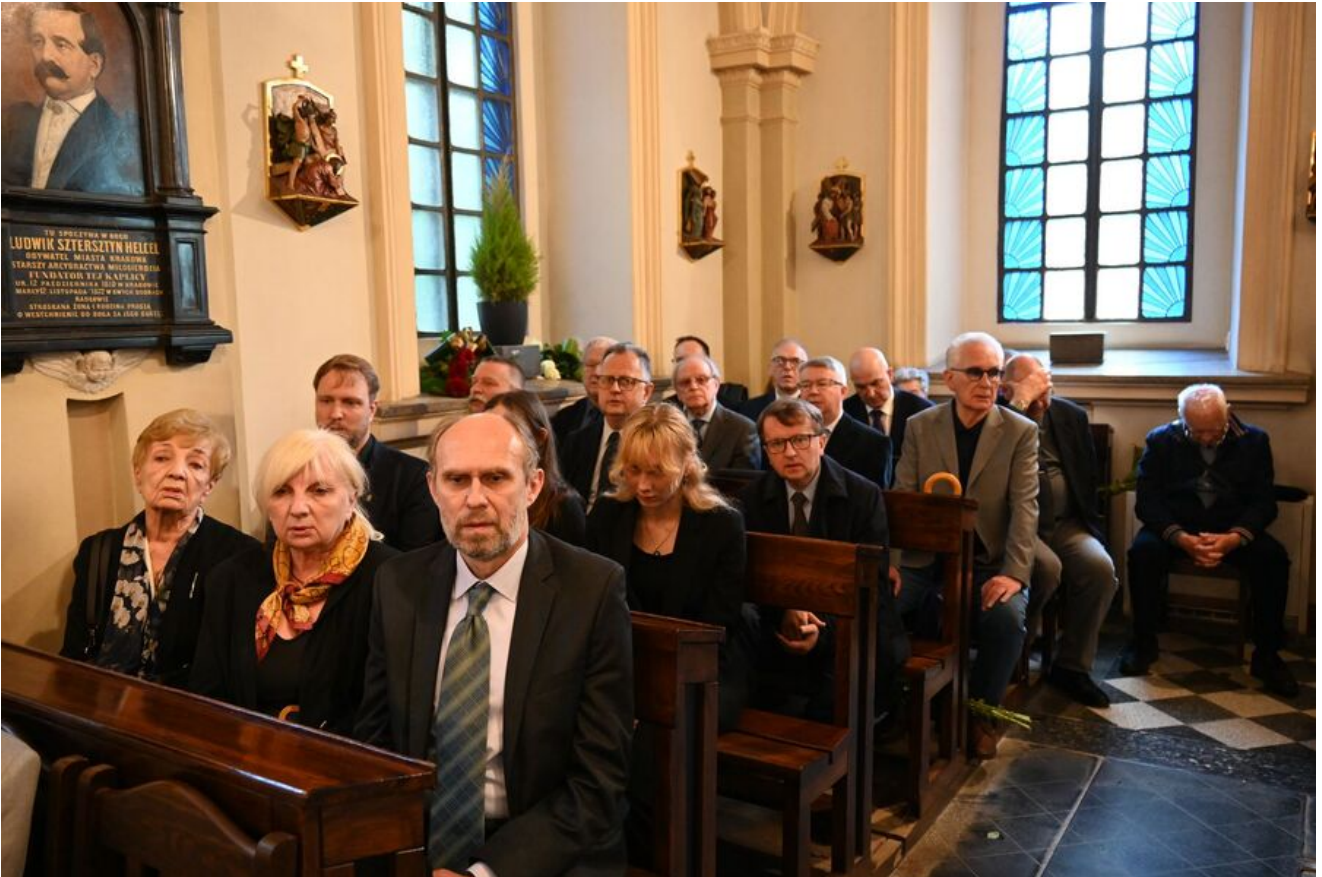
W Krakowie pochowano prof. Michała Pułaskiego.