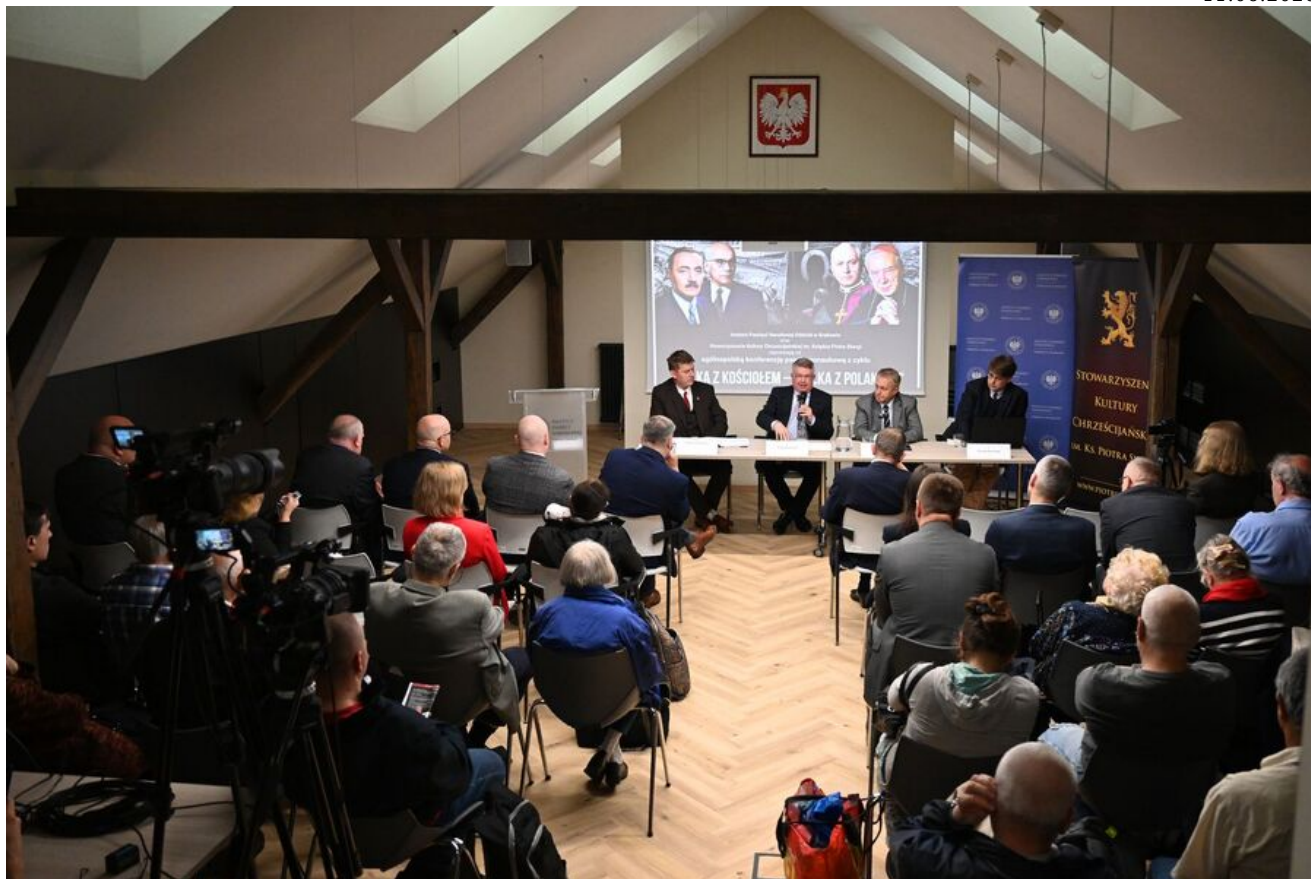
Kraków. Pierwsza konferencja z cyklu „Walka z Kościołem – Walka z Polakami”.