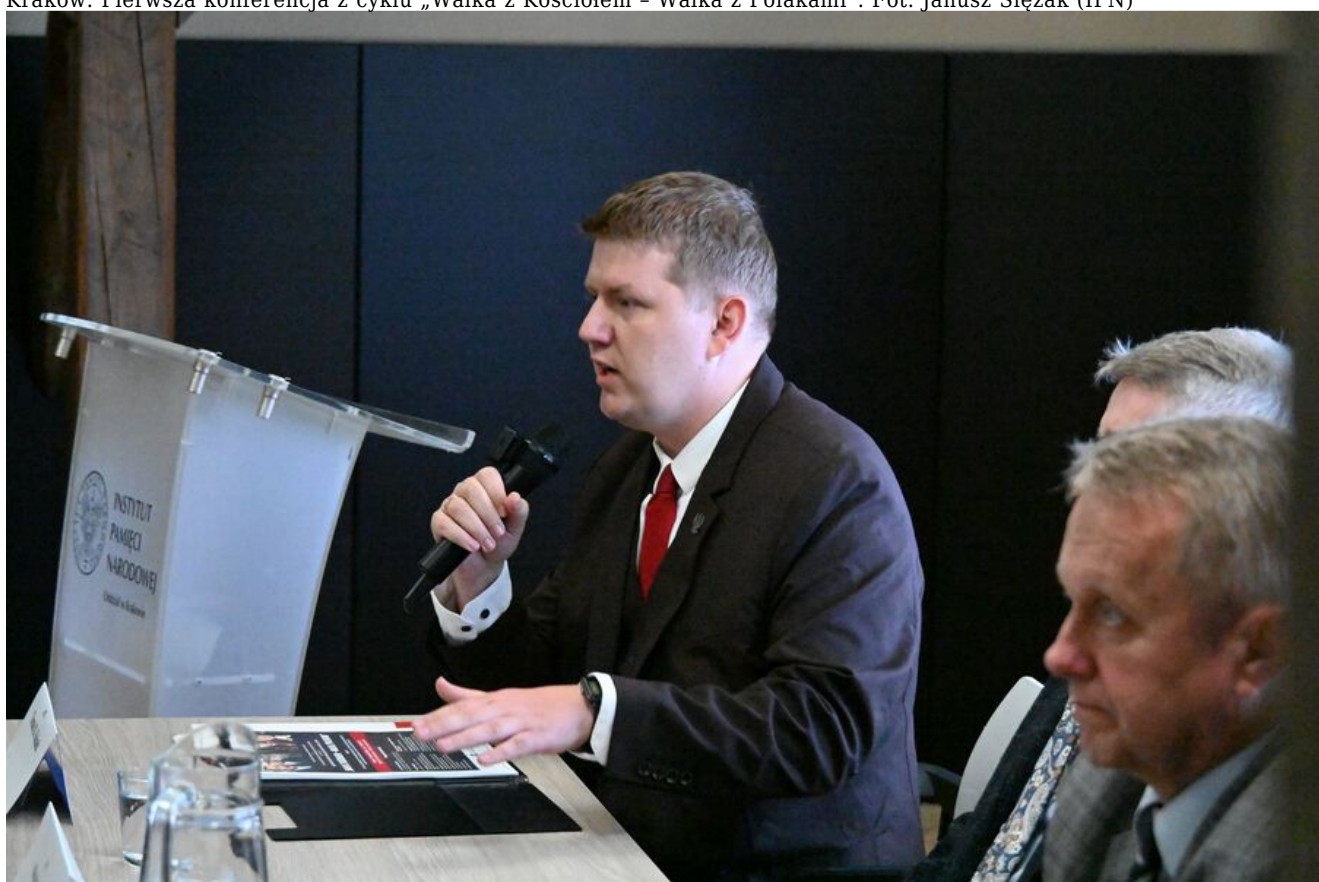
Kraków. Pierwsza konferencja z cyklu „Walka z Kościołem - Walka z Polakami”.