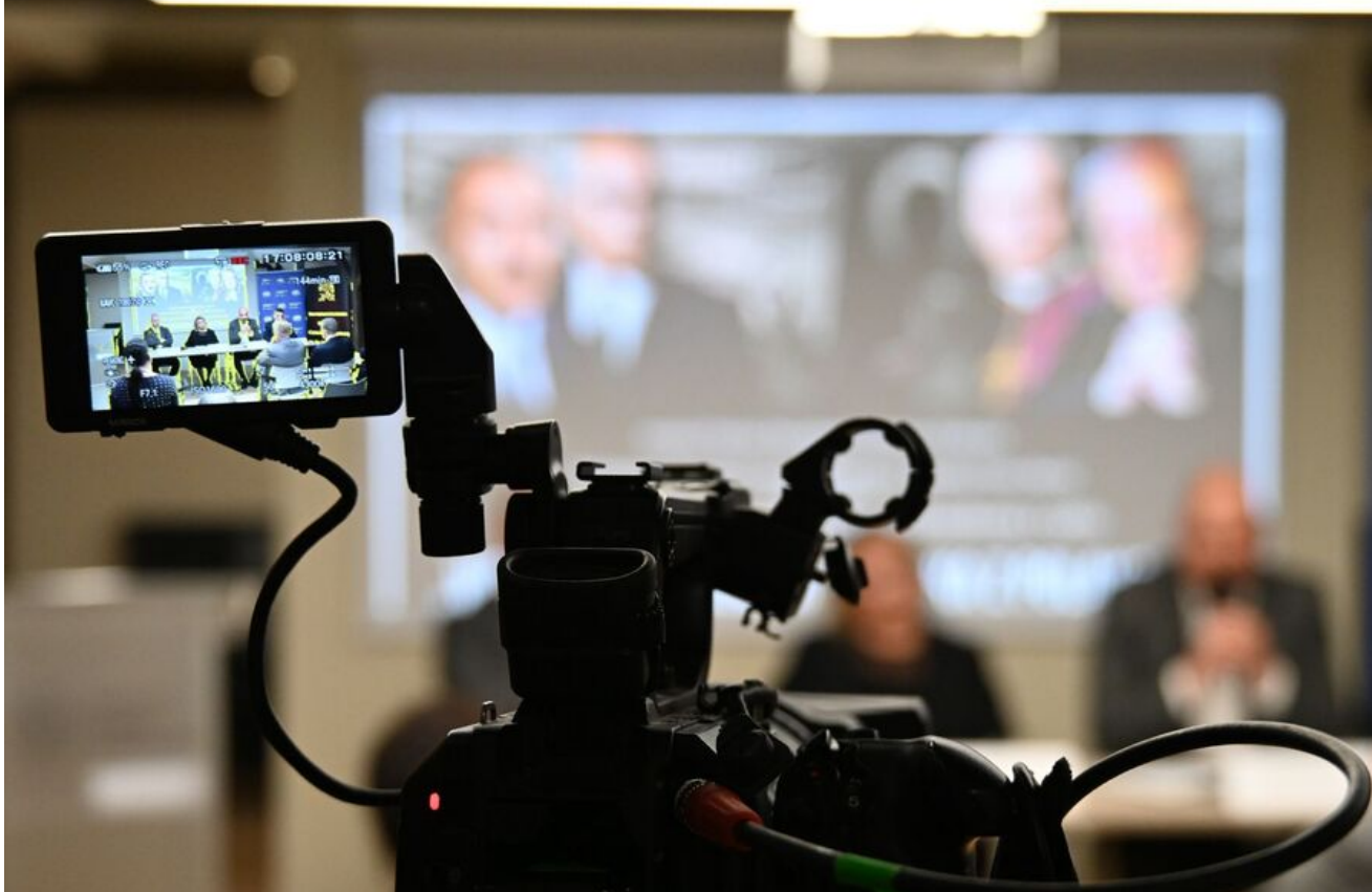
Kraków. Pierwsza konferencja z cyklu „Walka z Kościołem - Walka z Polakami”.

Była to pierwsza z cyklu konferencji zatytułowanych „Walka z Kościołem - Walka z Polakami”, które w ramach Centralnego Projektu Badawczego IPN „Władze komunistyczne wobec Kościołów i związków wyznaniowych 1944-1989” organizują krakowski oddział Instytutu i Stowarzyszenie Kultury Chrześcijańskiej im. ks. Piotra Skargi.