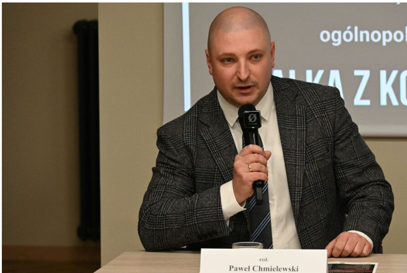
Kraków. Pierwsza konferencja z cyklu „Walka z Kościołem - Walka z Polakami”.