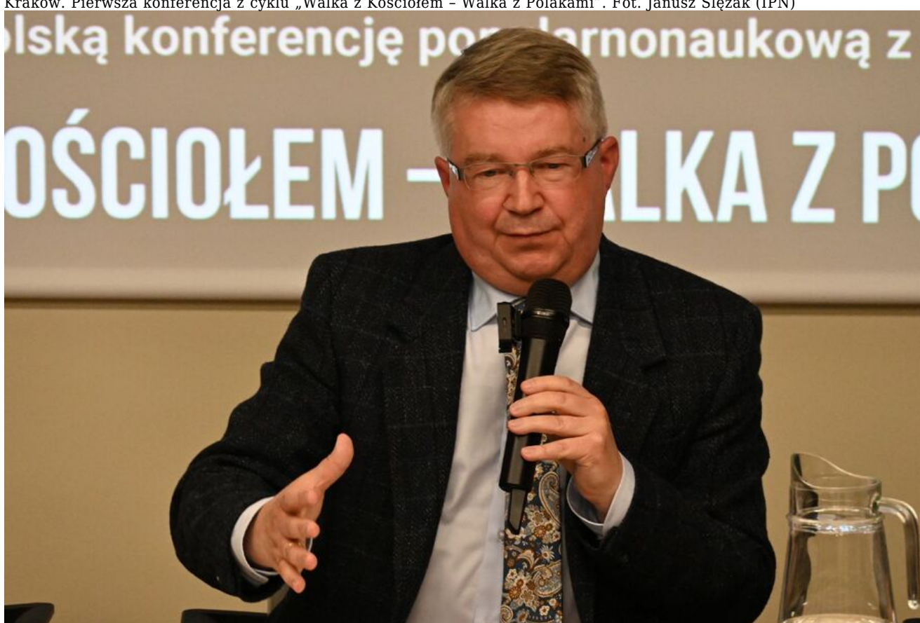
Kraków. Pierwsza konferencja z cyklu „Walka z Kościołem - Walka z Polakami”.