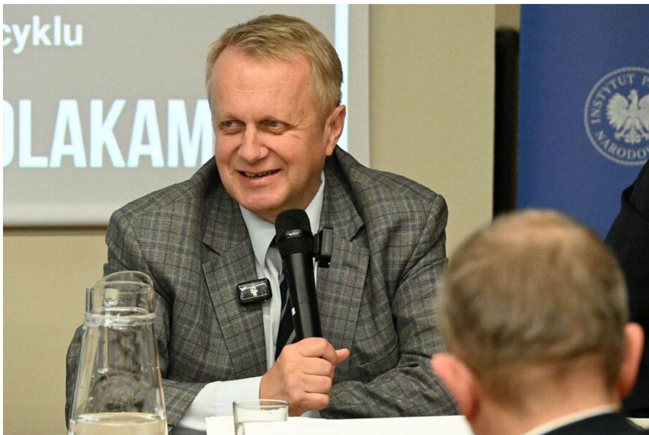
Kraków. Pierwsza konferencja z cyklu „Walka z Kościołem - Walka z Polakami”.