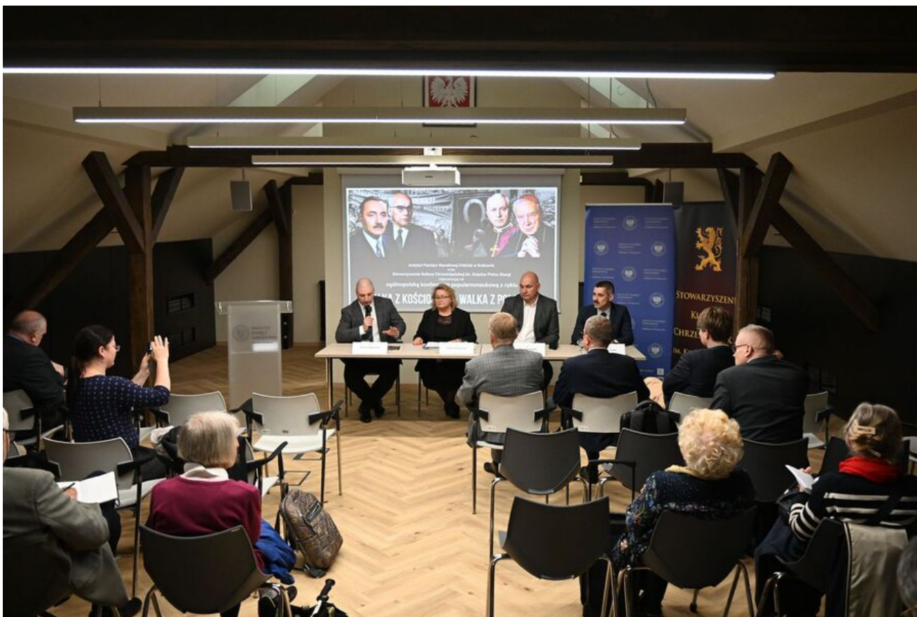
Kraków. Pierwsza konferencja z cyklu „Walka z Kościołem - Walka z Polakami”.