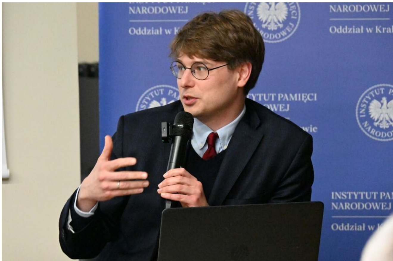
Kraków. Pierwsza konferencja z cyklu „Walka z Kościołem - Walka z Polakami”.