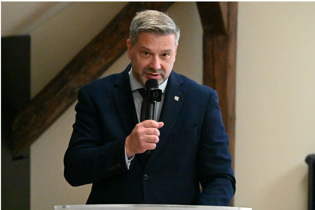
Kraków. Pierwsza konferencja z cyklu „Walka z Kościołem - Walka z Polakami”.