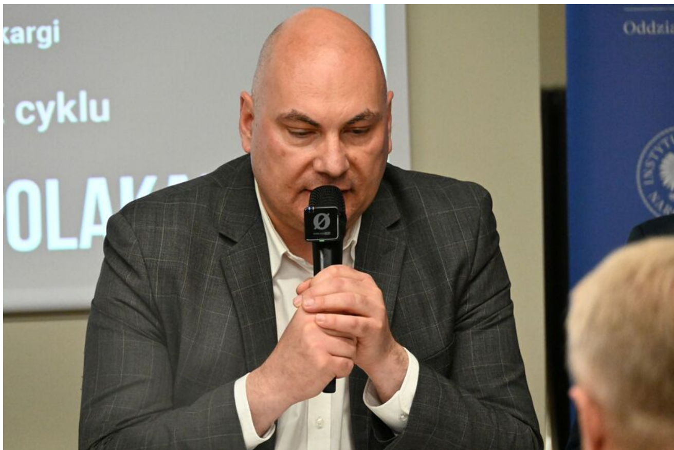
Kraków. Pierwsza konferencja z cyklu „Walka z Kościołem - Walka z Polakami”.