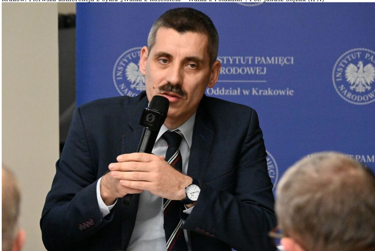
Kraków. Pierwsza konferencja z cyklu „Walka z Kościołem - Walka z Polakami”.