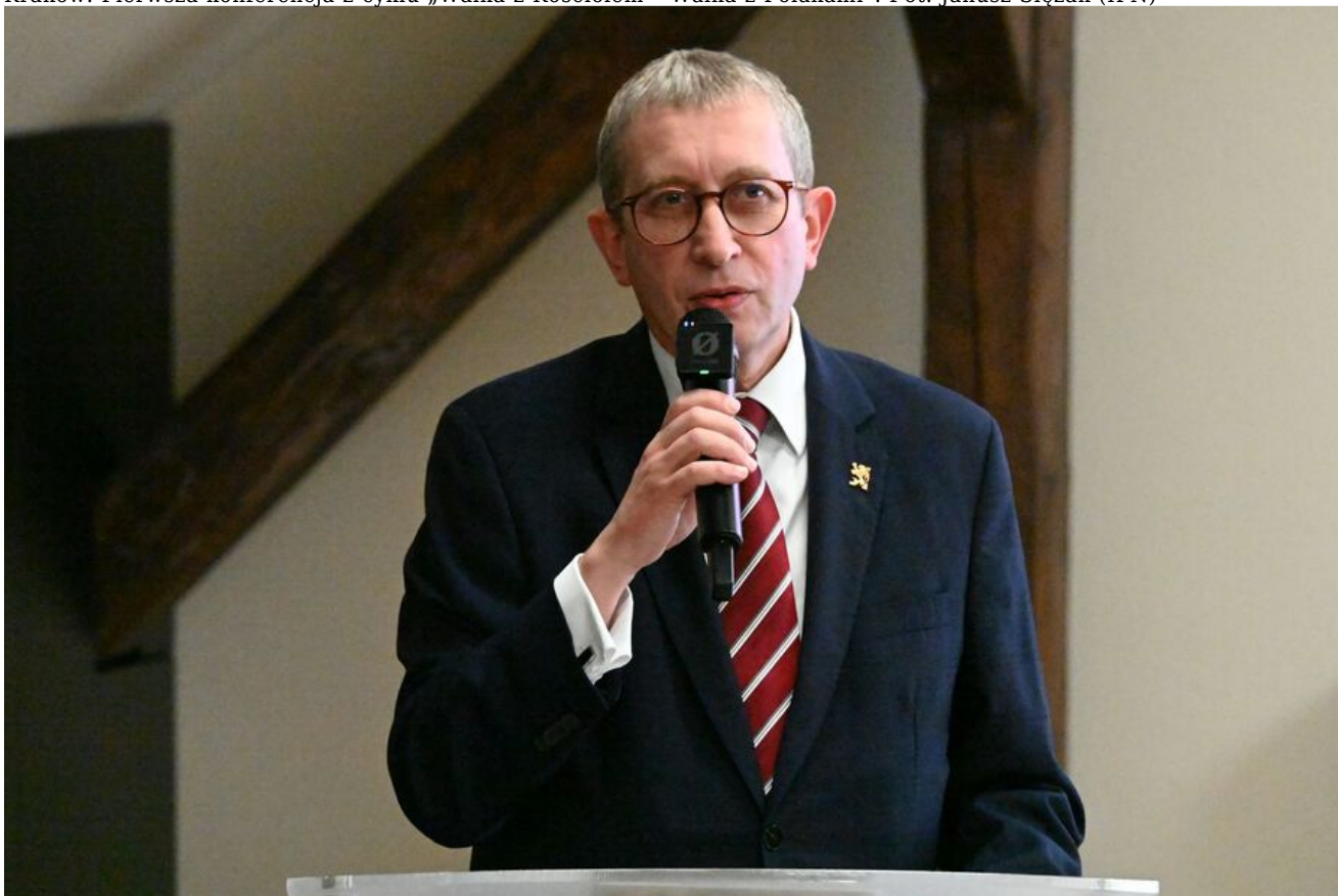
Kraków. Pierwsza konferencja z cyklu „Walka z Kościołem - Walka z Polakami”.