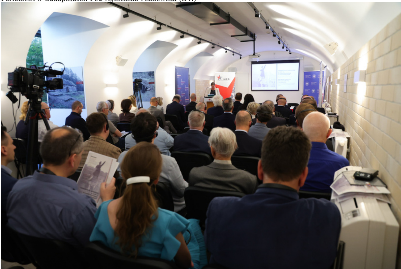
Konferencja „Dwie drogi rewolucji. Rok 1956 w Polsce i na Węgrzech”.

27 maja 2026 r. w drodze na Przystanek Historia IPN w Budapeszcie delegacja krakowskiego oddziału Instytutu zatrzymała się w miejscowości Rétság, by złożyć kwiaty pod pomnikiem upamiętniającym uwolnienie prymasa Węgier kard. Józsefa Mindszentyego podczas powstania 1956 r.