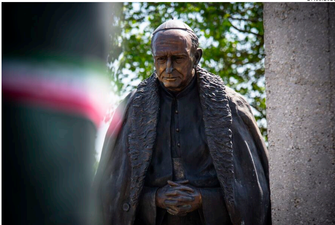
Pomnik kard. Józsefa Mindszentyego w Rétság.