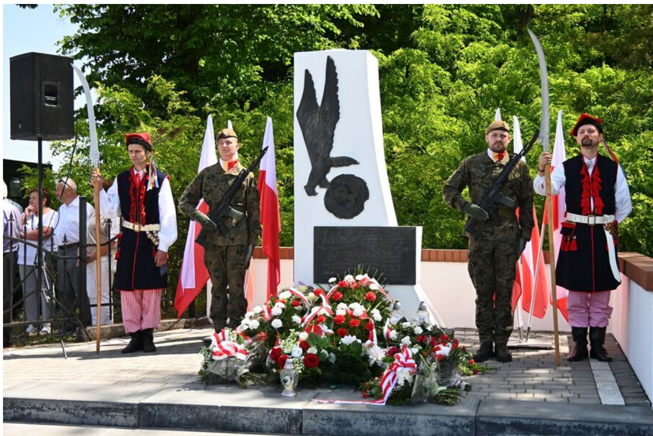
Uroczystości w Wierzbnie.

Uroczystości towarzyszyły skoki spadochronowe oraz rekonstrukcja starcia partyzantów AK z oddziałami niemieckimi.