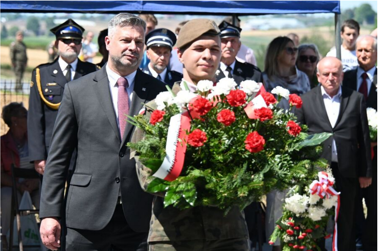
Uroczystości w Wierzbnie.