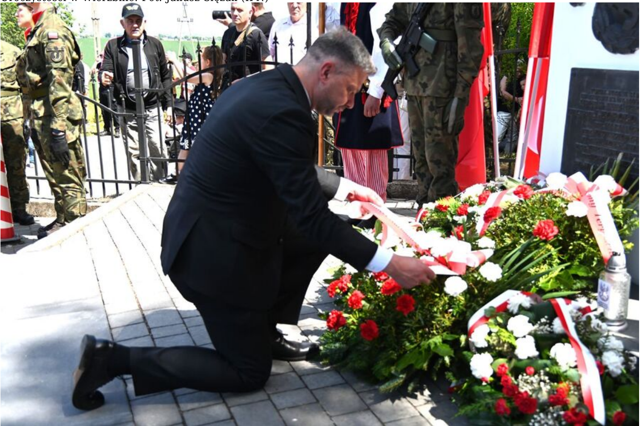
Uroczystości w Wierzbnie.