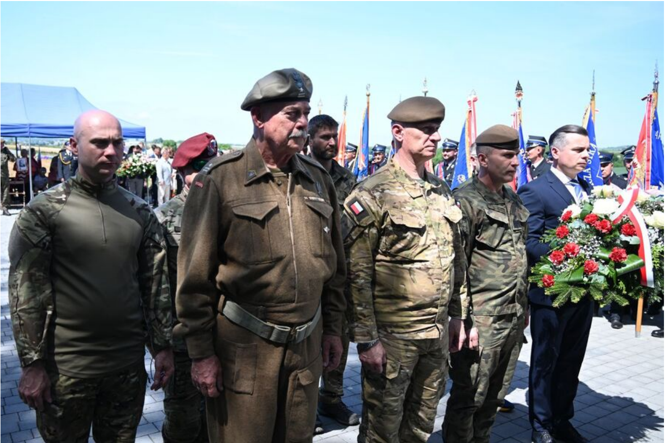
Uroczystości w Wierzbnie.