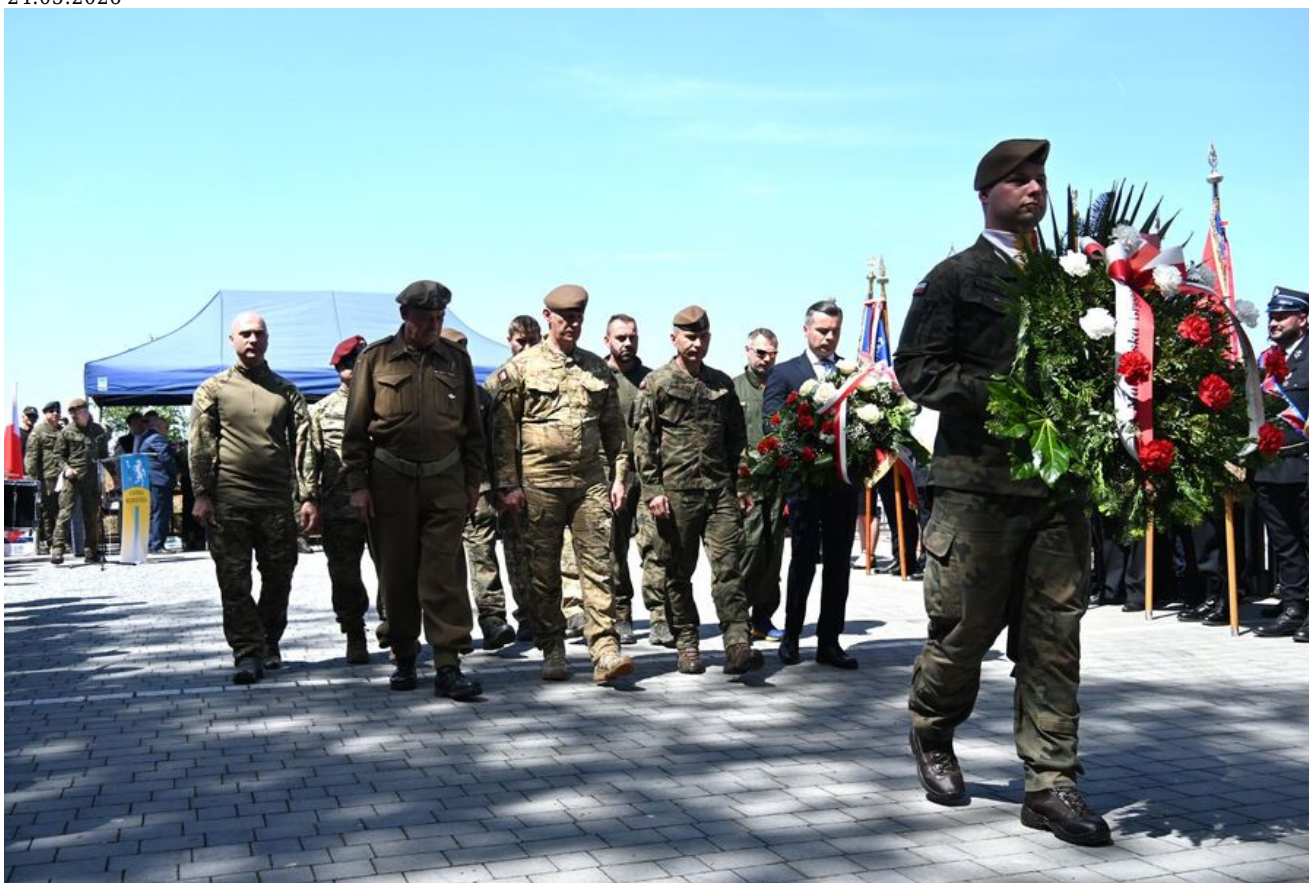
Uroczystości w Wierzbnie.