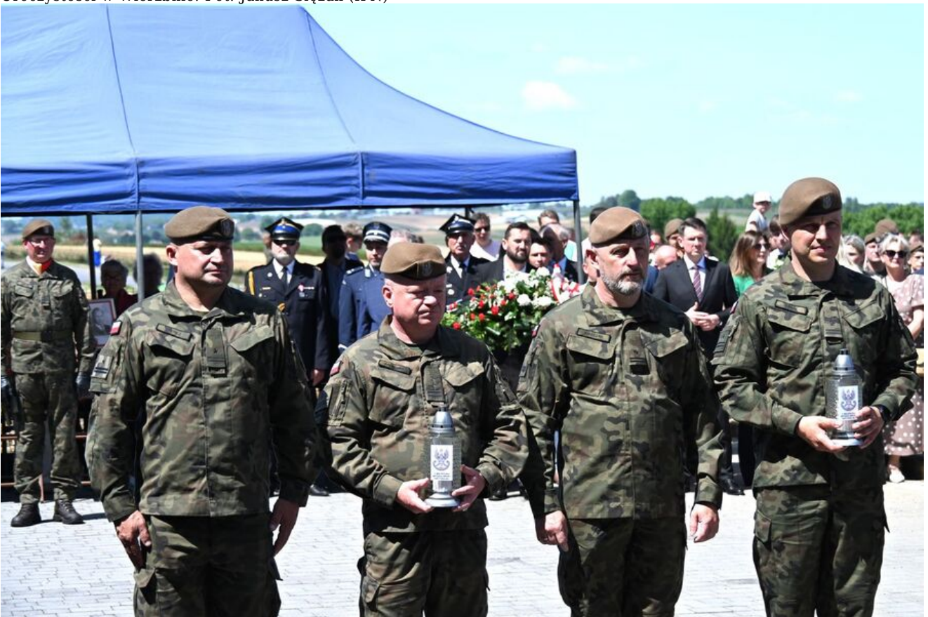
Uroczystości w Wierzbnie.