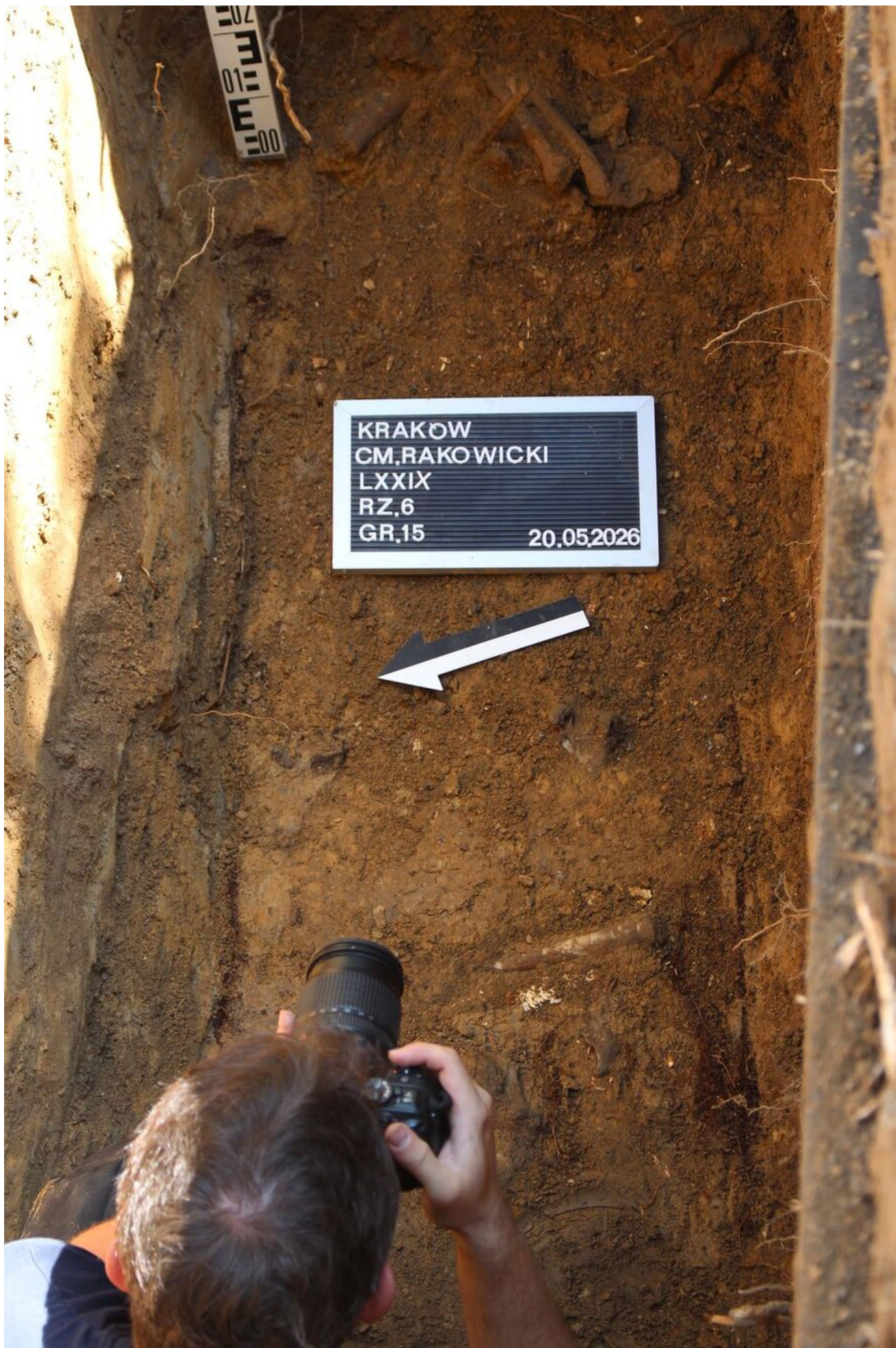
Prace poszukiwawcze na Cmentarzu Rakowickim w Krakowie.