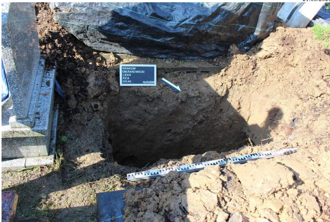
Prace poszukiwawcze na Cmentarzu Rakowickim w Krakowie.