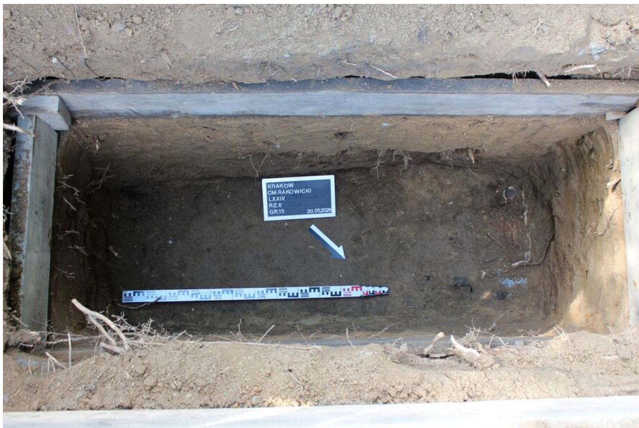
Prace poszukiwawcze na Cmentarzu Rakowickim w Krakowie.

W trakcie prac udało się natrafić na ludzkie szczątki, które mogły należeć do osób zamordowanych w 1947 i 1948 r. Według ustaleń historycznych mogą to być osoby związane ze zgrupowaniem Józefa Kurasia „Ognia” i oddziałem „Wiarusy” na Podhalu, jak też działającą na Ziemi Brzeskiej grupą Władysława Pudełka „Zbroi” i podziemiem niepodległościowym z okolic Jaworzna.