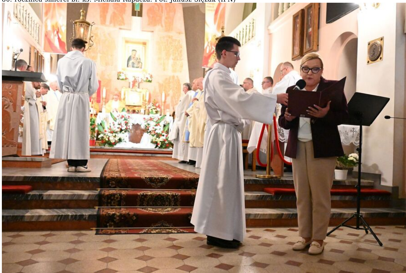
80. rocznica śmierci bł. ks. Michała Rapacza.