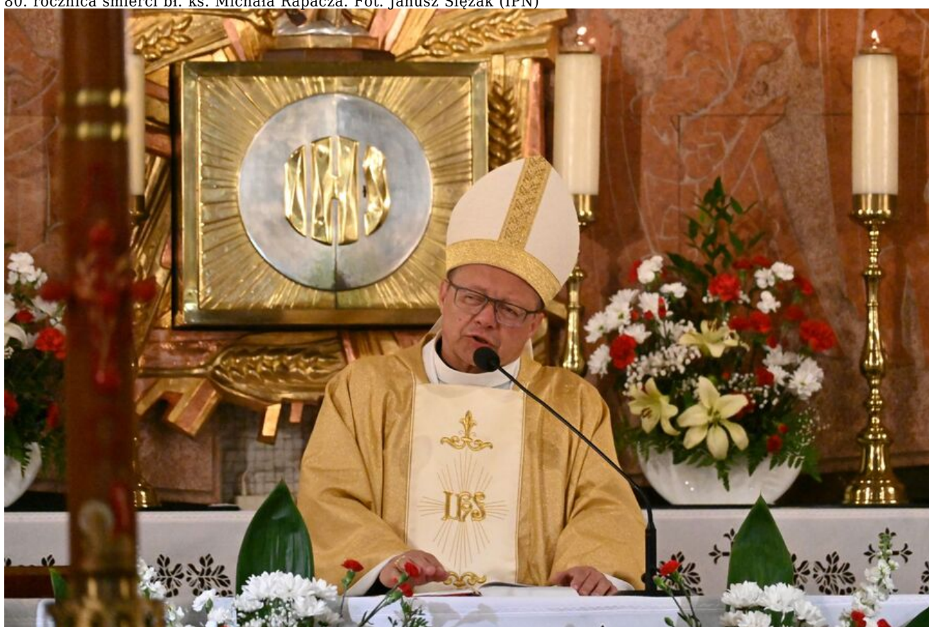
80. rocznica śmierci bł. ks. Michała Rapacza.