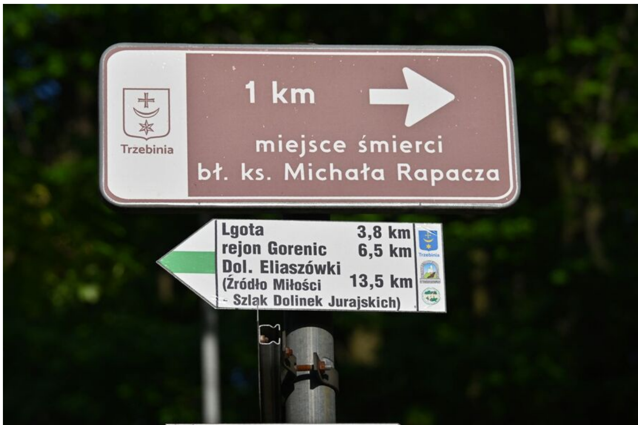
80. rocznica śmierci bł. ks. Michała Rapacza.