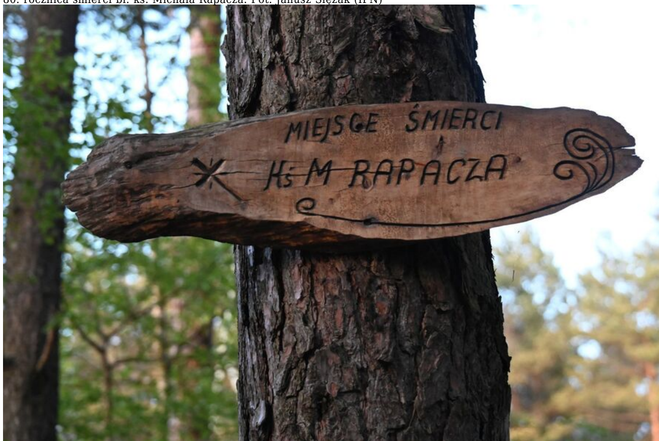
80. rocznica śmierci bł. ks. Michała Rapacza.