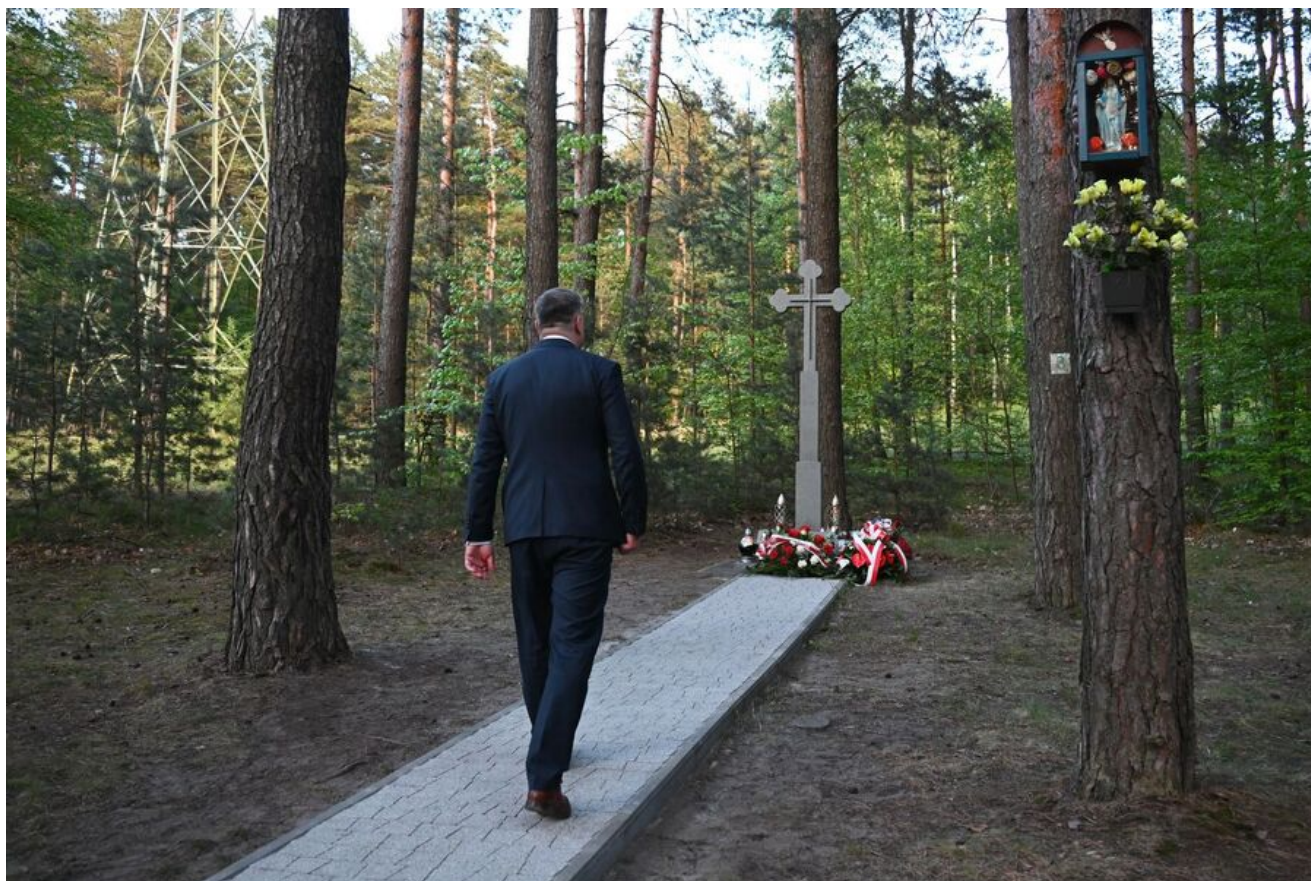
80. rocznica śmierci bł. ks. Michała Rapacza.