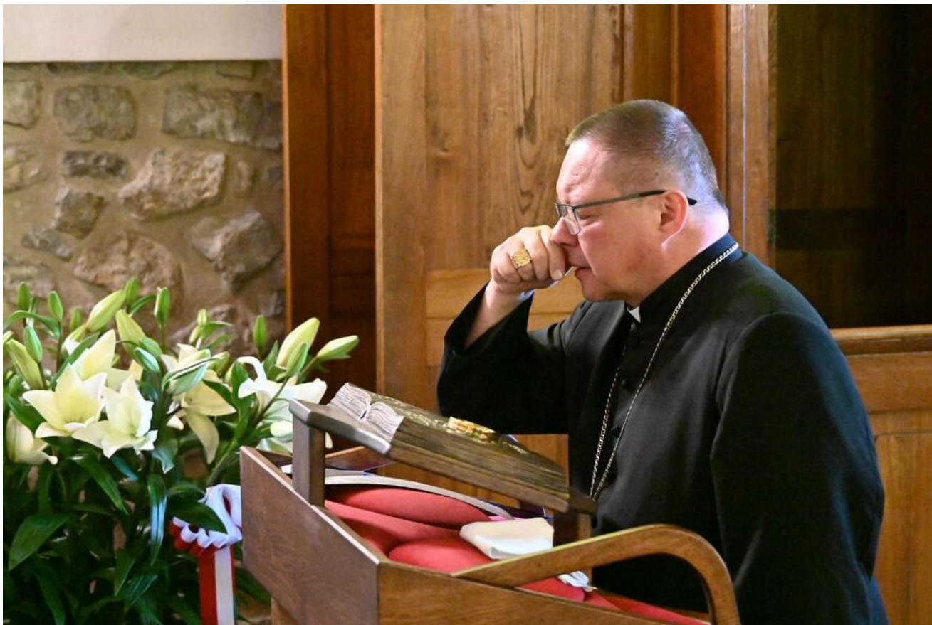
80. rocznica śmierci bł. ks. Michała Rapacza.