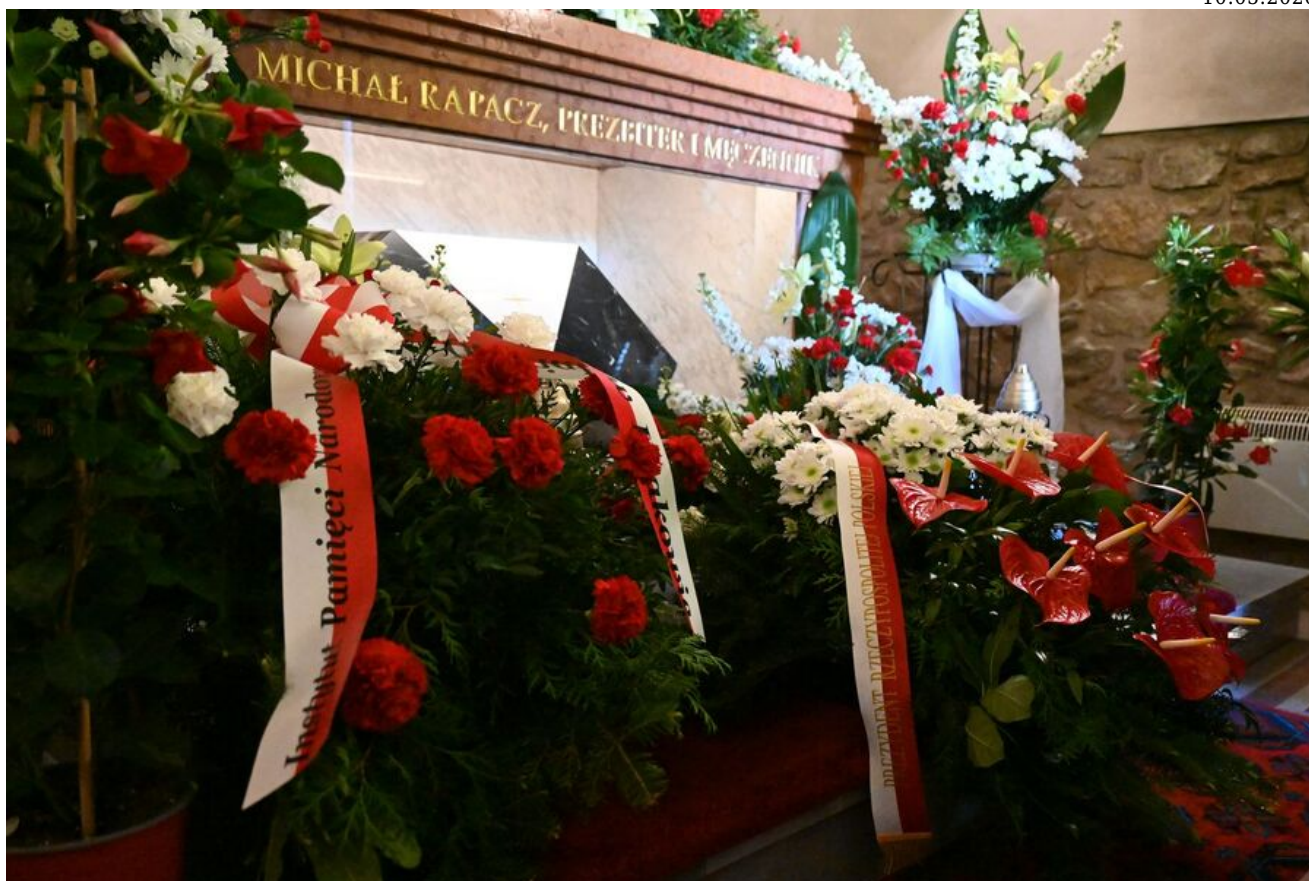
80. rocznica śmierci bł. ks. Michała Rapacza.