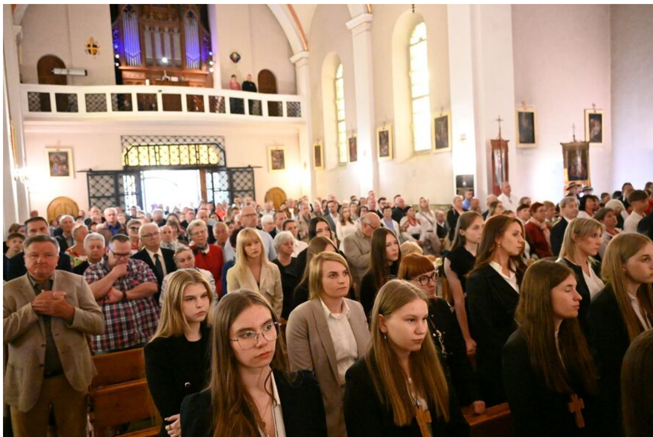
80. rocznica śmierci bł. ks. Michała Rapacza.