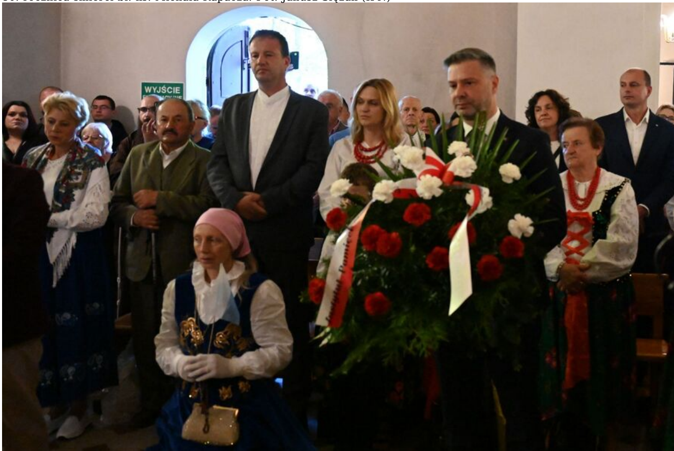
80. rocznica śmierci bł. ks. Michała Rapacza.