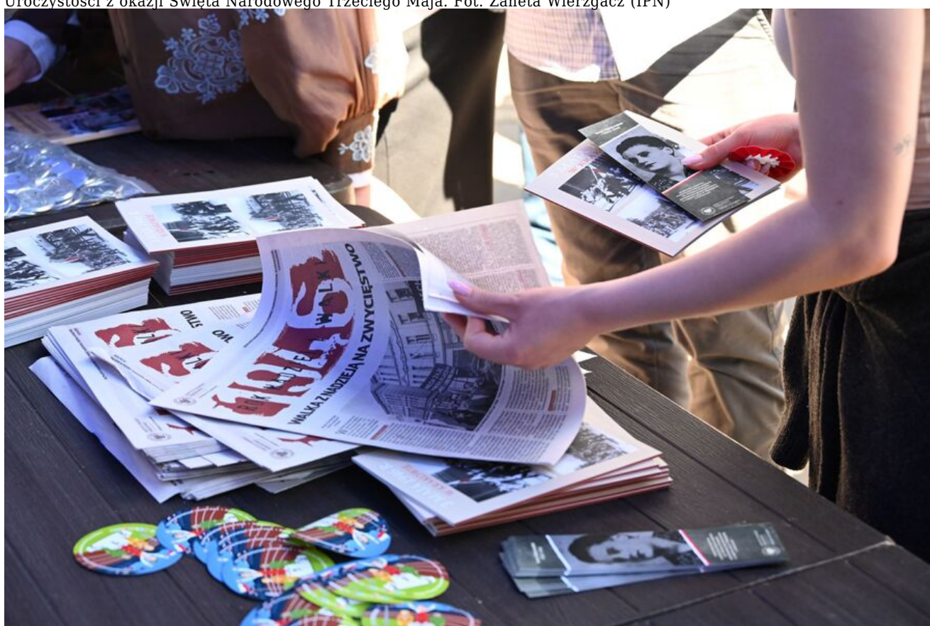
Uroczystości z okazji Święta Narodowego Trzeciego Maja.