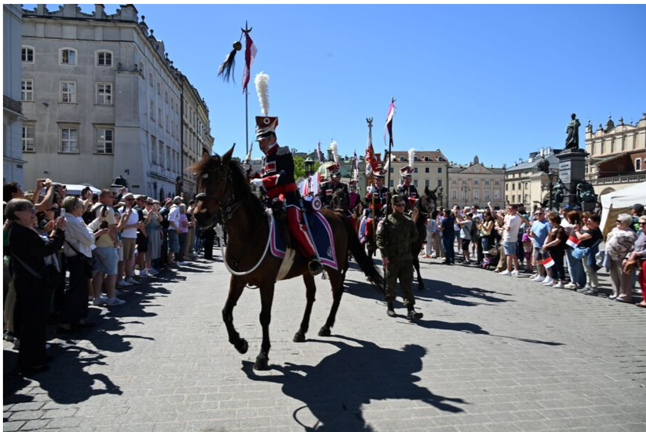
Uroczystości z okazji Święta Narodowego Trzeciego Maja.