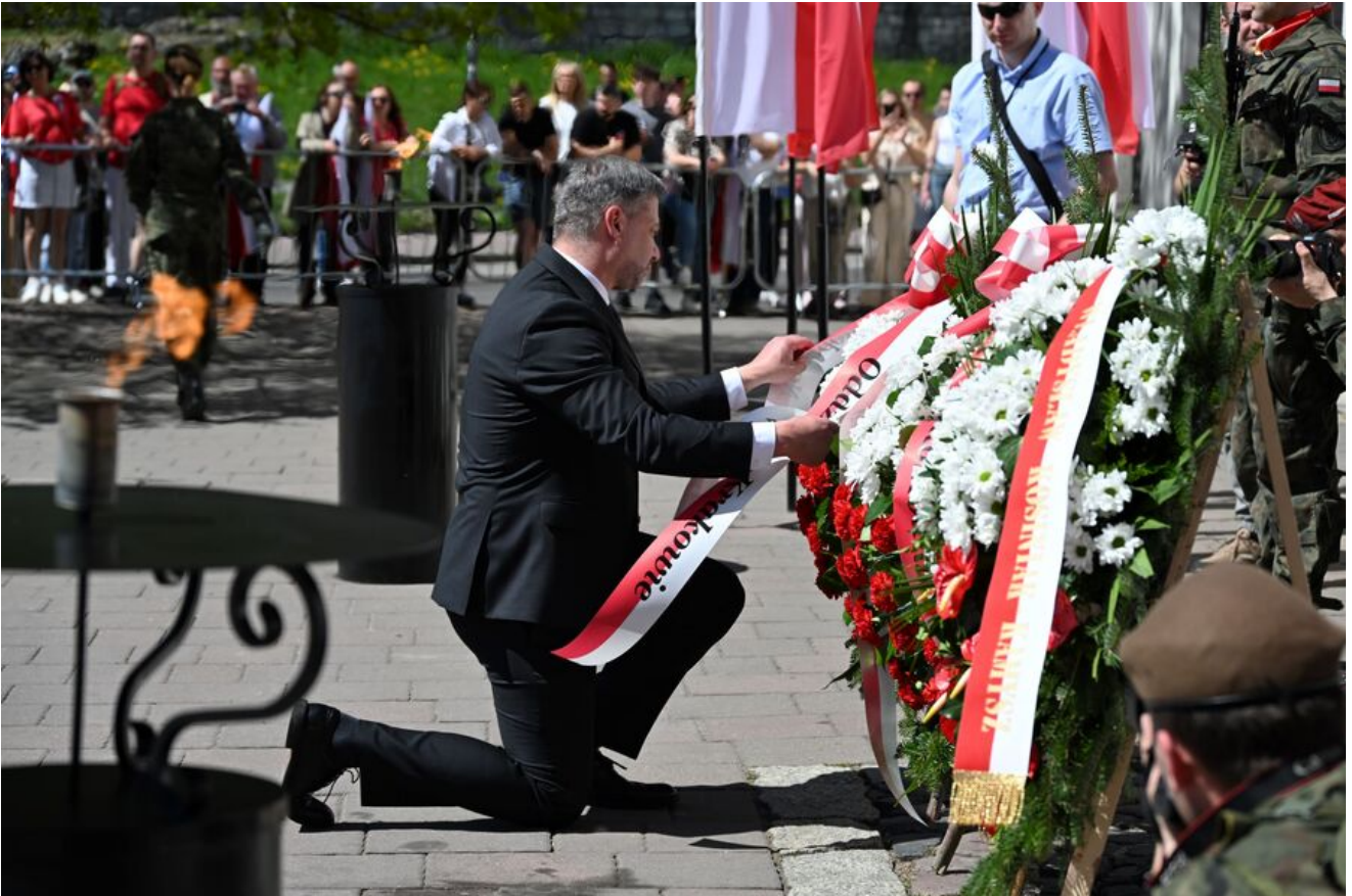
Uroczystości z okazji Święta Narodowego Trzeciego Maja.