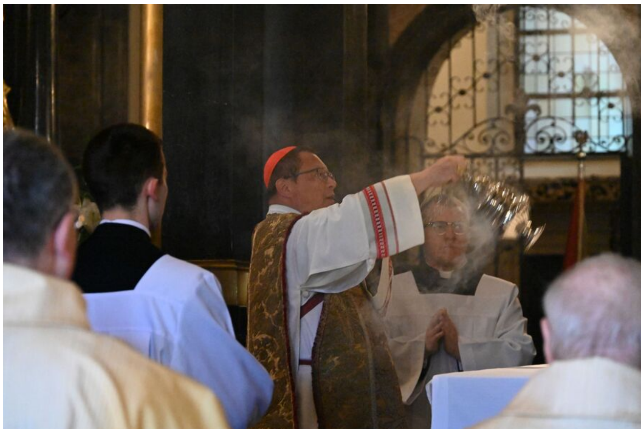
Uroczystości z okazji Święta Narodowego Trzeciego Maja.