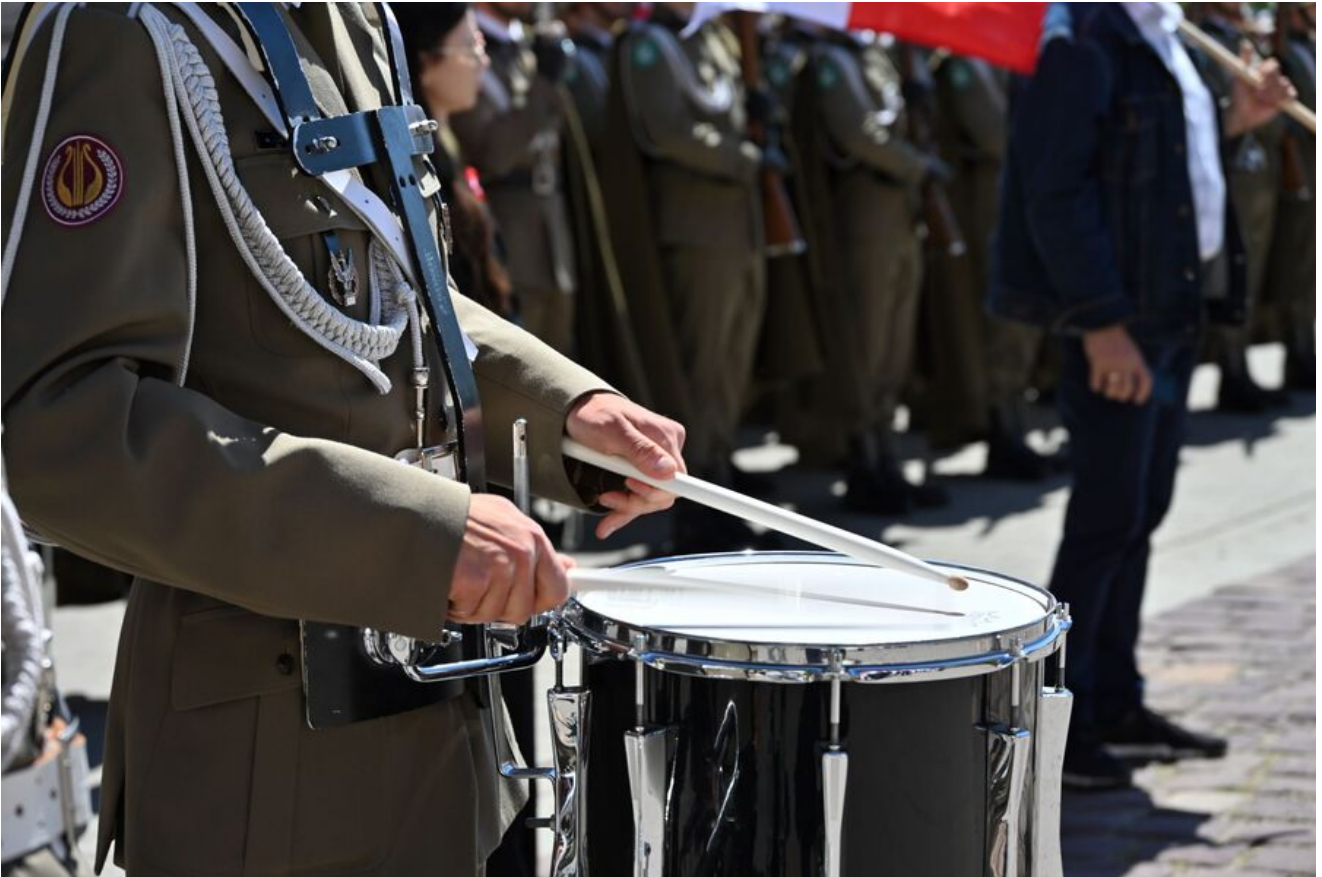
Uroczystości z okazji Święta Narodowego Trzeciego Maja.