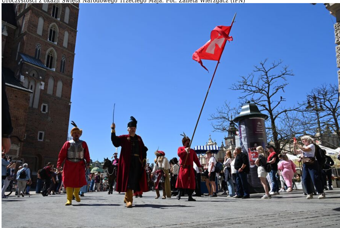
Uroczystości z okazji Święta Narodowego Trzeciego Maja.