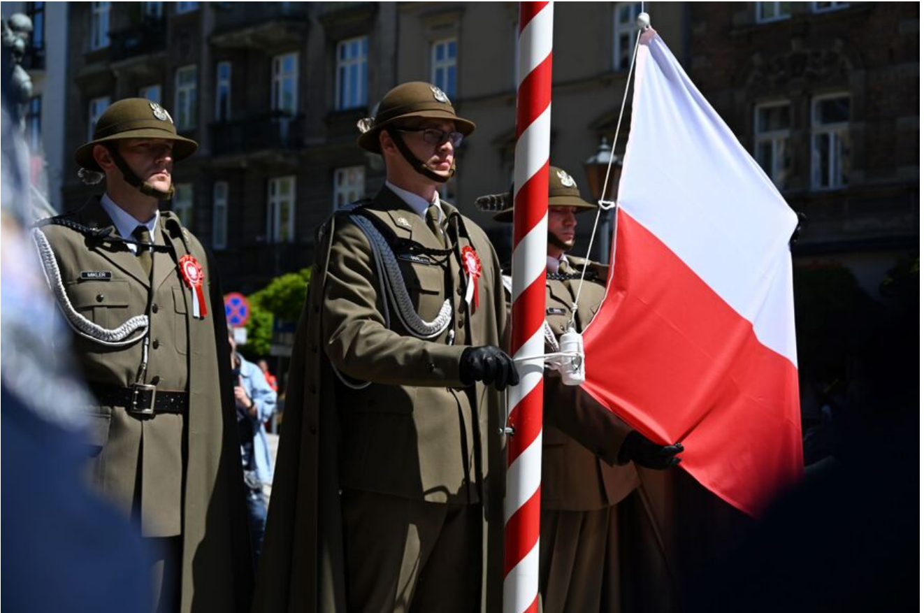
Uroczystości z okazji Święta Narodowego Trzeciego Maja.