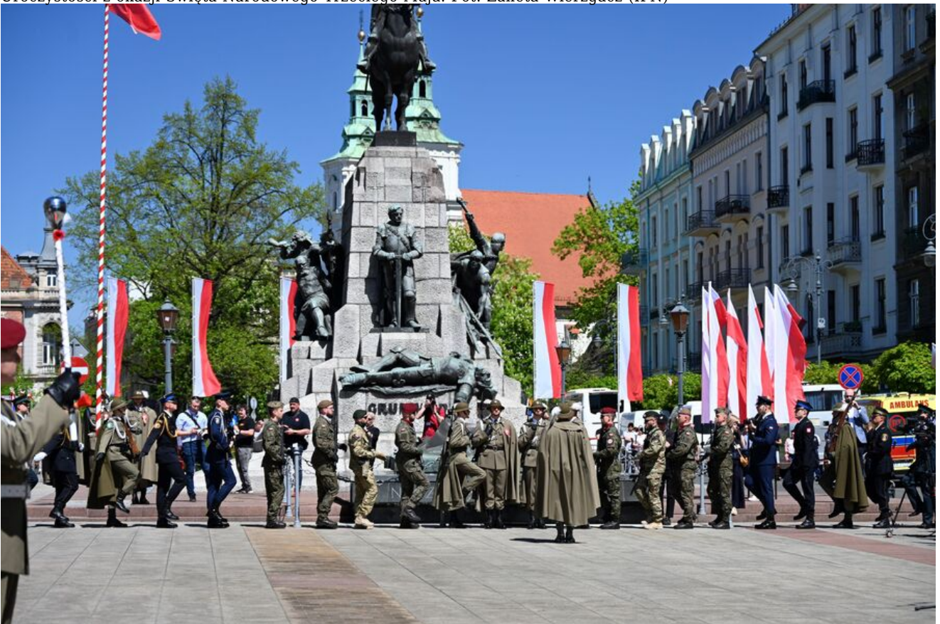
Uroczystości z okazji Święta Narodowego Trzeciego Maja.