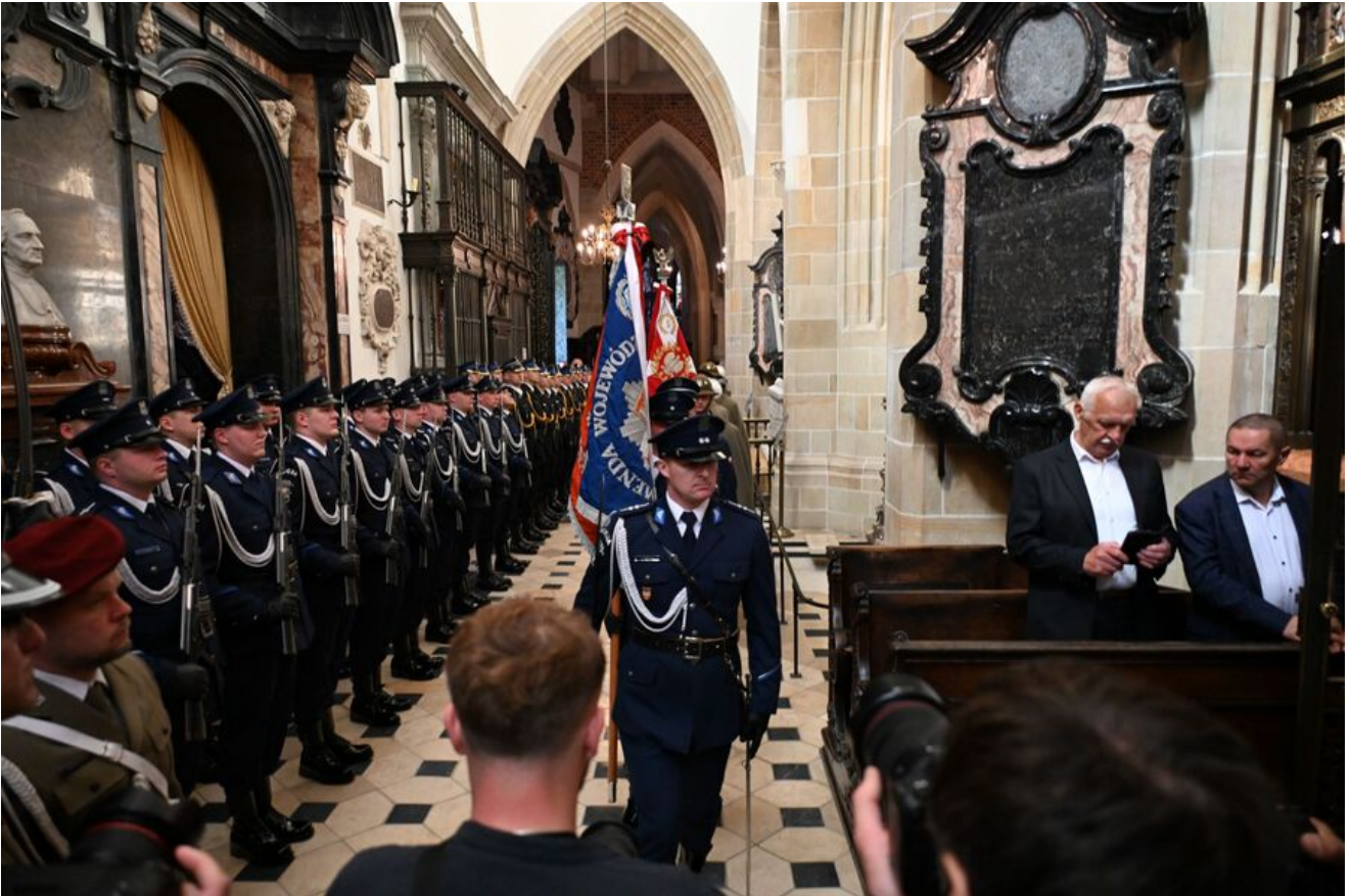
Uroczystości z okazji Święta Narodowego Trzeciego Maja.