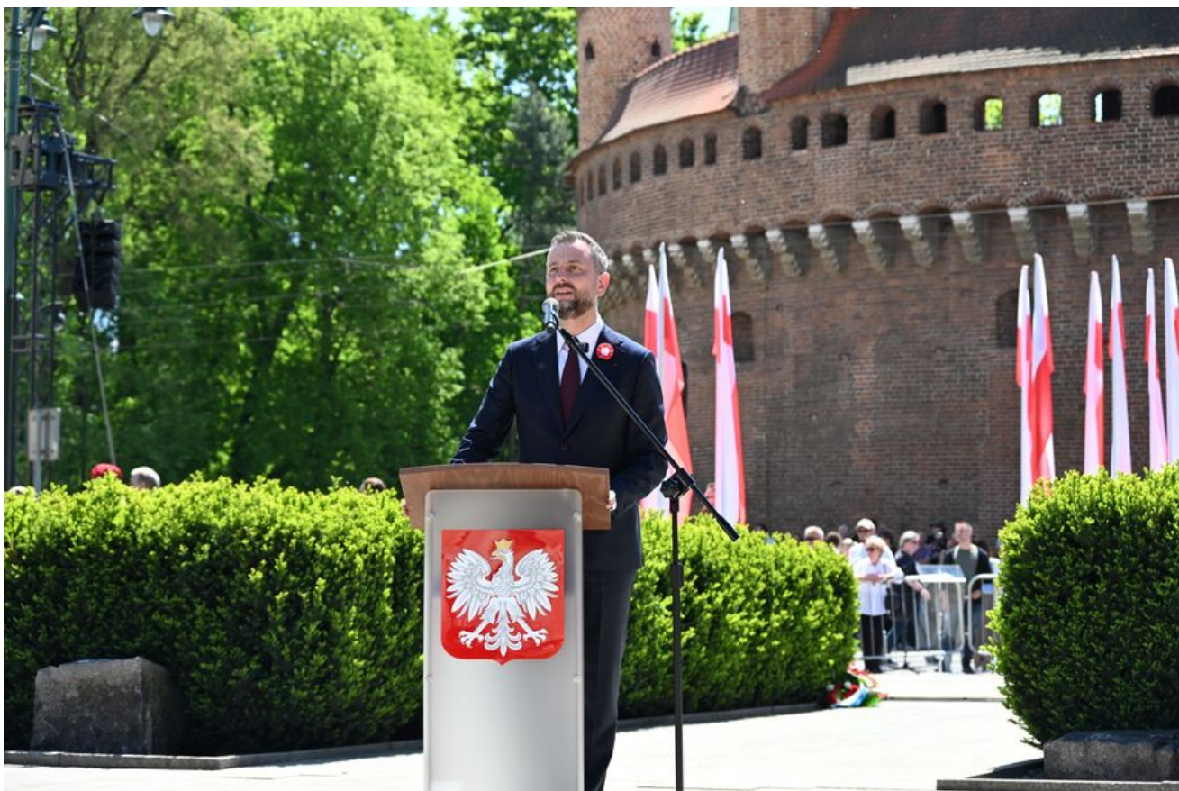
Uroczystości z okazji Święta Narodowego Trzeciego Maja.