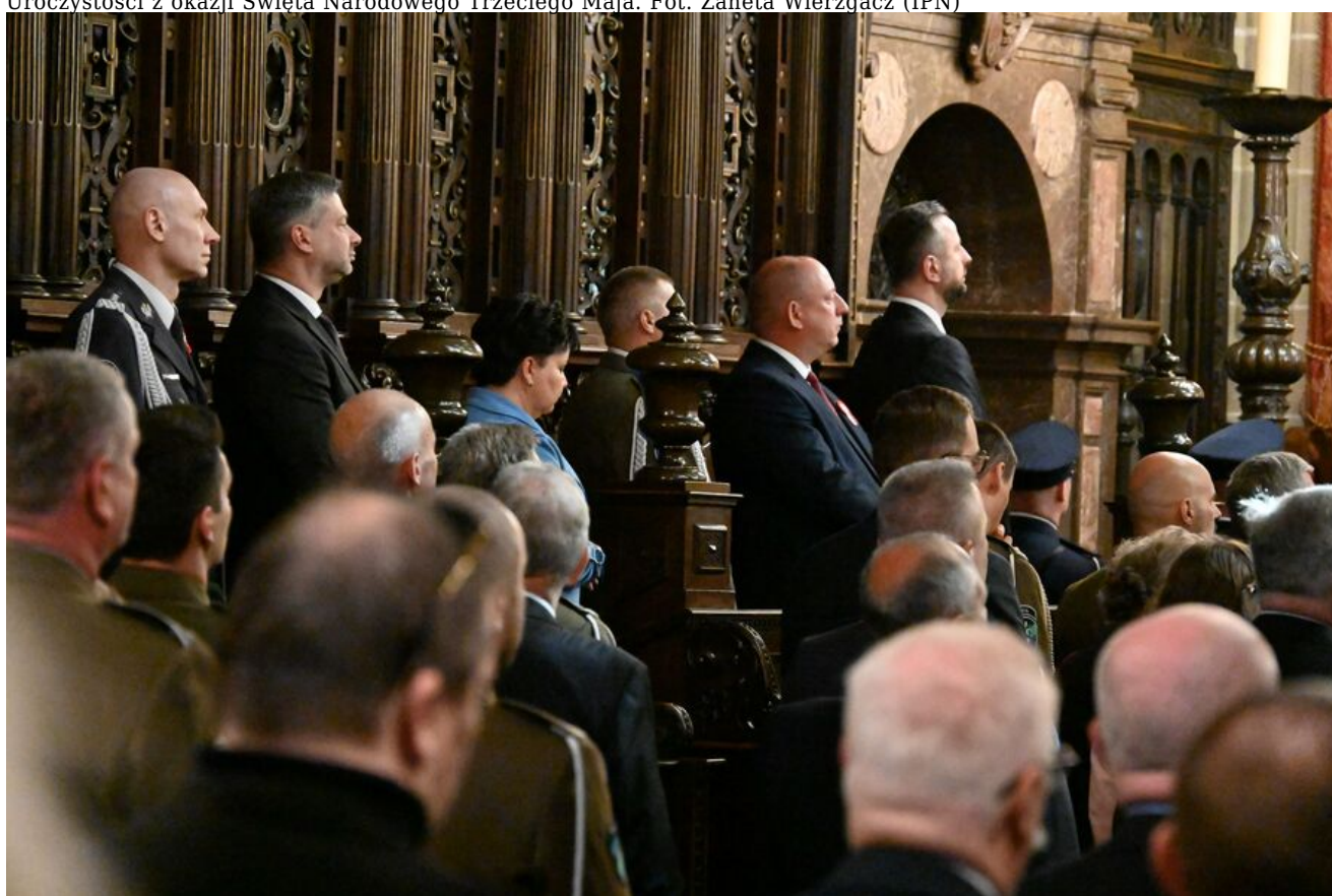
Uroczystości z okazji Święta Narodowego Trzeciego Maja.