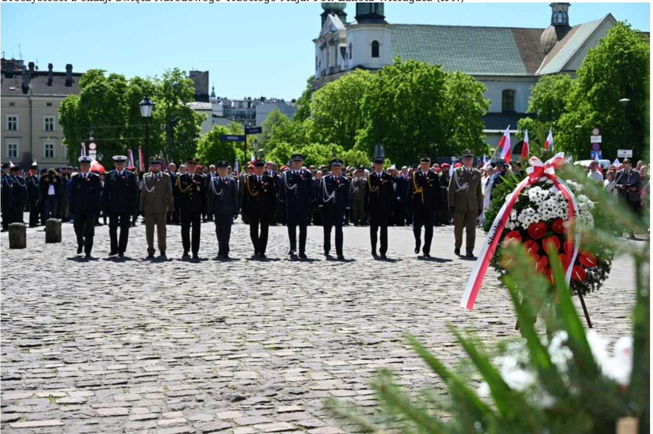
Uroczystości z okazji Święta Narodowego Trzeciego Maja.