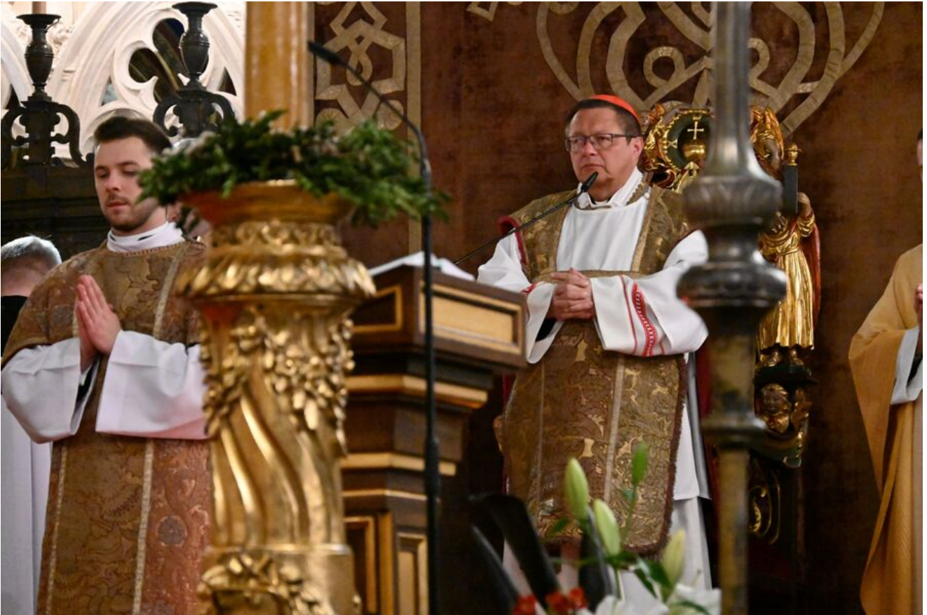
Uroczystości z okazji Święta Narodowego Trzeciego Maja.