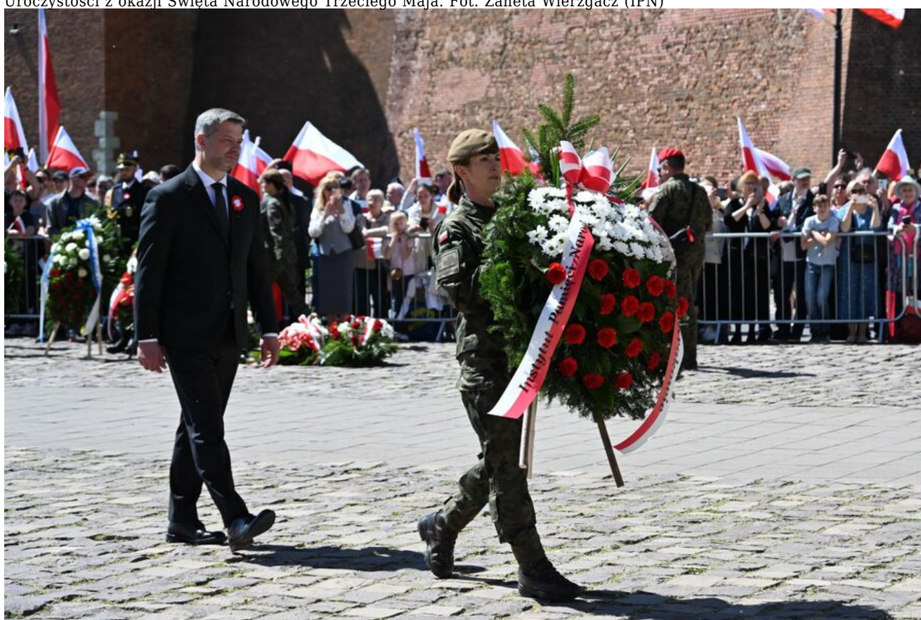
Uroczystości z okazji Święta Narodowego Trzeciego Maja.