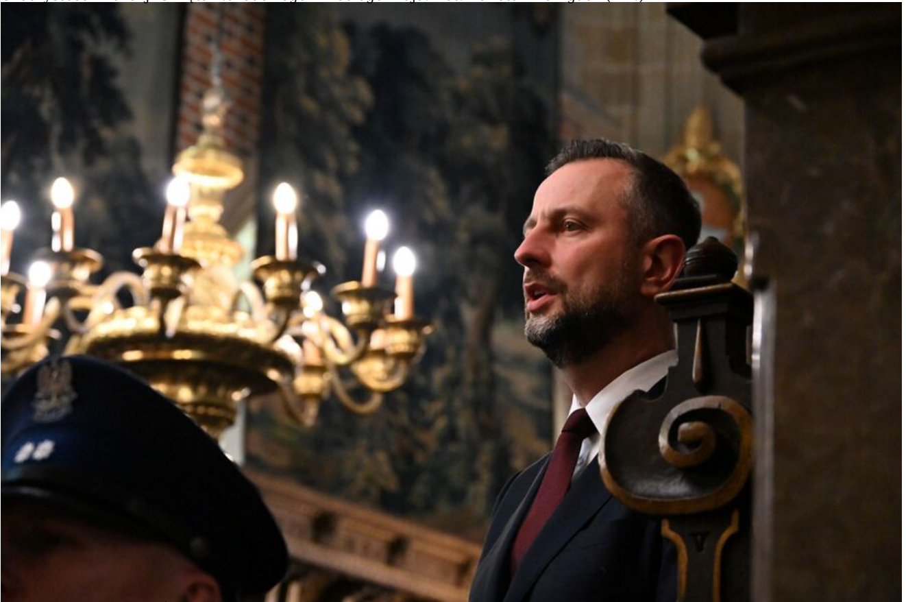
Uroczystości z okazji Święta Narodowego Trzeciego Maja.