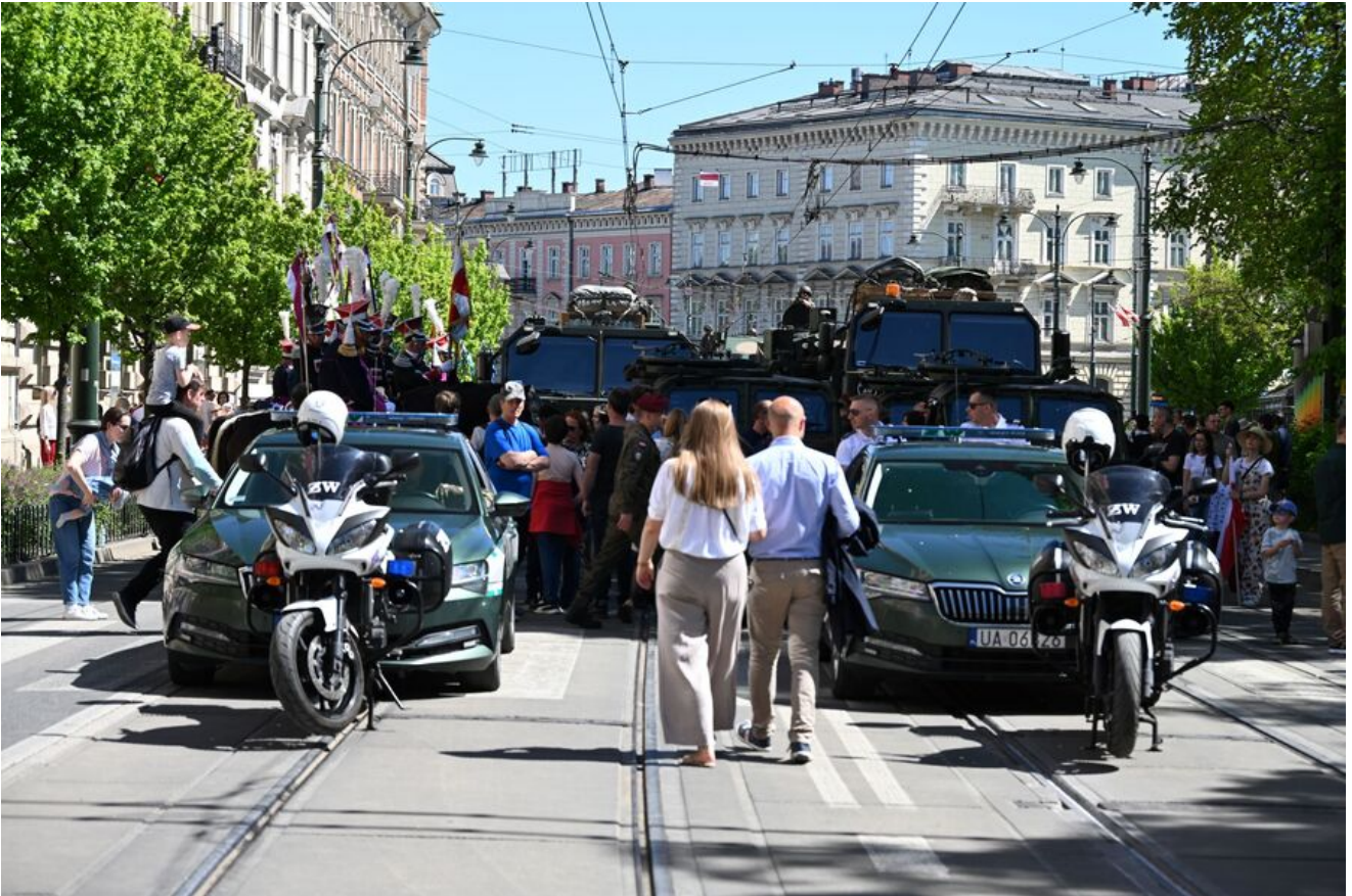
Uroczystości z okazji Święta Narodowego Trzeciego Maja.