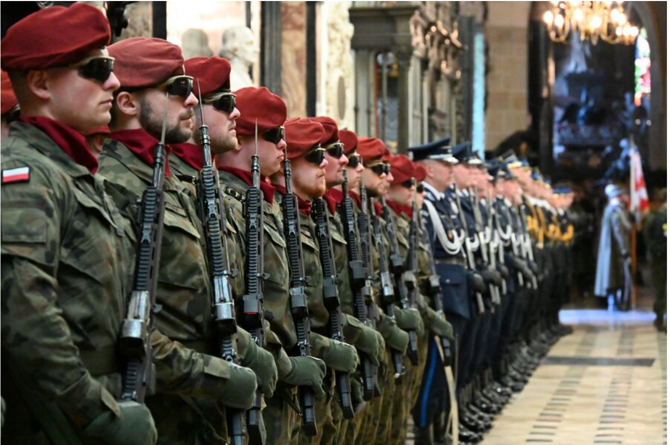
Uroczystości z okazji Święta Narodowego Trzeciego Maja.