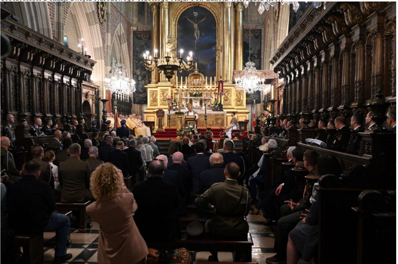
Uroczystości z okazji Święta Narodowego Trzeciego Maja.