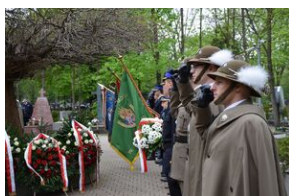
Kierownictwo IPN uczciło w Krakowie ofiary katastrofy smoleńskiej.