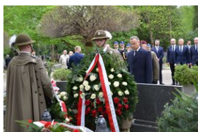
Kierownictwo IPN uczciło w Krakowie ofiary katastrofy smoleńskiej.