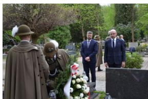
Kierownictwo IPN uczciło w Krakowie ofiary katastrofy smoleńskiej.