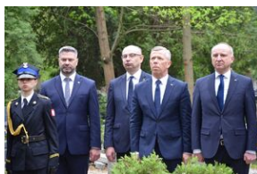
Kierownictwo IPN uczciło w Krakowie ofiary katastrofy smoleńskiej.