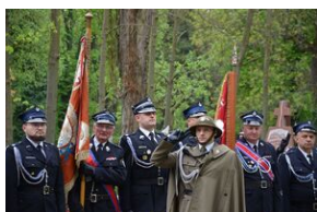
Kierownictwo IPN uczciło w Krakowie ofiary katastrofy smoleńskiej.