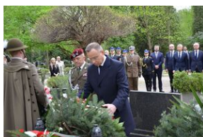
Kierownictwo IPN uczciło w Krakowie ofiary katastrofy smoleńskiej.