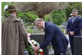
Kierownictwo IPN uczciło w Krakowie ofiary katastrofy smoleńskiej.