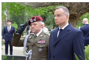
Kierownictwo IPN uczciło w Krakowie ofiary katastrofy smoleńskiej.