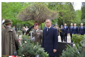
Kierownictwo IPN uczciło w Krakowie ofiary katastrofy smoleńskiej.