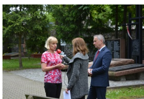
Uroczystości w Kielcach.