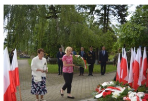
Uroczystości w Kielcach.