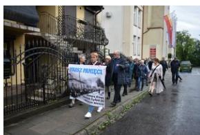
80. rocznica zagłady olkuskich Żydów