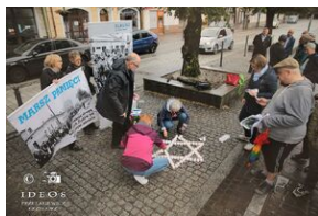
80. rocznica zagłady olkuskich Żydów