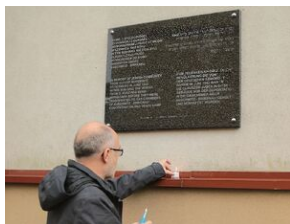
80. rocznica zagłady olkuskich Żydów

czerwca 1942 r. Niemcy zlikwidowali getto w Olkuszu.