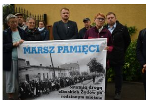
80. rocznica zagłady olkuskich Żydów