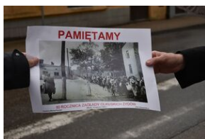
80. rocznica zagłady olkuskich Żydów