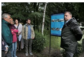
80. rocznica zagłady olkuskich Żydów