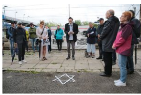
80. rocznica zagłady olkuskich Żydów