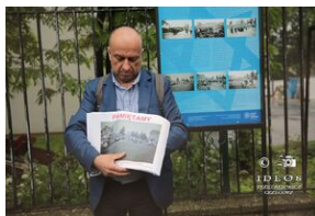
80. rocznica zagłady olkuskich Żydów