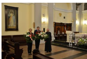
62. rocznica śmierci gen. Józefa Hallera.