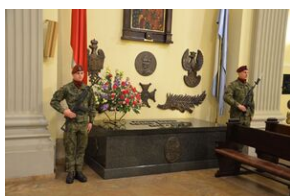
62. rocznica śmierci gen. Józefa Hallera.

W czasie I wojny światowej gen. Józef Haller dowodził m.in. II Brygadą Legionów Polskich, a potem Błękitną Armią, sformowaną we Francji z polskich ochotników. Zajmował dla Polski Pomorze Gdańskie. To on dokonał symbolicznych zaślubin z Bałtykiem, wrzucając pierścień w morskie fale. W 1920 r., w krytycznym momencie wojny polsko-bolszewickiej, gdy ważyły się losy RP, stanął na czele Armii Ochotniczej. Swymi czynami inspirował licznych malarzy, muzyków i poetów. Zmarł 4 czerwca 1960 r. na emigracji w Londynie. Prochy sprowadzono z Anglii do Krakowa w 1993 r.