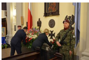
62. rocznica śmierci gen. Józefa Hallera.