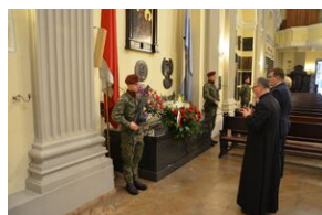
62. rocznica śmierci gen. Józefa Hallera.