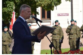
Tarnowskie obchody w 82. rocznicę powstania Polskiego Państwa Podziemnego