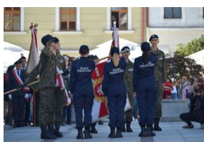
Tarnowskie obchody w 82. rocznicę powstania Polskiego Państwa Podziemnego