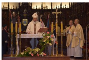
Tarnowskie obchody w 82. rocznicę powstania Polskiego Państwa Podziemnego