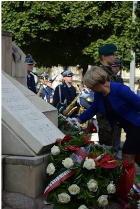
Tarnowskie obchody w 82. rocznicę powstania Polskiego Państwa Podziemnego - fot. Monika Wojtyca (IPN)