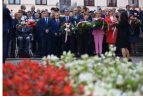
Tarnowskie obchody w 82. rocznicę powstania Polskiego Państwa Podziemnego