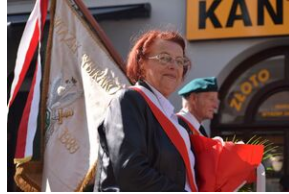
Tarnowskie obchody w 82. rocznicę powstania Polskiego Państwa Podziemnego