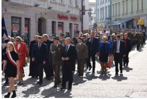
Tarnowskie obchody w 82. rocznicę powstania Polskiego Państwa Podziemnego