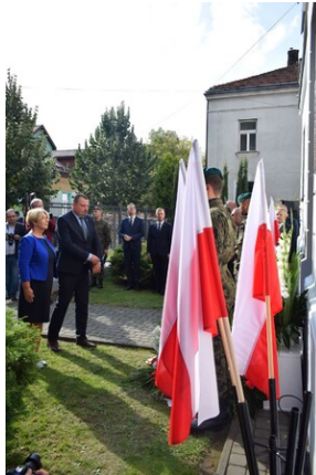
Tarnowskie obchody w 82. rocznicę powstania Polskiego Państwa Podziemnego - fot. Monika Wojtyca (IPN)