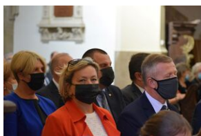
Tarnowskie obchody w 82. rocznicę powstania Polskiego Państwa Podziemnego