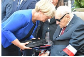
Tarnowskie obchody w 82. rocznicę powstania Polskiego Państwa Podziemnego