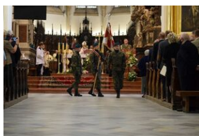
Tarnowskie obchody w 82. rocznicę powstania Polskiego Państwa Podziemnego