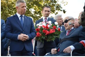
Tarnowskie obchody w 82. rocznicę powstania Polskiego Państwa Podziemnego