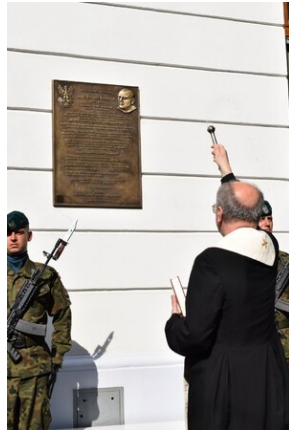
Tarnowskie obchody w 82. rocznicę powstania Polskiego Państwa Podziemnego