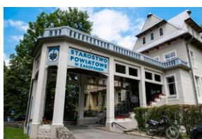
Wystawa „Mariusz Zaruski” w Starostwie Tatrzańskim.