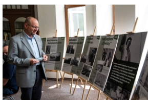
Wystawa „Mariusz Zaruski” w Starostwie Tatrzańskim.