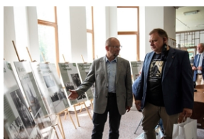
Wystawa „Mariusz Zaruski” w Starostwie Tatrzańskim.