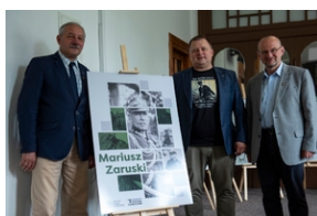
Wystawa „Mariusz Zaruski” w Starostwie Tatrzańskim.