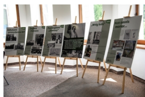
Wystawa „Mariusz Zaruski” w Starostwie Tatrzańskim.