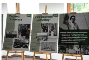
Wystawa „Mariusz Zaruski” w Starostwie Tatrzańskim.