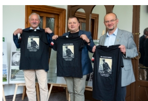
Wystawa „Mariusz Zaruski” w Starostwie Tatrzańskim.