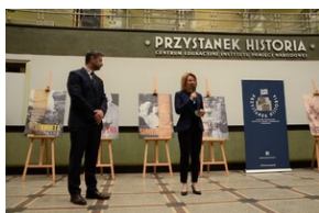
Otwarcie wystawy

W Krakowie wystawa prezentowana jest w związku ze 101. rocznicą urodzin Jana Pawła II (18 maja 1920 r.) i 40. rocznica śmierci kard. Stefana Wyszyńskiego (28 maja 1981 r.).