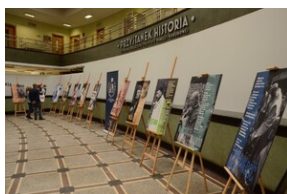
Otwarcie wystawy