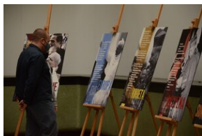
Otwarcie wystawy