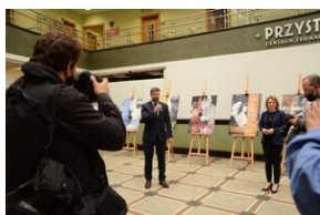
Otwarcie wystawy