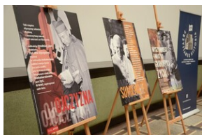
Otwarcie wystawy