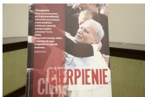
Otwarcie wystawy