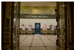
Otwarcie wystawy