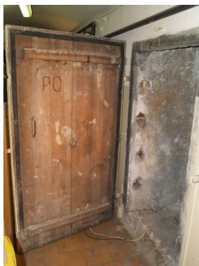
Dawny areszt MUBP przy ul. Kapucyńskiej w Krakowie.

Sfinansowana przez Oddział IPN w Krakowie tablica została zamontowana 30 października 2020 r., ale z powodu pandemii koronawirusa uroczystość została przesunięta. Autorem tablicy jest krakowski artysta rzeźbiarz Wojciech Batko.