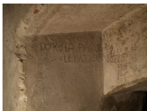
Dawny areszt MUBP przy ul. Kapucyńskiej w Krakowie.