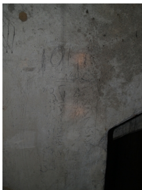
Dawny areszt MUBP przy ul. Kapucyńskiej w Krakowie.