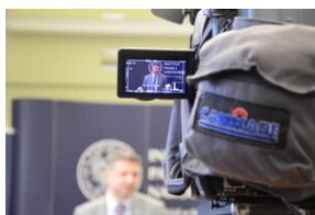
Premiera edukacyjnego spotu wideo