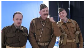
Migawki z planu filmowego