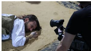
Migawki z planu filmowego

Zdjęcia realizowane były w styczniu 2021 r., w krakowskim studio filmowym oraz w malowniczych okolicach Białego Kościoła. To tutaj zarejestrowano plenerowe sceny potyczek polskich oddziałów partyzanckich z Niemcami oraz przyjęcia na placówce zrzutu skoczków i zaopatrzenia dla AK.