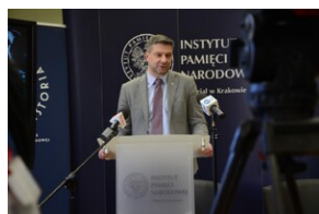
Premiera edukacyjnego spotu wideo