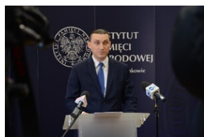
Premiera edukacyjnego spotu wideo