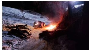
Migawki z planu filmowego