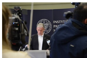
Premiera edukacyjnego spotu wideo

Premierowy pokaz spotu nastąpił 15 lutego 2021 r. podczas briefingu prasowego w Centrum Edukacyjnym „Przystanek Historia” IPN w Krakowie. Spot można oglądać m.in. na stronie internetowej: krakow.ipn.gov.pl oraz w mediach społecznościowych krakowskiego IPN.