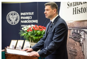
Kraków, 21.12.2020. Ogłoszenie laureatów IX edycji nagrody Świadek Historii.