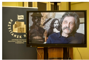
Kraków, 21.12.2020. Ogłoszenie laureatów IX edycji nagrody Świadek Historii.