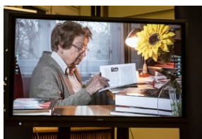
Kraków, 21.12.2020. Ogłoszenie laureatów IX edycji nagrody Świadek Historii.