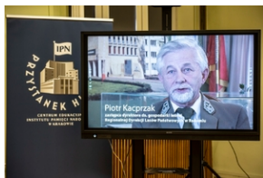
Kraków, 21.12.2020. Ogłoszenie laureatów IX edycji nagrody Świadek Historii.