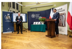
Kraków, 21.12.2020. Ogłoszenie laureatów IX edycji nagrody Świadek Historii.