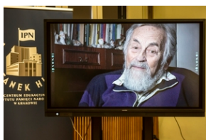
Kraków, 21.12.2020. Ogłoszenie laureatów IX edycji nagrody Świadek Historii.