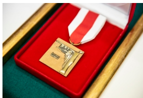
Kraków, 21.12.2020. Ogłoszenie laureatów IX edycji nagrody Świadek Historii.

Z powodu pandemii koronawirusa w tym roku nie mogliśmy zorganizować tradycyjnej uroczystości wręczenia medali Świadek Historii. Laureatów, osoby zgłaszające oraz gości honorowych zaprosimy na spotkanie, gdy tylko sytuacja epidemiologiczna na to pozwoli. Miejmy nadzieję, że nastąpi to już wkrótce.