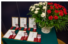
Kraków, 21.12.2020. Ogłoszenie laureatów IX edycji nagrody Świadek Historii.