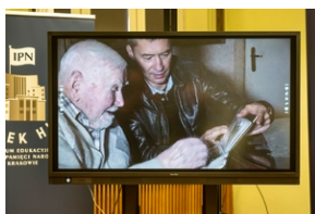
Kraków, 21.12.2020. Ogłoszenie laureatów IX edycji nagrody Świadek Historii.