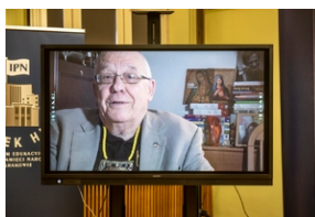
Kraków, 21.12.2020. Ogłoszenie laureatów IX edycji nagrody Świadek Historii.