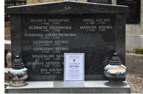
Pożegnanie ppłk. Stanisława Szury „Zamorskiego”