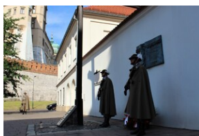
Upamiętnienie ofiar operacji polskiej NKWD