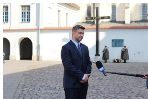
Upamiętnienie ofiar operacji polskiej NKWD