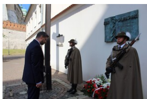
Upamiętnienie ofiar operacji polskiej NKWD

Dziś symbolem komunistycznych zbrodni jest przede wszystkim rozstrzelanie polskich jeńców w Katyniu, Charkowie, Miednoje i innych miejscach kaźni z lat 1940-1941, tymczasem w ramach operacji polskiej NKWD zginęło dziesięć razy więcej niewinnych ludzi. Tragiczne wydarzenia sprzed ponad 80 lat są jednak w Polsce niemal nieznanne. W czasach komunizmu był to temat tabu, a w odróżnieniu od tragedii katyńskiej czy wołyńskiej, powszechna pamięć o operacji polskiej NKWD nie została wciąż przywrócona.