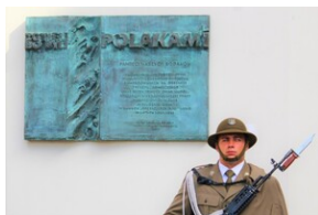
Upamiętnienie ofiar operacji polskiej NKWD