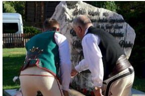
Łąpsze Niżne, 28.07.2020. Uroczystości w 100. rocznicę powrotu Spisza do Polski.