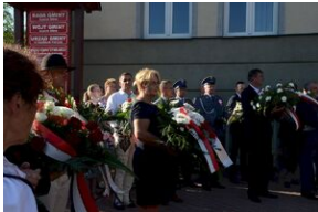
Łąpsze Niżne, 28.07.2020. Uroczystości w 100. rocznicę powrotu Spisza do Polski.