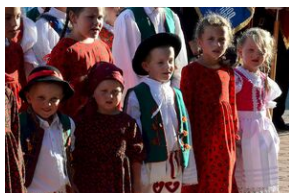
Łąpsze Niżne, 28.07.2020. Uroczystości w 100. rocznicę powrotu Spisza do Polski.