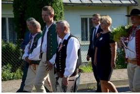
Łąpsze Niżne, 28.07.2020. Uroczystości w 100. rocznicę powrotu Spisza do Polski.