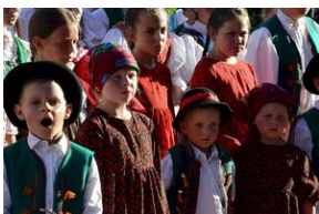
Łąpsze Niżne, 28.07.2020. Uroczystości w 100. rocznicę powrotu Spisza do Polski.