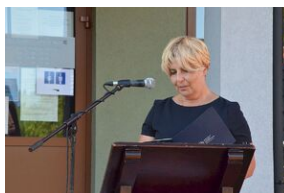
Łąpsze Niżne, 28.07.2020. Uroczystości w 100. rocznicę powrotu Spisza do Polski.