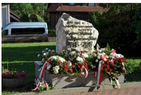
Łąpsze Niżne, 28.07.2020. Uroczystości w 100. rocznicę powrotu Spisza do Polski.