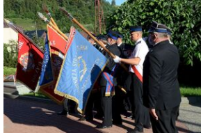
Łąpsze Niżne, 28.07.2020. Uroczystości w 100. rocznicę powrotu Spisza do Polski.