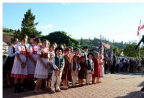
Łąpsze Niżne, 28.07.2020. Uroczystości w 100. rocznicę powrotu Spisza do Polski.