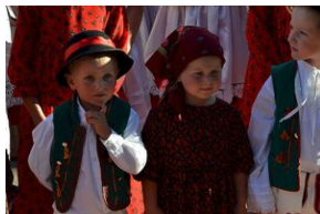
Łąpsze Niżne, 28.07.2020. Uroczystości w 100. rocznicę powrotu Spisza do Polski.