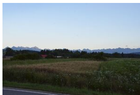
Łąpsze Niżne, 28.07.2020. Uroczystości w 100. rocznicę powrotu Spisza do Polski.