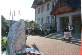
Łąpsze Niżne, 28.07.2020. Uroczystości w 100. rocznicę powrotu Spisza do Polski.