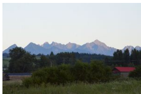
Łąpsze Niżne, 28.07.2020. Uroczystości w 100. rocznicę powrotu Spisza do Polski.