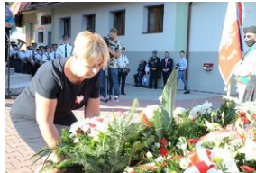
Łąpsze Niżne, 28.07.2020. Uroczystości w 100. rocznicę powrotu Spisza do Polski.