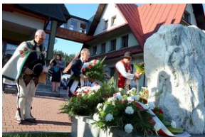
Łąpsze Niżne, 28.07.2020. Uroczystości w 100. rocznicę powrotu Spisza do Polski.