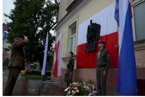
11.07.2020. W Krakowie uczczono 76. rocznicę akcji specjalnej Koppé.