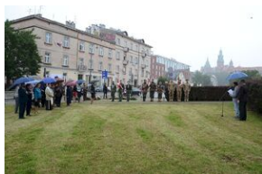
11.07.2020. W Krakowie uczczono 76. rocznicę akcji specjalnej Koppe.

Od lat w rocznicę akcji spotykają się przedstawiciele środowisk kombatanckich oraz harcerze, by uczcić pamięć bohaterskich żołnierzy batalionu „Parasol” i Okręgu Kraków AK. W uroczystościach uczestniczą także żołnierze Wojska Polskiego, szczególnie Jednostki Wojskowej Komandosów z Lublińca, dziedziczącej tradycje batalionu „Parasol” i Jednostki Wojskowej „NIL”.