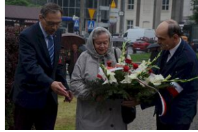
11.07.2020. W Krakowie uczczono 76. rocznicę akcji specjalnej Koppé.