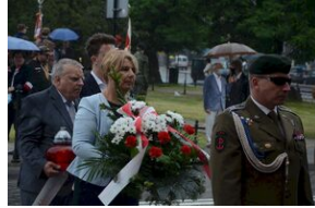
11.07.2020. W Krakowie uczczono 76. rocznicę akcji specjalnej Koppé.