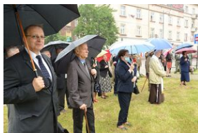
11.07.2020. W Krakowie uczczono 76. rocznicę akcji specjalnej Koppe.