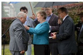
11.07.2020. W Krakowie uczczono 76. rocznicę akcji specjalnej Koppe.