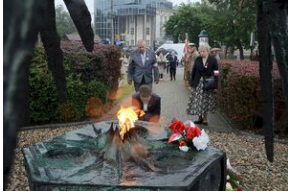
11.07.2020. W Krakowie uczczono 76. rocznicę akcji specjalnej Koppé.