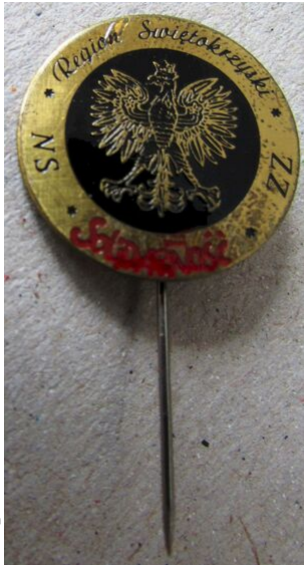
Pamiętkowa przypinka NSZZ „Solidarność” Regionu Świętokrzyskiego.