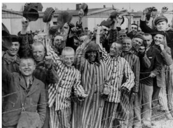
Wyzwoleni przez Amerykanów więźniowie KL Dachau