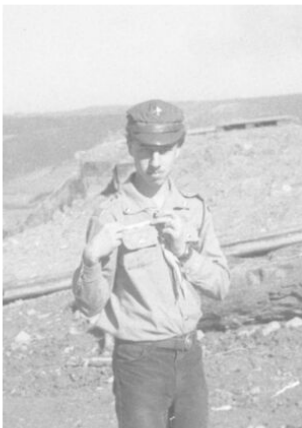
1990. ZHP 1918, kurs drużynowych, Hufiec Harcerzy Kraków IV