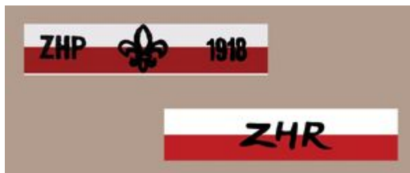
Plakietki ZHP 1918 i ZHR

Hm Jerzy Parzyński.