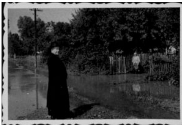
Bp Karol Pękala odwiedzający powódzian, prawdopodobnie 1960 r.