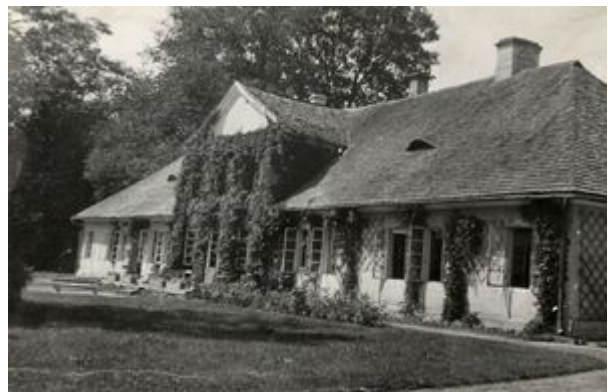
Dwór w Chorzelowie