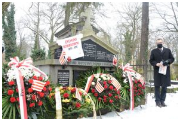
23.01.2021 w Krakowie uczczono 130. rocznicę urodzin Zygmunta Nowakowskiego.

Nie godził się z polityką ustępstw rządu polskiego w Londynie – zarówno wobec