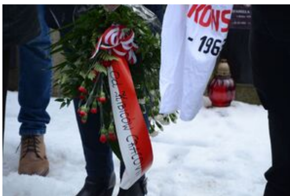
23.01.2021 w Krakowie uczczono 130. rocznicę urodzin Zygmunta Nowakowskiego.