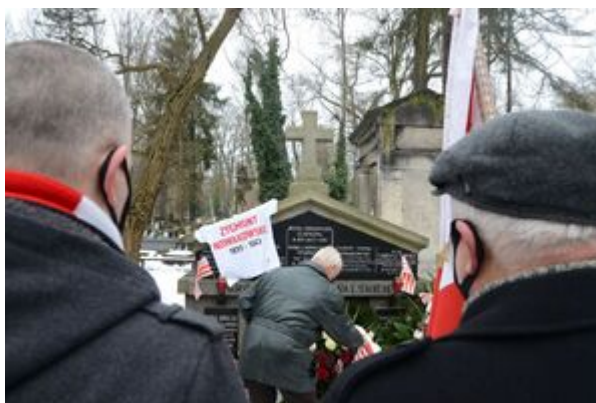
23.01.2021 w Krakowie uczczono 130. rocznicę urodzin Zygmunta Nowakowskiego.