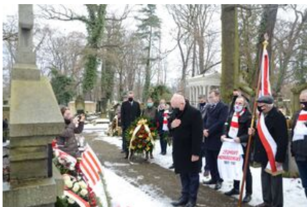
23.01.2021 w Krakowie uczczono 130. rocznicę urodzin Zygmunta Nowakowskiego.