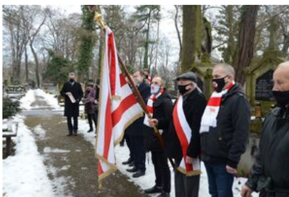
23.01.2021 w Krakowie uczczono 130. rocznicę urodzin Zygmunta Nowakowskiego.