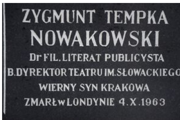
23.01.2021 w Krakowie uczczono 130. rocznicę urodzin Zygmunta Nowakowskiego.