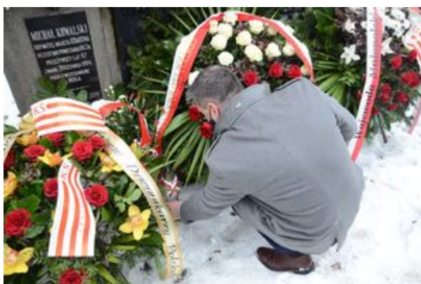
23.01.2021 w Krakowie uczczono 130. rocznicę urodzin Zygmunta Nowakowskiego.