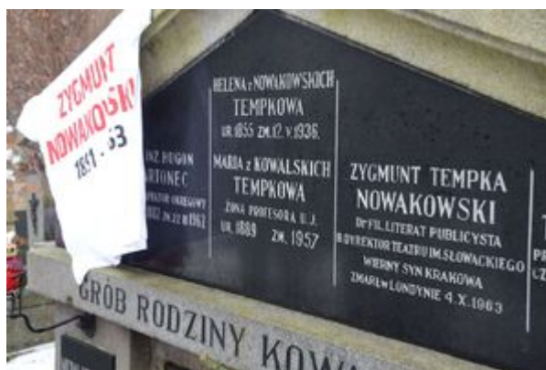
23.01.2021 w Krakowie uczczono 130. rocznicę urodzin Zygmunta Nowakowskiego.