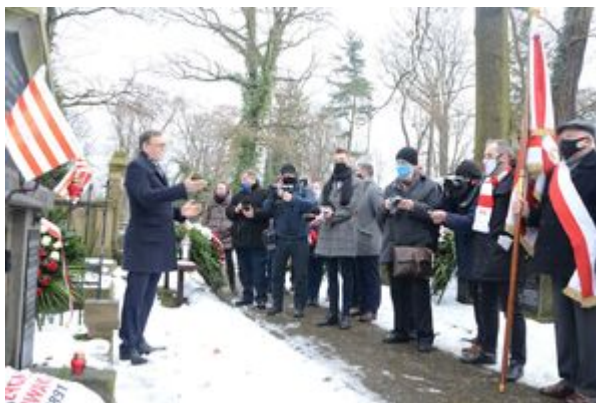
23.01.2021 w Krakowie uczczono 130. rocznicę urodzin Zygmunta Nowakowskiego.