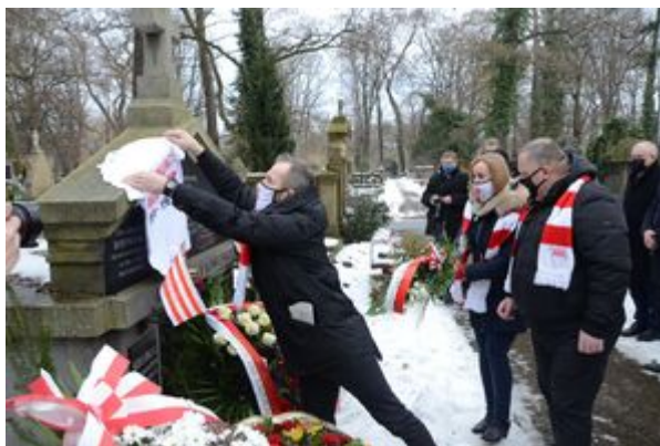
23.01.2021 w Krakowie uczczono 130. rocznicę urodzin Zygmunta Nowakowskiego.