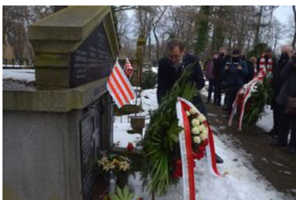
23.01.2021 w Krakowie uczczono 130. rocznicę urodzin Zygmunta Nowakowskiego.