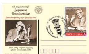
Karta pocztowa, znaczek i datownik na 130. rocznicę urodzin Zygmunta Nowakowskiego