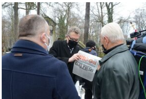
23.01.2021 w Krakowie uczczono 130. rocznicę urodzin Zygmunta Nowakowskiego.