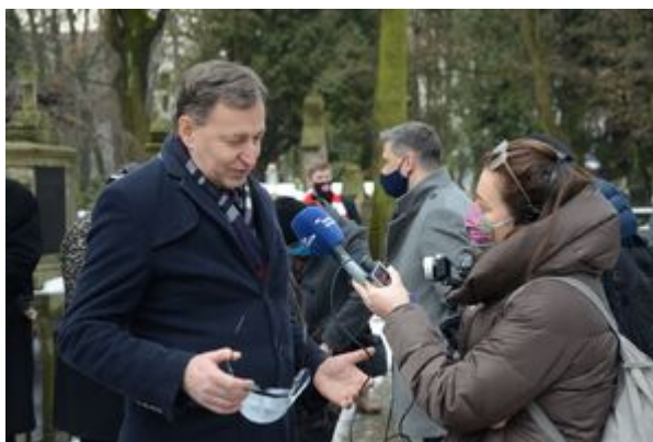
23.01.2021 w Krakowie uczczono 130. rocznicę urodzin Zygmunta Nowakowskiego.

„Samo słowo »Polska« jest jak łyk tęgiego wina...”