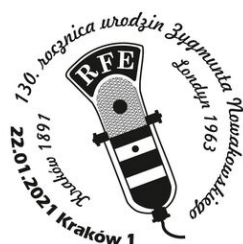
Karta pocztowa, znaczek i datownik na 130. rocznicę urodzin Zygmunta Nowakowskiego