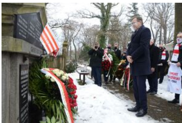
23.01.2021 w Krakowie uczczono 130. rocznicę urodzin Zygmunta Nowakowskiego.