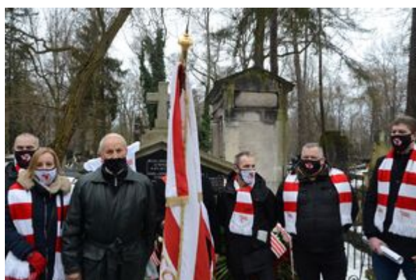
23.01.2021 w Krakowie uczczono 130. rocznicę urodzin Zygmunta Nowakowskiego.