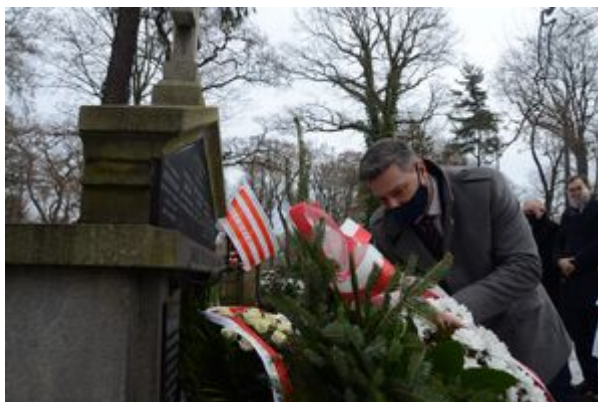
23.01.2021 w Krakowie uczczono 130. rocznicę urodzin Zygmunta Nowakowskiego.

Pierwsza powieść Nowakowskiego – „Wymarsz” – była drukowana w odcinkach na łamach dziennika „Czas” już w 1917 r. Jego nazwisko będzie jednak łączone z inną wielką krakowską gazetą – „Ilustrowanym Kurierem Codziennym”. Od roku 1930 do wybuchu wojny publikował tam niedzielne felietony. Wywoływały burzliwe reakcje i ataki na autora, ale przyniosły mu także popularność, ukazując się w dziewięciu wydaniach książkowych.