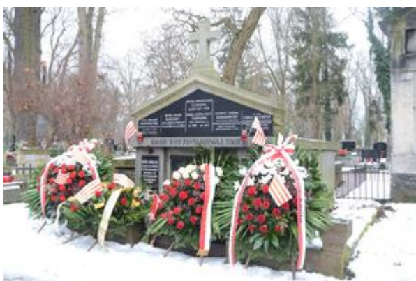
23.01.2021 w Krakowie uczczono 130. rocznicę urodzin Zygmunta Nowakowskiego.