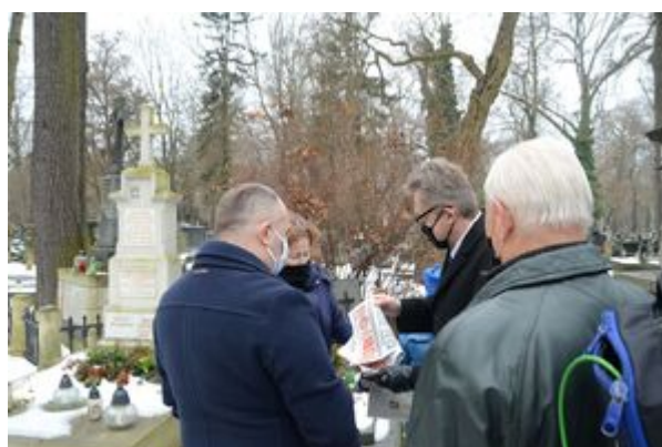
23.01.2021 w Krakowie uczczono 130. rocznicę urodzin Zygmunta Nowakowskiego.