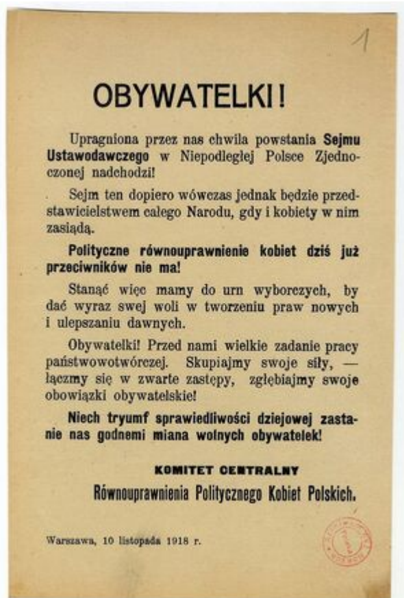
Ulotka programowa Równouprawnienia Politycznego Kobiet Polskich, 1918 r.