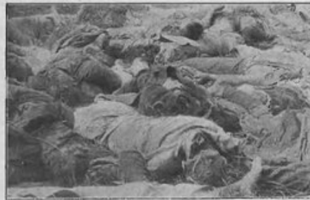
Wzięci do niewoli, rozstrzelani i wyrzuceni samolotami we wsi Lemoniaż ziomki łomżyńskiej pow. łomżyński: 1 pluton 69 p. p., 37 żołnierzy i 5 cywilnych z II-go batalionu Kowieńskiego p. p. dnia 25-go lipca 1920 roku. Pochowani zostali przez ludność m. Kólna.

Odradzająca się w ogniu wojen lat 1918-1921 Rzeczpospolita Polska nie była stroną konwencji haskiej z 1907 r., regulującej kwestie jeńców wojennych, jednak uznawała jej postanowienia. Odnosiło się to także do wojny polsko-bolszewickiej, która rozpoczęła się de facto 4 stycznia 1919 r. w okolicach Wilna, a zakończyła de iure traktatem pokojowym zawartym 18 marca 1921 r. w Rydze. Kończąc wojnę, obie strony w układzie o repatriacji z 24 lutego 1921 r. uznały, że status jeńców mają też wszystkie osoby, które służyły w polskich formacjach zbrojnych walczących z bolszewikami na terenie Rosji w latach 1917-1920.