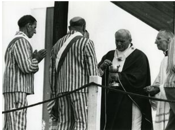
Podczas mszy świętej w Oświęcimiu papież udzielił komunii byłym więźniom niemieckiego obozu zagłady KL Auschwitz

W czerwcu 1979 r. Jan Paweł II po raz pierwszy po wyborze odwiedził ojczystą ziemię. Trwająca osiem dni podróż apostolska rozpoczęła się 2 czerwca w Warszawie, a zakończyła 10 czerwca w Krakowie. Papież był jeszcze w Gnieźnie (3-4 czerwca), Częstochowie (4-6 czerwca), Kalwarii Zebrzydowskiej, Oświęcimiu i Wadowicach (wszystkie trzy miasta 7 czerwca) oraz Nowym Targu (8 czerwca).