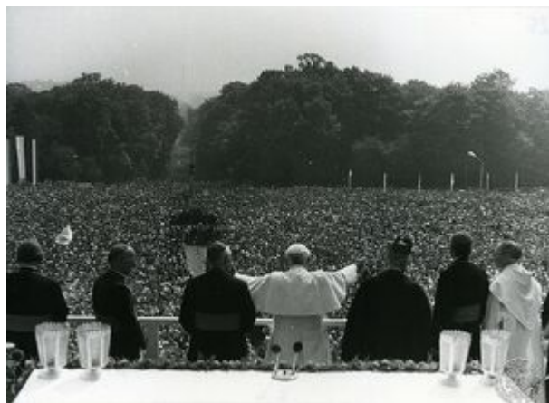
Na Jasnej Górze