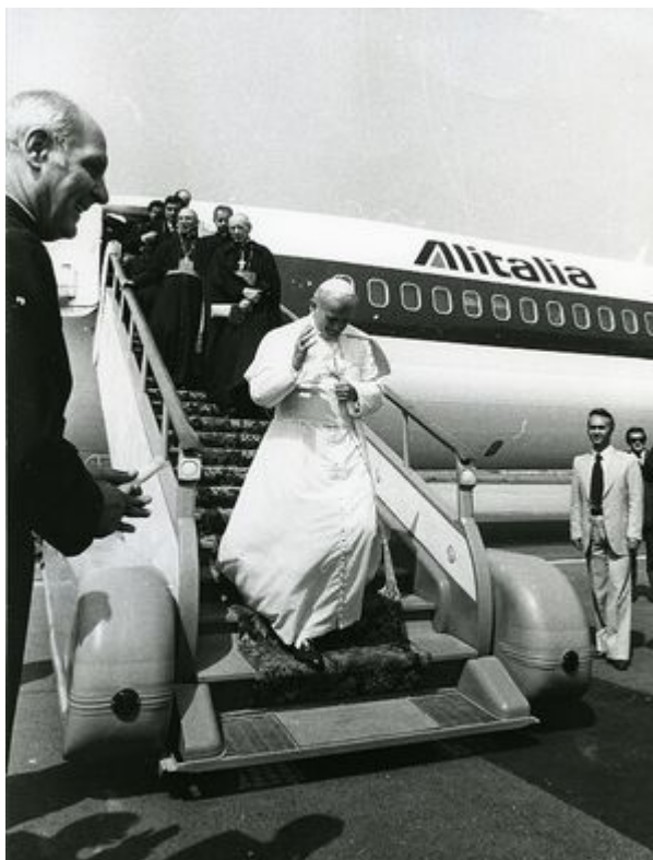
Jan Paweł II przyleciał na Okęcie

Schyłek lat 70. XX wieku był dla komunistów w PRL czasem bardzo trudnym. Po czerwcu 1976 r. rozbudzone zostały opozycyjne nastroje. Powstawały kolejne organizacje, których działacze występowali już całkiem jawnie. Jednocześnie podpisane postanowienia Konferencji Bezpieczeństwa i Współpracy w Europie (KBWE) oraz uzależnienie od kredytów zaciąganych w państwach wolnego świata uniemożliwiały reżimowi stosowanie silnych represji wobec niepokornych. Partyjnych dygnitarzy niepokoiły szczególnie związki opozycji z Kościołem. Tym bardziej, że na współpracę z duchowieństwem zdecydowały się w tym