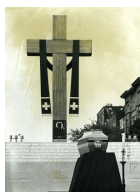
Uroczystość pogrzebo- wa prymasa Stefana Wyszyńskiego