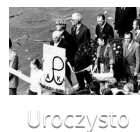
Uroczystość pogrzebo- wa prymasa Stefana Wyszyńskiego