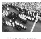
Uroczystość pogrzebo- wa prymasa Stefana Wyszyńskiego