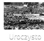
Uroczystość pogrzebo- wa prymasa Stefana Wyszyńskiego